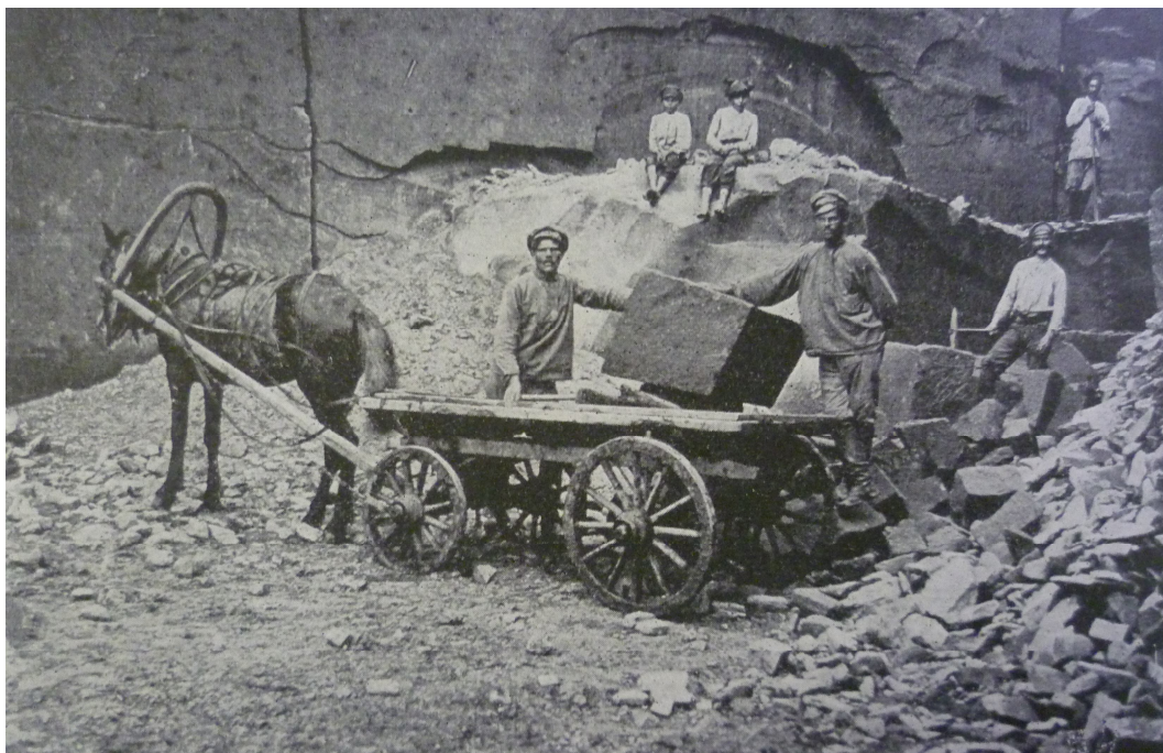
Příloha č. 19: Stavba pomníku padlým československým dobrovolcům 8. střeleckého pluku