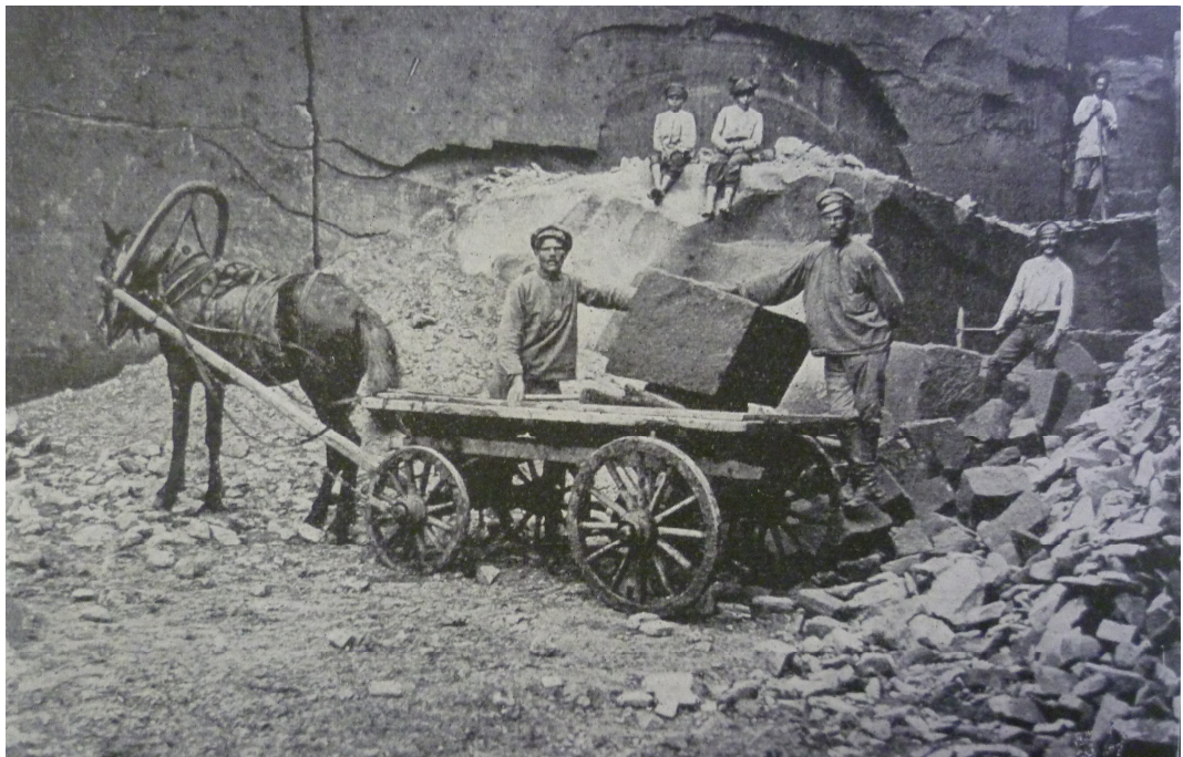
Příloha č. 19: Stavba pomníku padlým československým dobrovolcům 8. střeleckého pluku