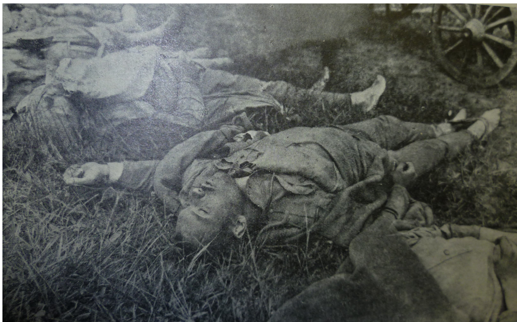
Příloha č. 12: Padlí českoslovenští dobrovolci v boji proti bolševikům na Ussurijské frontě na Dálném Východě.