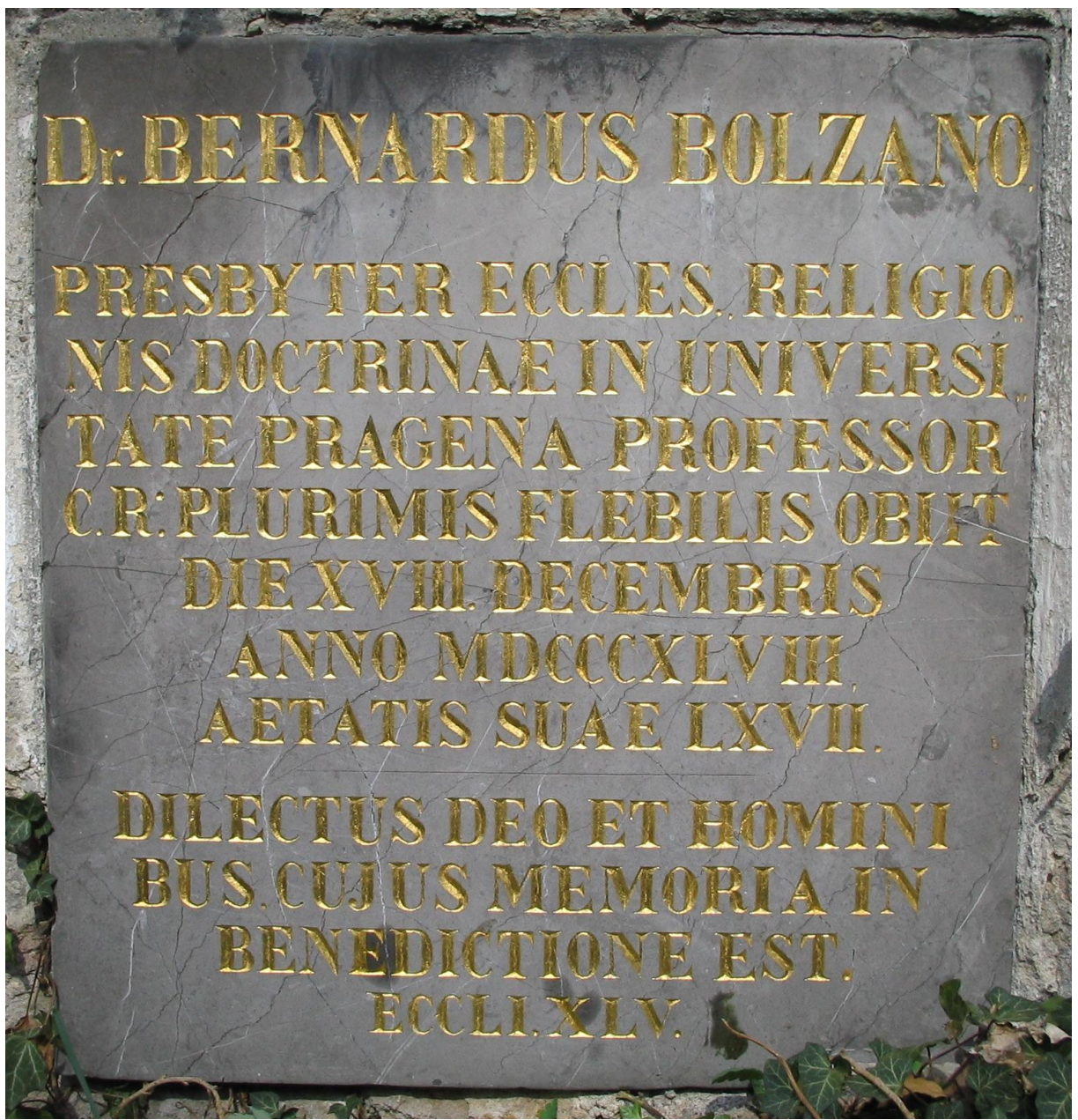
Hrob Bernarda Bolzana na pražských Olšanských hřbitovech.