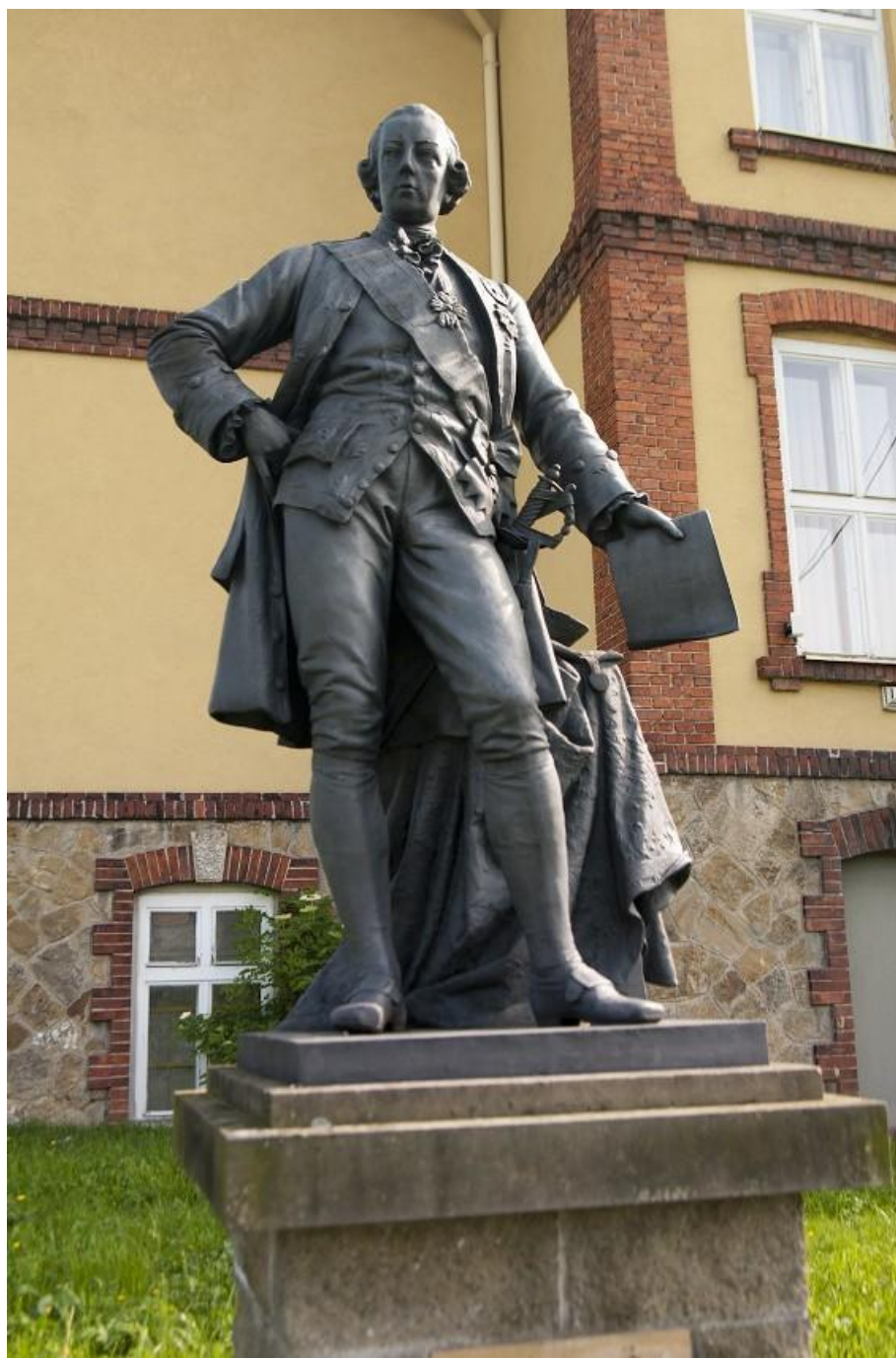
Socha Josefa II. v Suchdole nad Odrou.