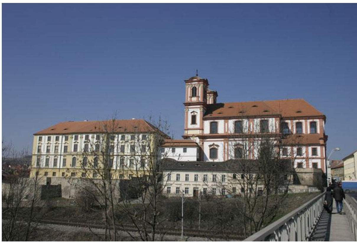
Kněžský seminář v Litoměřicích v bývalé budově jezuitské koleje.