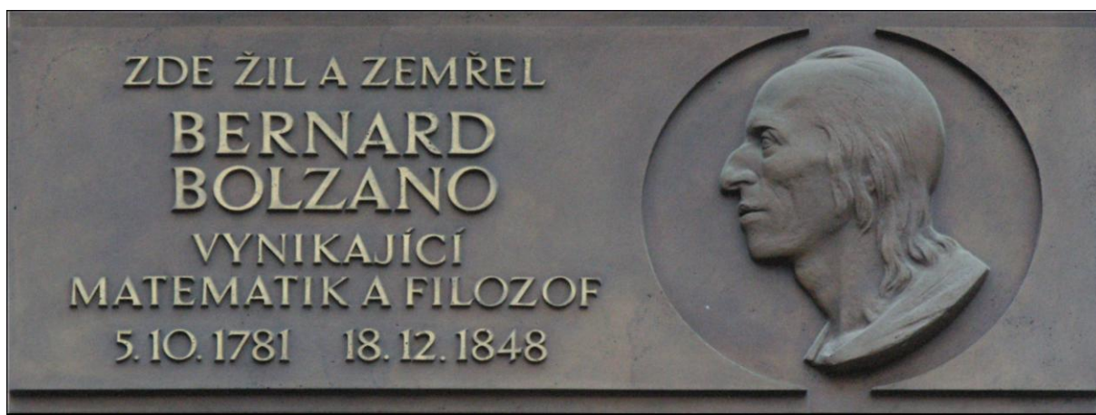
Bernard Bolzano Památní cedule v Celené ulici v Praze.