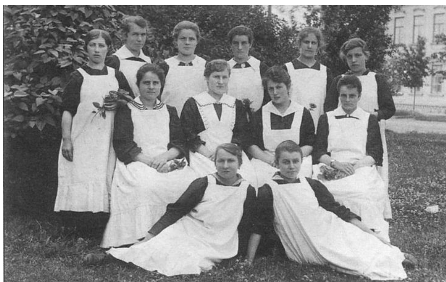
Rok 1917: služební oděv opatrovnic