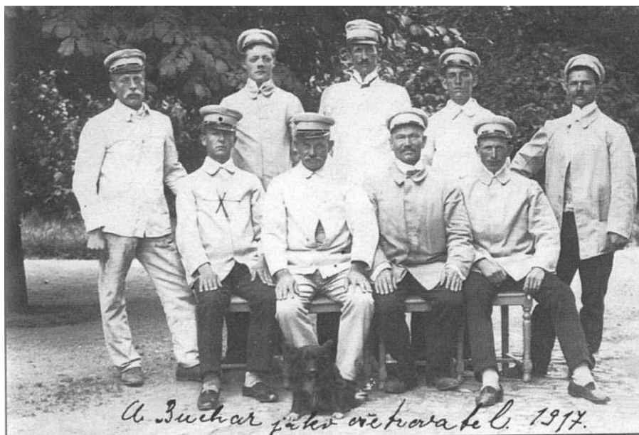
Rok 1917: služební oděv opatrovníků