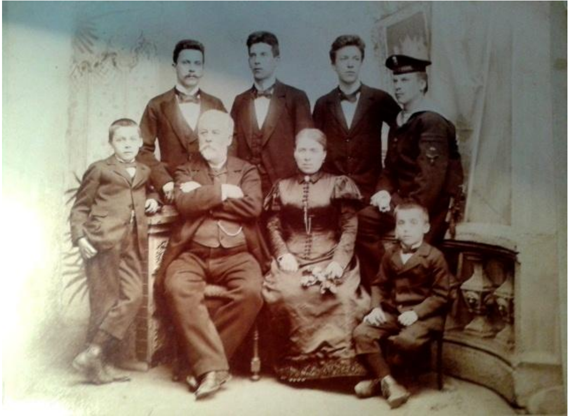
1. Rodinná fotografie Duškových z roku 1898.