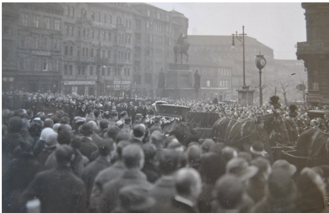
6. Pohřební průvod za rakví Cyrila Duška 8. března 1924 u Národního muzea.