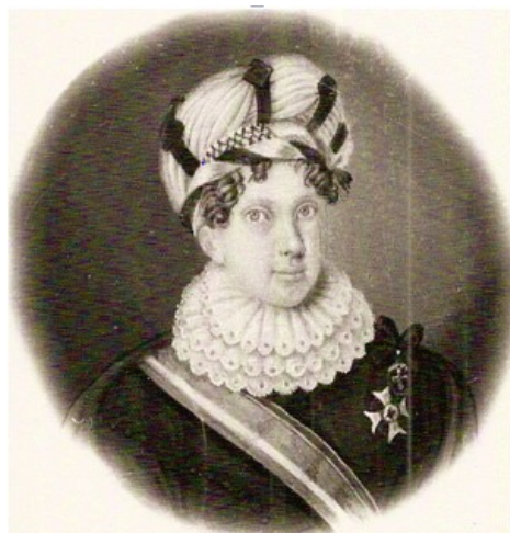
Příloha č. 8 - Leopoldina