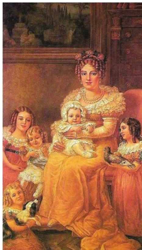
Příloha č. 6 – Markýza ze Santosu, Pedro de Alcântara (Pedro II.), Maria da Glória (Maria II.)