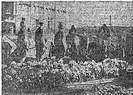
Na obr. vlevo Zastupující říšský protektor H-Oberstgruppenführer a generaloberst polce Daluge při projevu. Vpredu státní prezident dr. Hácha s protektorátní vládou. Na obr. vpravo říšský vedoucí H a náčelník německé policie Heinrich Himmler před katedrálou.

V neděli 7. června konala se o 18. hodině na náměstí národního hradu smuteční slavnost za zavražděného Zastupujícího říšského protektora a šéfa bezpečnostní policie H-Oberstgruppenführera a generála policie Reinharda Heydricha, která se kromě nejblíže příbuzných členů rodiny zesnulého zúčastnili říšský protektor H-Heinrich Himmler, státní prezident dr. Hácha a protektorátní vláda, jakobí velcí počet vůdčích osobností strany, státní branné moci. Přítomní byli také nejvyšší představitelé protektorátních úřadů, šéfredaktor denních listů a skupina z Moravského Slezska v krocích.