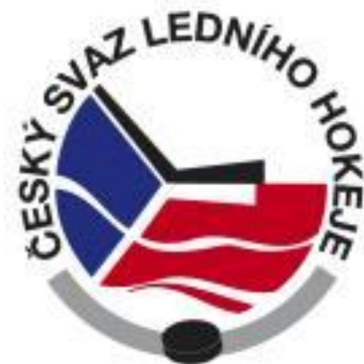
Obrázek 9 Logo ČSLH