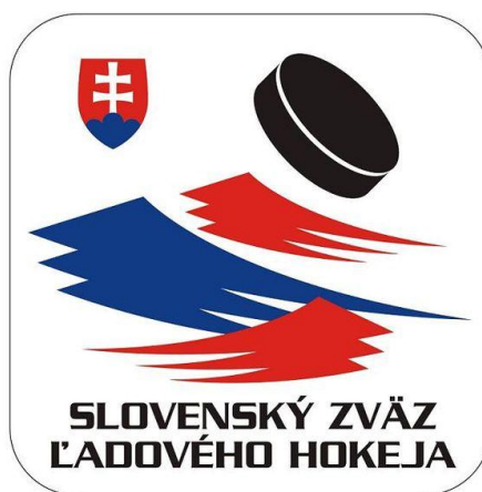
Obrázek 12 Logo Slovenského svazu ledního hokeje