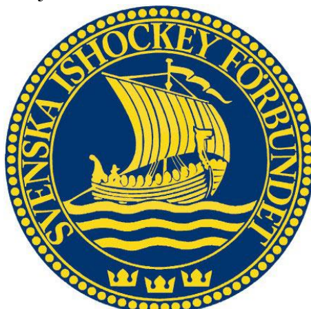
Obrázek 11 Logo Švédské hokejové asociace