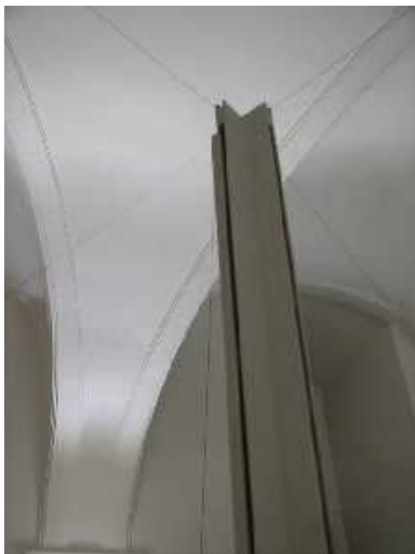
6. Martin Janíček: Zvuková krajina, 9,5 m x 39 m, fotografie z instalace v Jičínské galerii, 2005