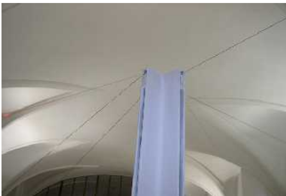
5. Martin Janíček: Zvuková krajina, 9,5 m x 39 m, fotografie z instalace v Jičínské galerii, 2005, foto: Rudolf Šmíd