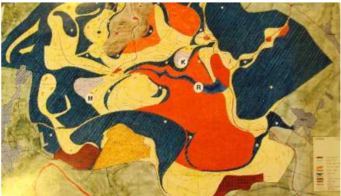
13. Aleš Müller: Severočeská pánev; úvahy o krajině, koncepce nové krajiny - R označuje rokli, M moštárnu a K farmu pro chov koní, 1996, reprodukce z knihy: Václav CÍLEK: Krajinná architektura; nad diplomovou prací Aleše Müllera - Úvaha o krajině, in: Vesmír, Praha 1996, foto: Aleš Müller