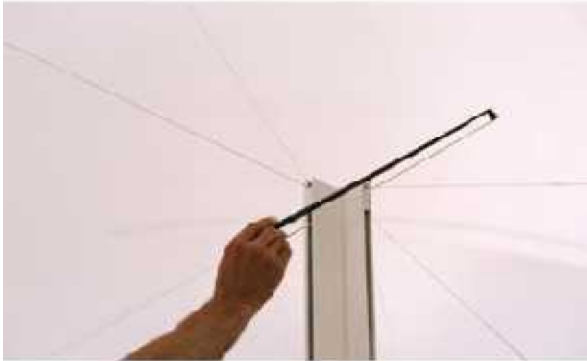
8. Martin Janíček: Zvuková krajina, 9,5 m x 39 m, fotografie z instalace v Jičínské galerii, 2005