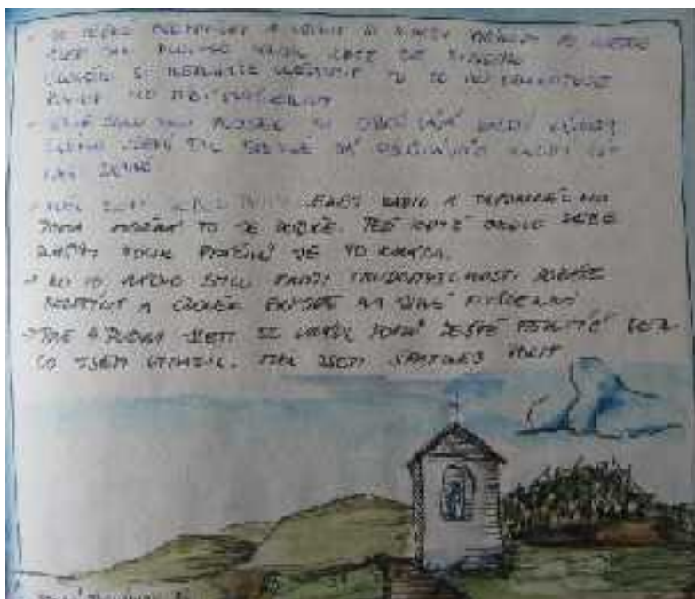
16. Jan Prošek: Putování osamělého poutníka, deník 1. května, 2006, 15 x 15 cm