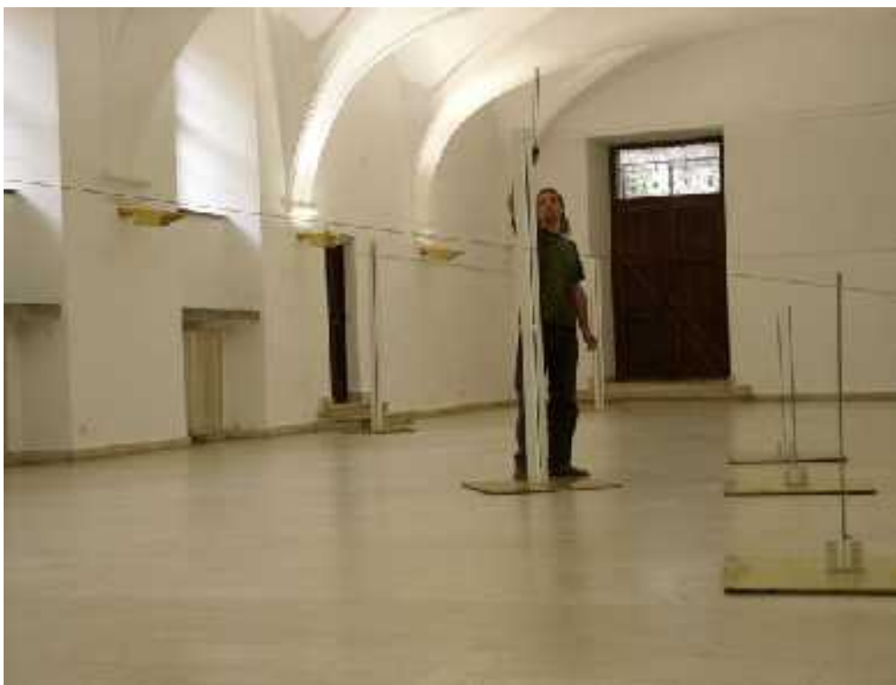
4. Martin Janíček: Zvuková krajina, 9,5 m x 39 m, fotografie z instalace v Jičínské galerii, 2005