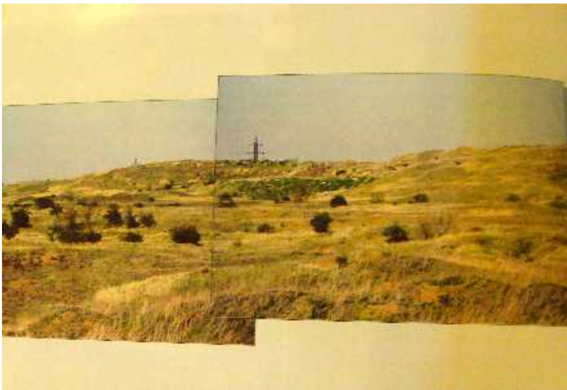
11. Aleš Müller: Severočeská pánev; úvahy o krajině, přirozené zarůstání okrajové části dolu Nástup Tušimice, 1996, reprodukce z knihy: Václav CÍLEK: Krajinná architektura; nad diplomovou prací Aleše Müllera - Úvaha o krajině, in: Vesmír, Praha 1996, foto: Aleš Müller