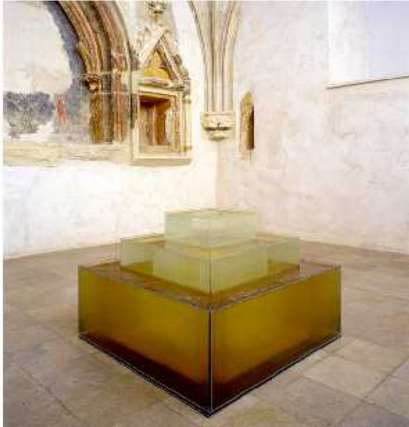
1. Ivana Hanzlíková: Procesy, 50x72x72 cm, reprodukce z knihy: Krajina-Landscape (kat.výst.), Marta SMOLÍKOVÁ (ed.), Praha 1993, foto: Vladimír Goralčík