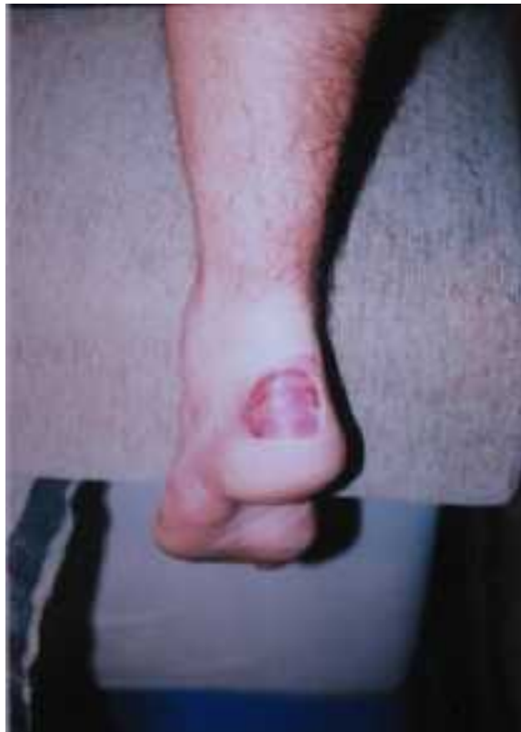
15. Jan Prošek: Putování osamělého poutníka, Noha, 9 x 13 cm, 2006