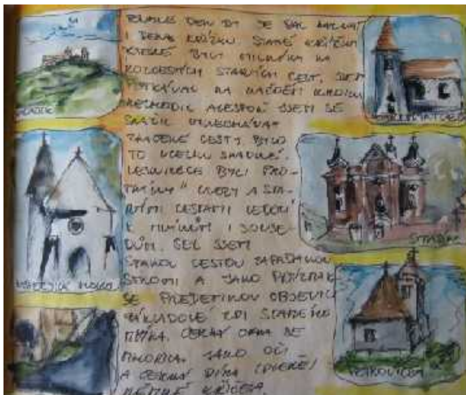
18. Jan Prošek: Putování osamělého poutníka, deník 29. duben, 2006, 15 x 15 cm