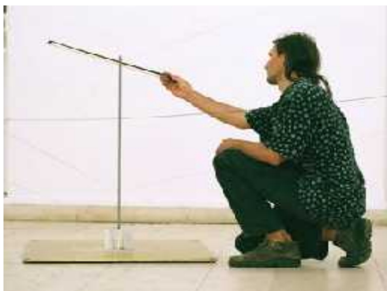
7. Martin Janíček: Zvuková krajina, 9,5 m x 39 m, fotografie z instalace v Jičínské galerii, 2005