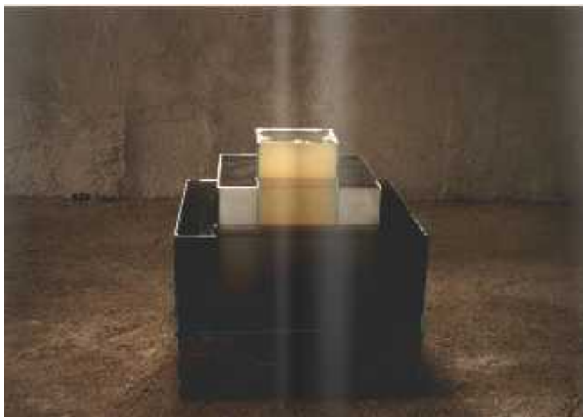
2. Ivana Hanzlíková: Procesy, 50x72x72 cm, reprodukce z diplomové práce autorky, Praha 1992