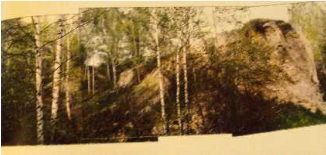
10. Aleš Müller: Severočeská pánev; úvahy o krajině, přirozené zarůstání okrajové části dolu Nástup Tušimice, 1996, reprodukce z knihy: Václav CÍLEK: Krajinná architektura; nad diplomovou prací Aleše Müllera - Úvaha o krajině, in: Vesmír, Praha 1996, foto: Aleš Müller