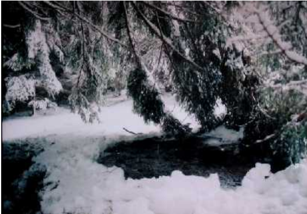
14. Jan Prošek: Putování osamělého poutníka, Místa k přespání, 9 x 13 cm, 2006, foto: Jan Prošek