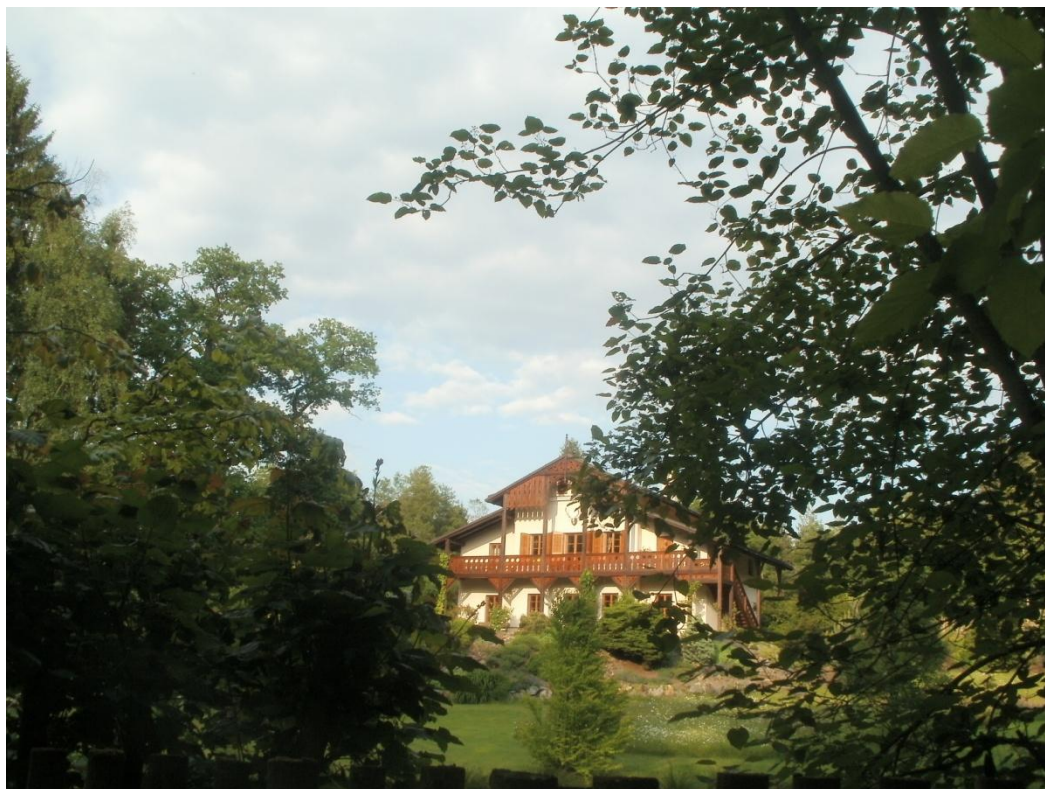
Zámek Loučeň – Loučeňka