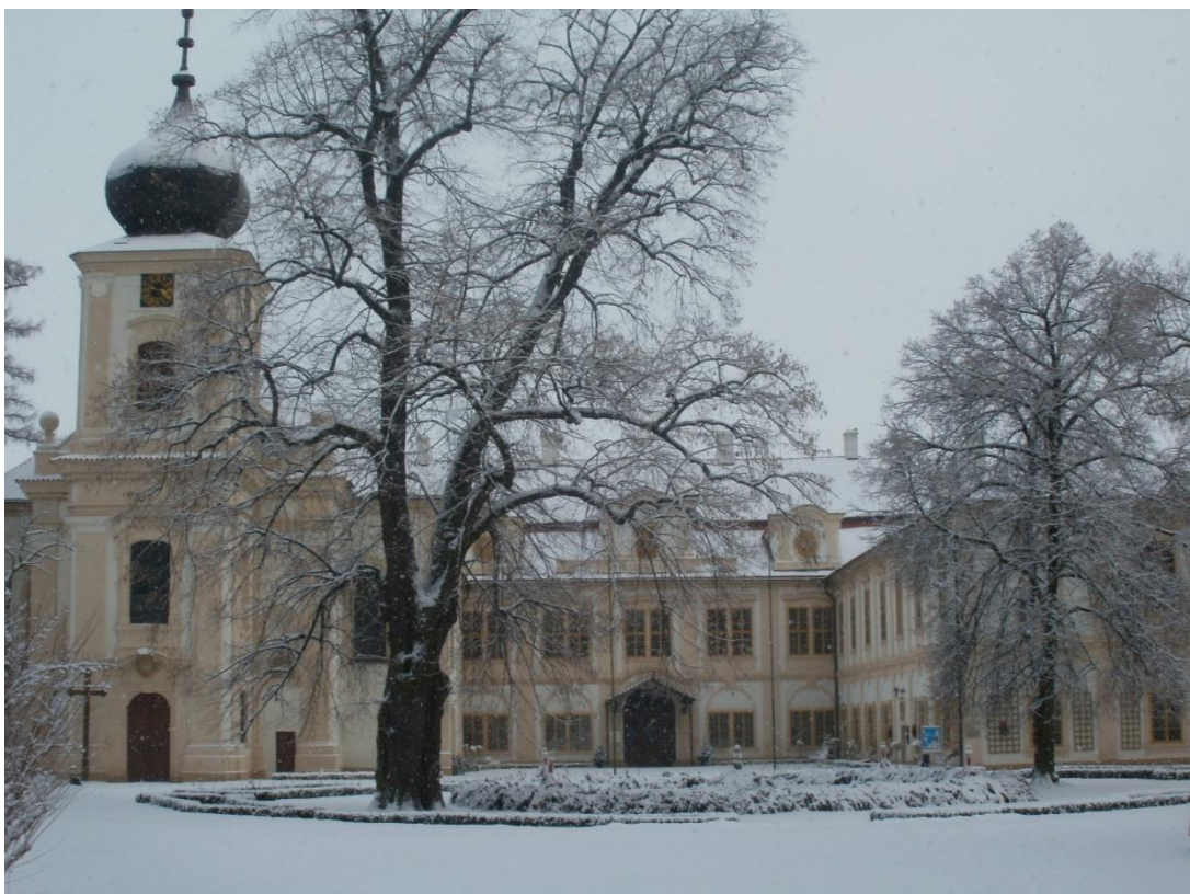
Zámek Loučeň - březen 2013