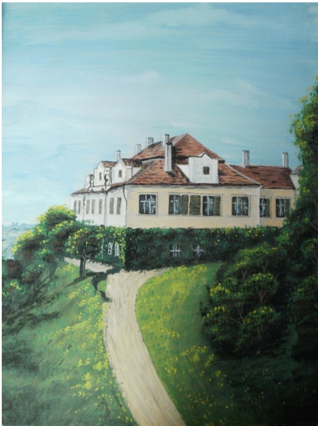
Pamětní kniha 1925 - 1935