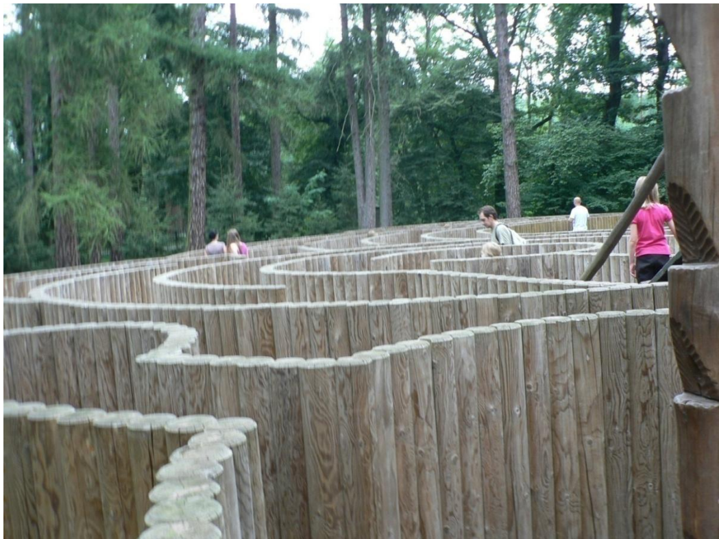
Zámek Loučeň - labyrintrárium