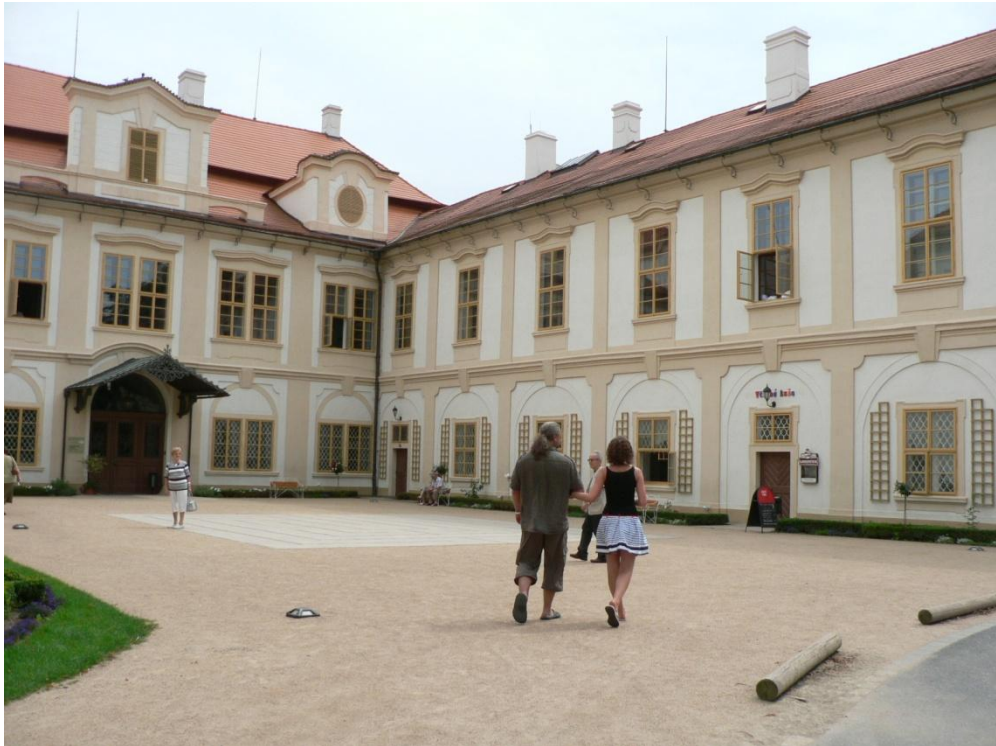
Zámek Loučeň - červenec 2012