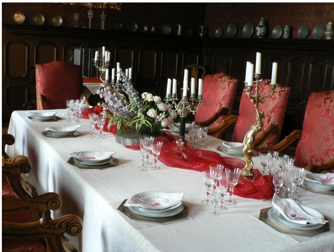
Zámek Loučeň - jídelna