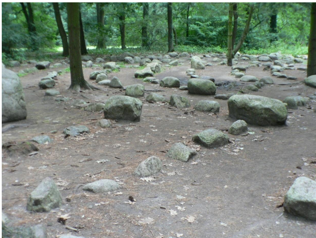
Zámek Loučeň - labyrintrárium