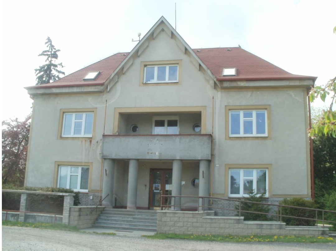
Zámek Loučň - Klausova vila