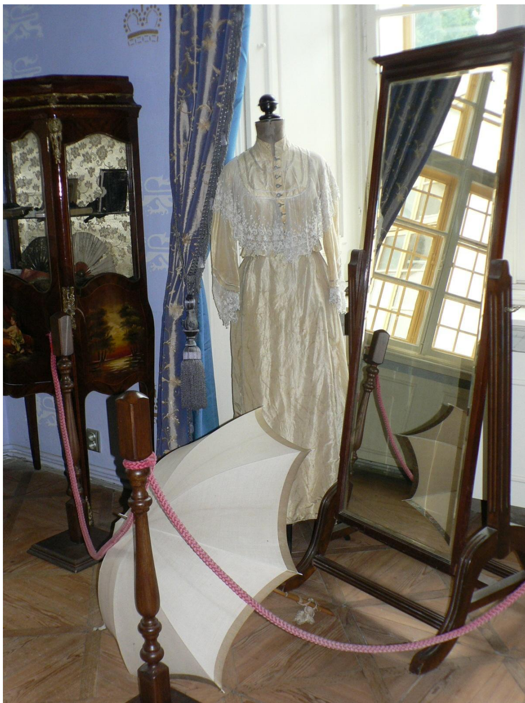
Zámek Loučeň - šatna kněžny