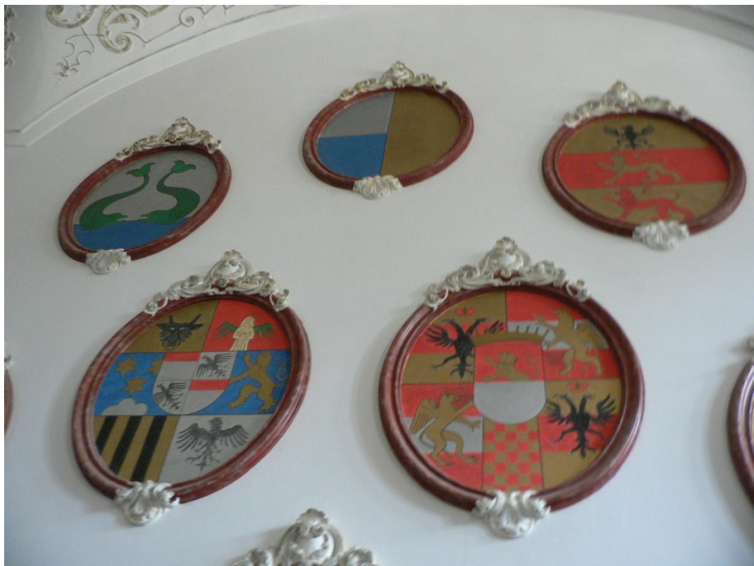
Zámek Loučeň - vstupní hala, erby