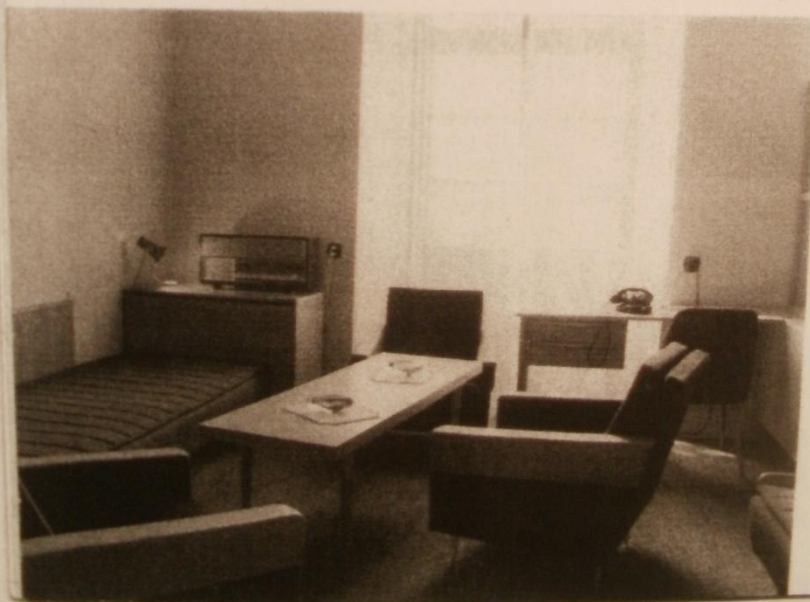
Zámek Loučeň - Ústřední dopravní institut (brožura ÚDI)