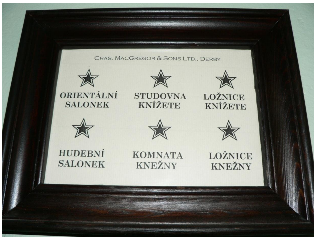
Zámek Loučeň - signalizační zařízení pro služebnictvo