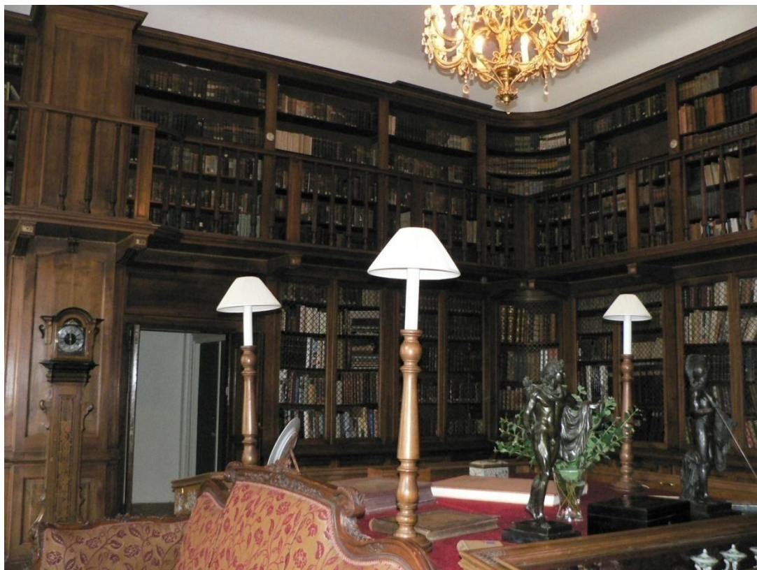
Zámek Loučeň - knihovna