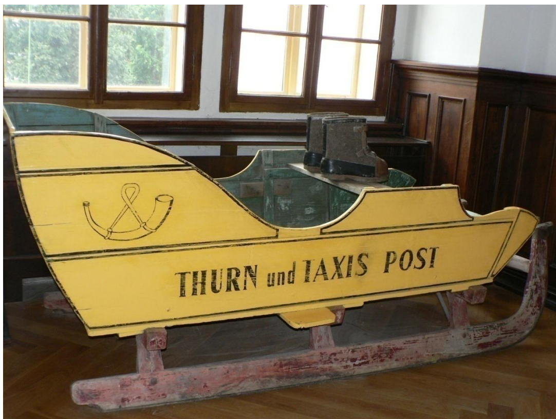
Zámek Loučeň - schodišťová hala se saněmi