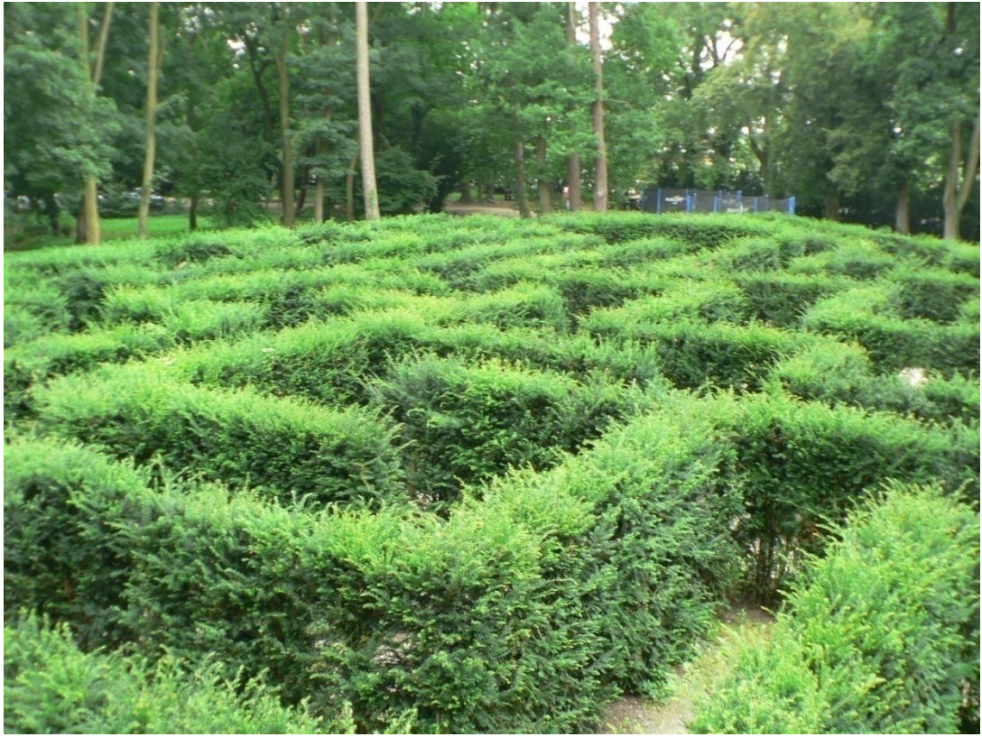
Zámek Loučeň - labyrintrárium