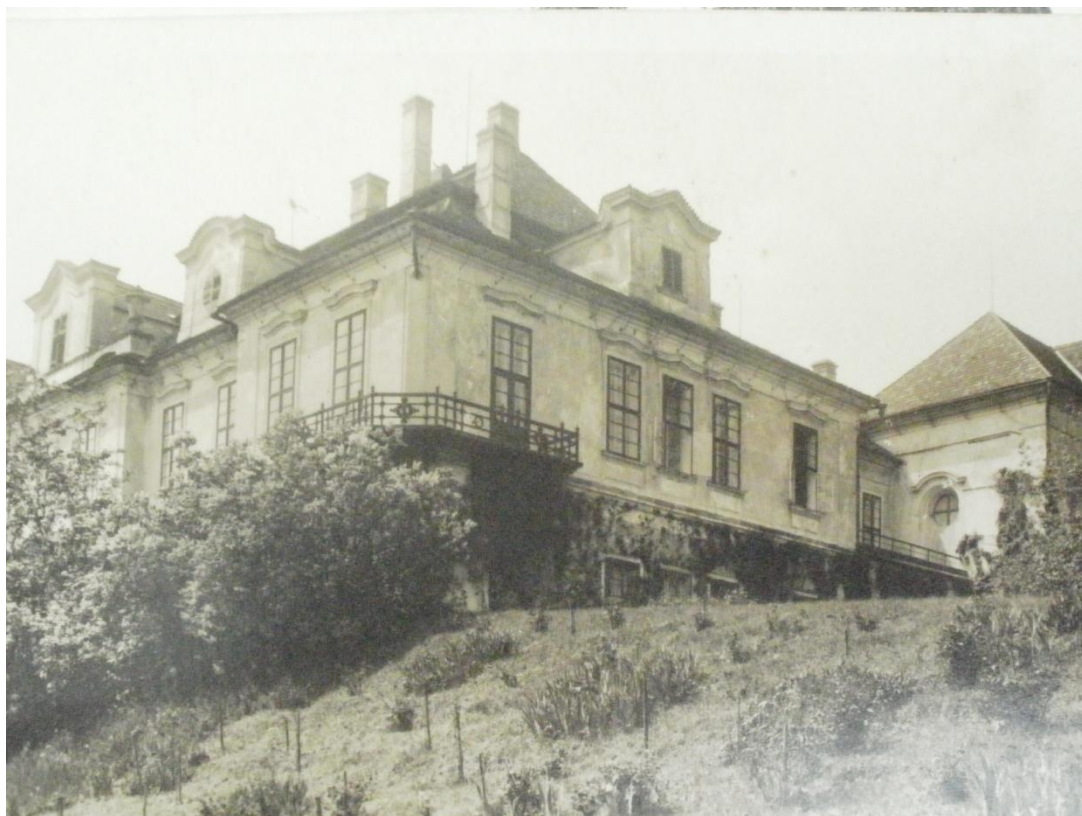
Zámek Loučeň - zámek 1. pol. 20. století