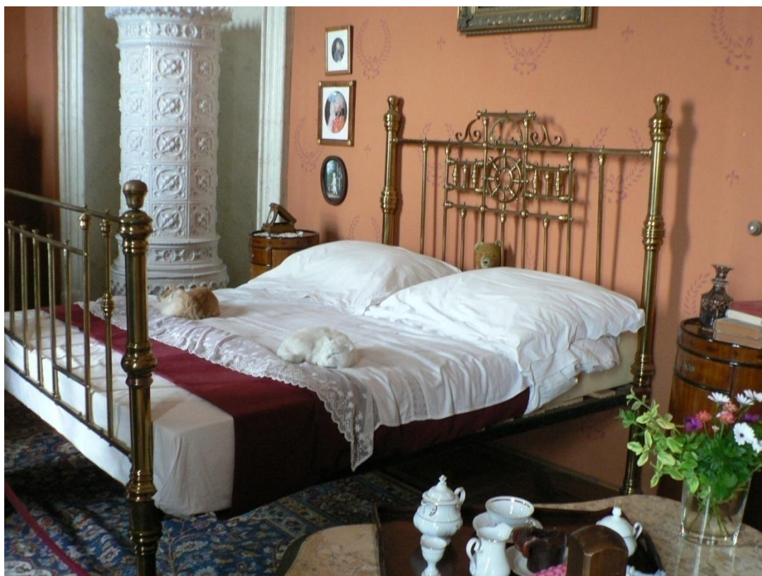
Zámek Loučeň - Alexandrova ložnice