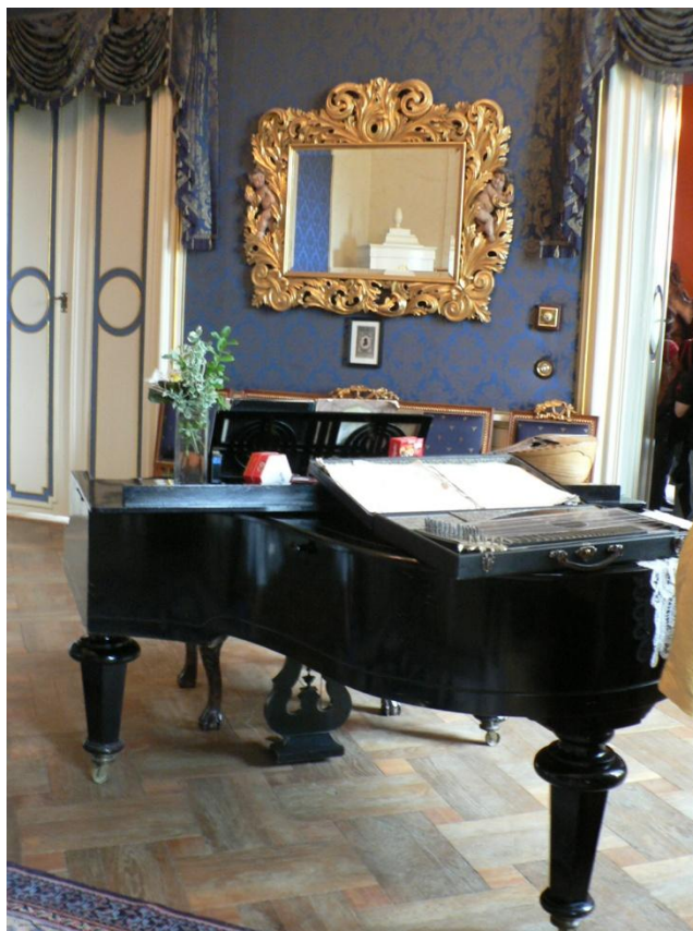
Zámek Loučeň - Hudební salónek