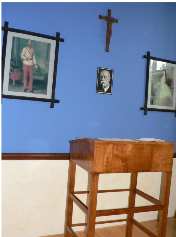
Zámek Loučeň - učebna