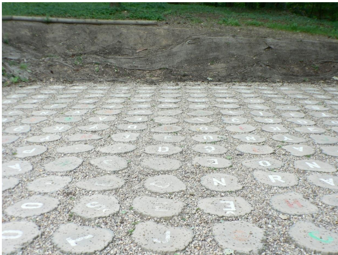
Zámek Loučeň - labyrintrárium