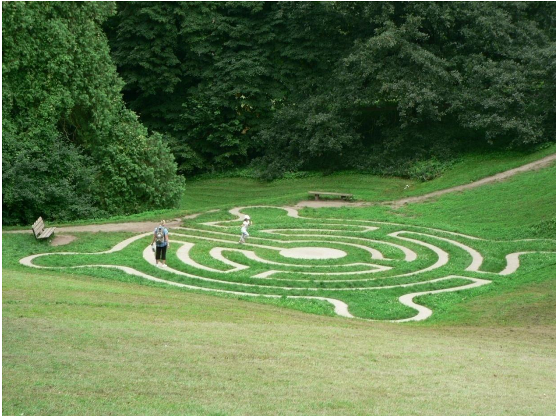
Zámek Loučeň - labyrintárium