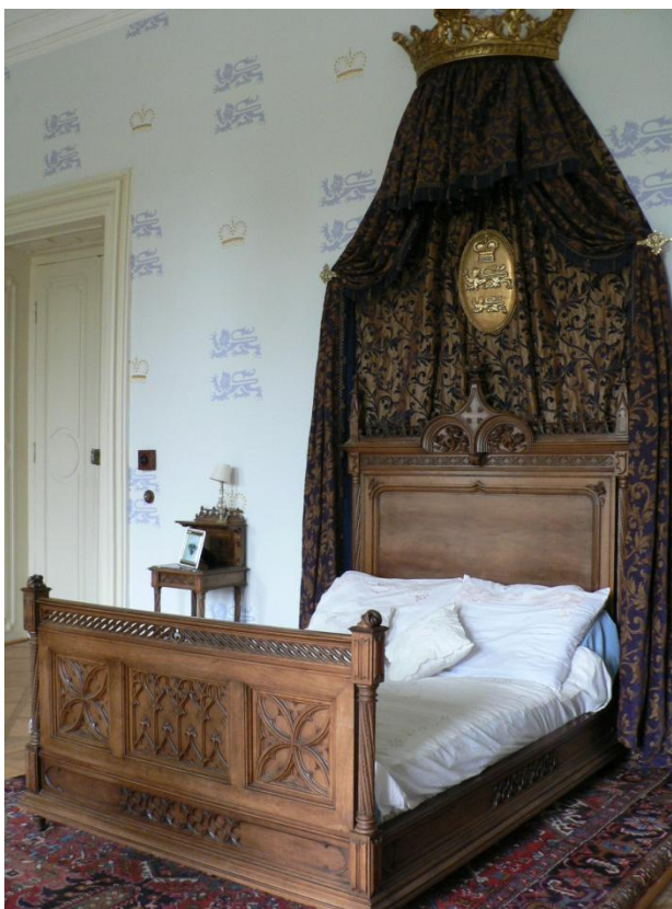
Zámek Loučeň - ložnice kněžny