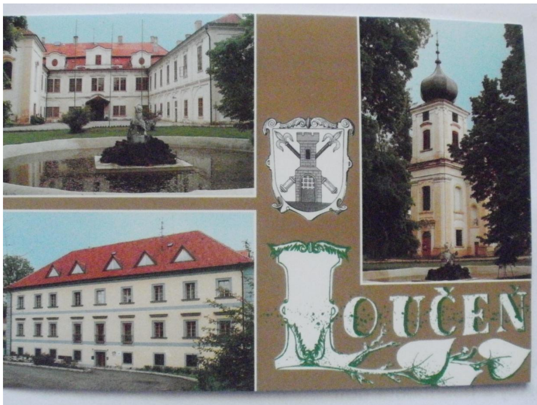
Zámek Loučň - Ústřední dopravní institut