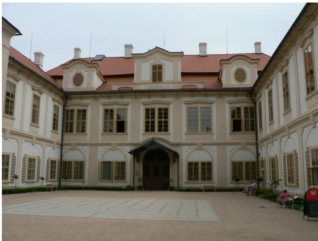
Zámek Loučeň - červenec 2012