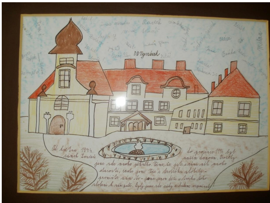
Zámek Loučeň - obrázek zámku