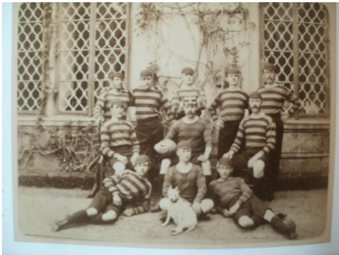
První fotbalové mužstvo z knihy Loučeň Patřín Studečky Studce