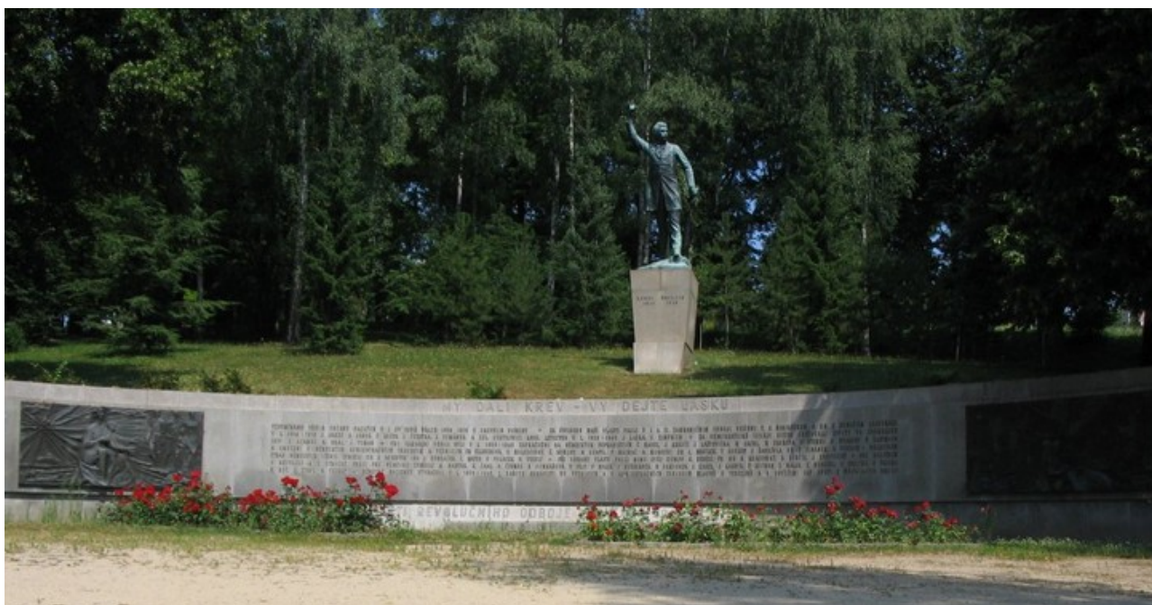
Příloha č.11: Památník obětem světových válek v Havlíčkově Brodě v parku Budoucnost.