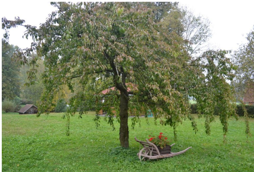
Příloha č. 1 : Zahrada ekofarmy.