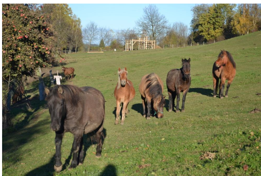
Příloha č. 4 : Zvířata na ekofarmě.