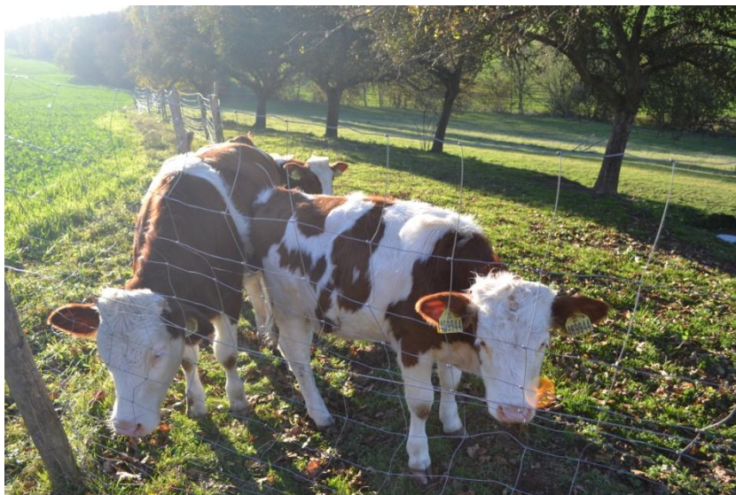
Příloha č. 2 : Zvířata na ekofarmě.