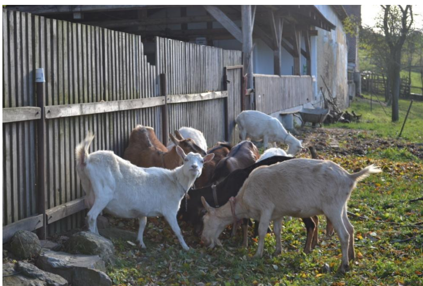
Příloha č. 3 : Zvířata na ekofarmě.