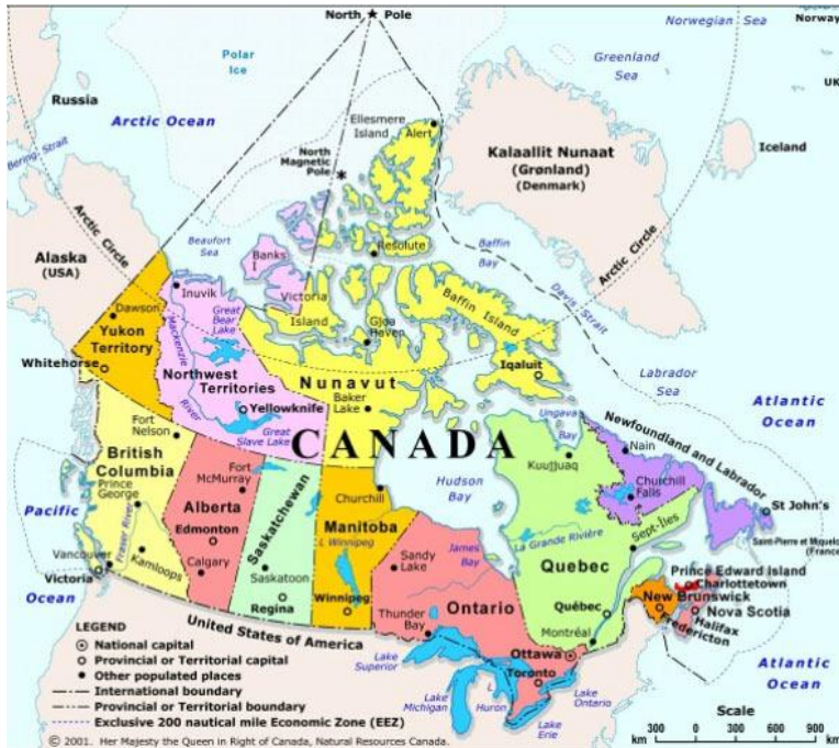
Příloha 1. – Mapa Kanady s barevně odlišenými provinciemi, zdroj: National Parks of Canada http://canada.xf.cz/ [přístup 23/05/2013]