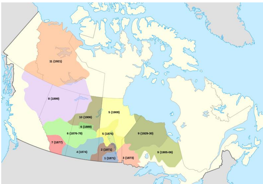
Příloha 3. – Mapa Číslovaných smluv