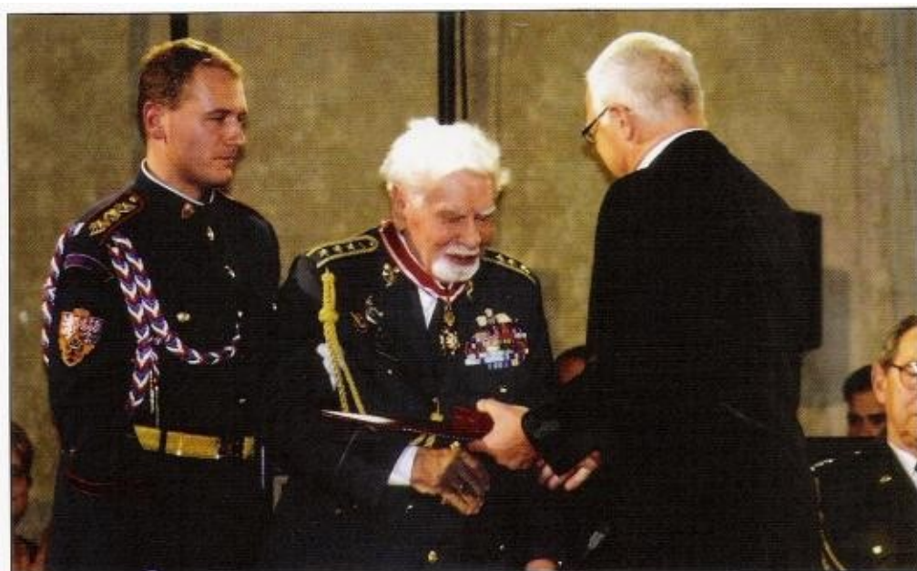
Nezapomenutelný okamžik a dozajista jeden z nejsilnějších momentů života Františka Fajtla – prezident republiky mu 28. 10. 2004 propůjčuje nejvyšší státní vojenské vyznamenání – Řád Bílého lva.