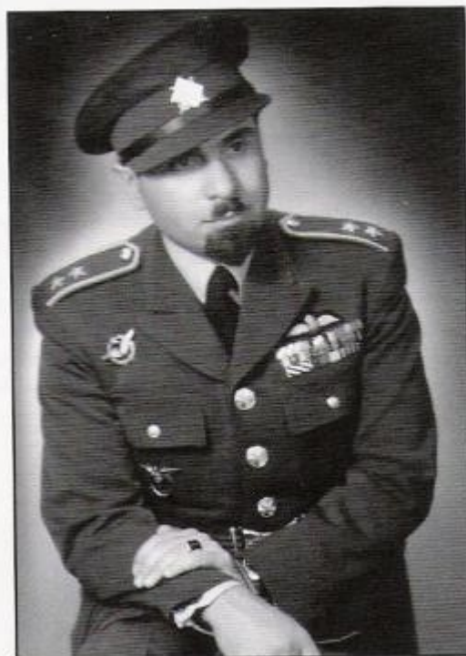
Jako major letectva v roce 1946.