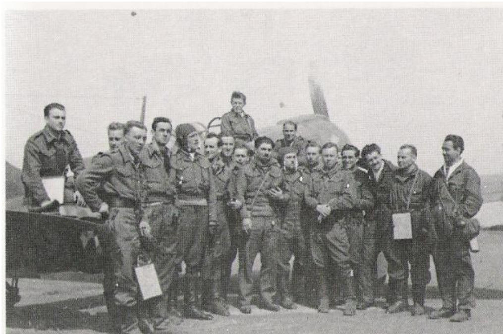
Operační stíhací piloti 1. pluku na letišti Poremba