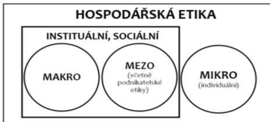
Obr. č.1 Typologie hospodářské etiky

Dnešní svět ekonomiky ovládají tři fenomény a sice globalizace, digitalizace a deregulace. Přidávám čtvrtý – zadluženost (spolu s tradičními maximalizace výkonu a konkurence), což vyžaduje maximální mobilitu, flexibilitu, specializaci a neustálé doplňování kvalifikace.