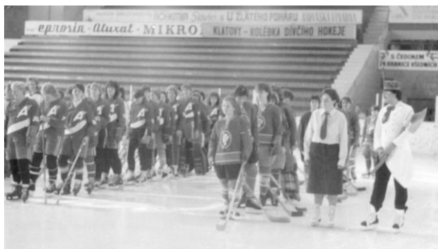
Obr. 6: Turnaj Masokombinát Klatovy