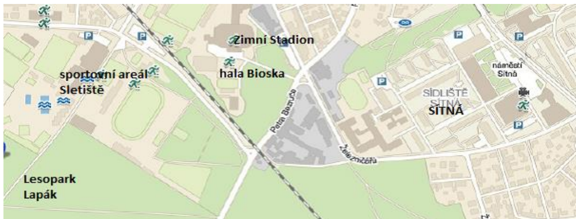
Obr. 8: měřítko: 1:12000, část města Kladna