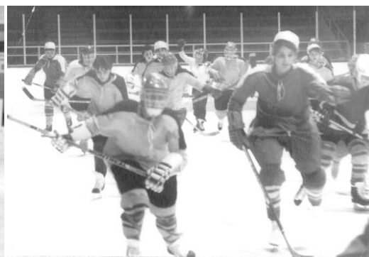
Obr. 7: Trénink 1986