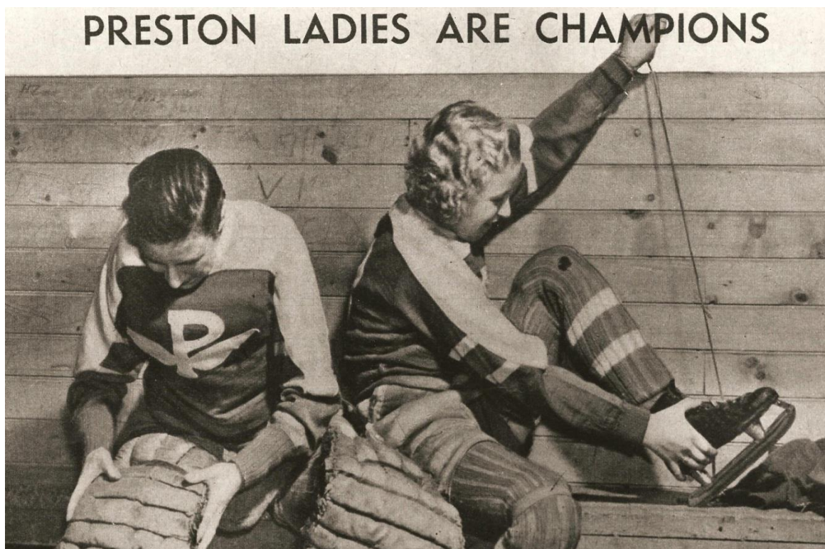
Obr. 4: Pohlednice Preston Rivulettes 1940

Nárůst počtu hráček a týmů je však zaznamenán až v druhé polovině let šedesátých a první polovině let sedmdesátých. V této době se začínají pořádat turnaje, které poskytují prostor jak k měření sil týmů, tak se stávají prostorem pro setkání klíčových osobností. 46 Jedním z významných turnajů je například Sweetheart Tournament v Severním Balllefordu v provincii Saskatchewan, kam se sjížděly týmy ze západních provincií, mimo jiné na tento turnaj přijížděl i slavný tým Chimos z Edmontnu. 47 V šedesátých letech se také obnovují univerzitní soutěže po celé Kanadě a více týmů vzniká i na středních školách. 48