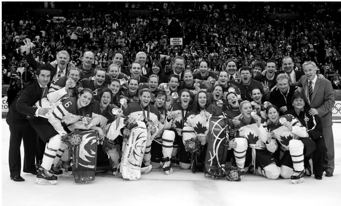
Obr. 5: Kanadský národní tým ZOH Vancouver 2010, zdroj: Hayley Wickenheiser [online]. [cit. 2013-06-20]. Dostupné z: http://www.hayleywickenheiser.com/page/about-hayley/photo-gallery#