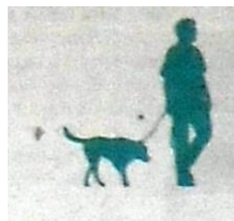
Lidové noviny 7. 3. 2001