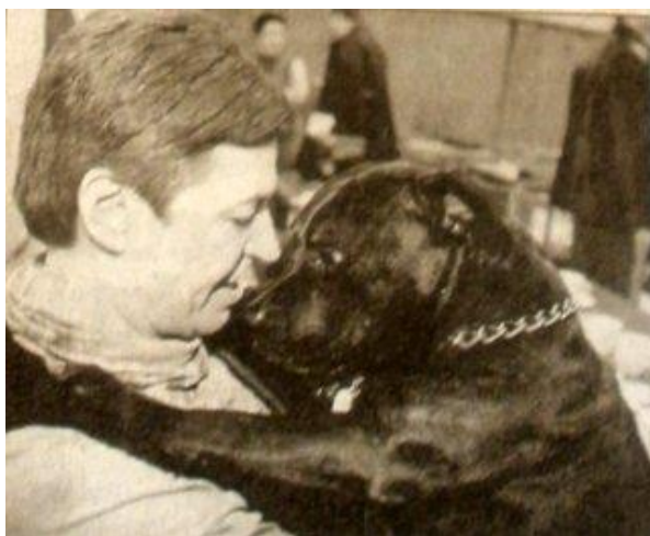
Blesk 10. 1. 2001