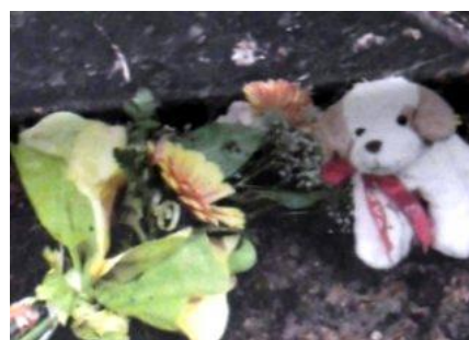
Blesk 22. 6. 2011