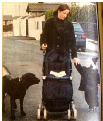
Blesk 20. 4. 2001