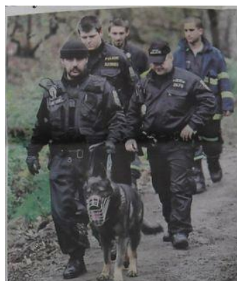
Lidové noviny 17. 3. 2011