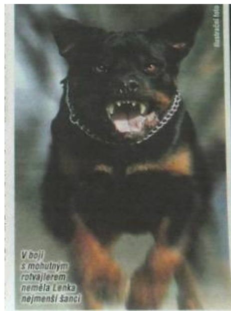
Blesk 19. 7. 2011