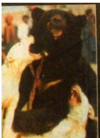
Blesk 8. 1. 2001