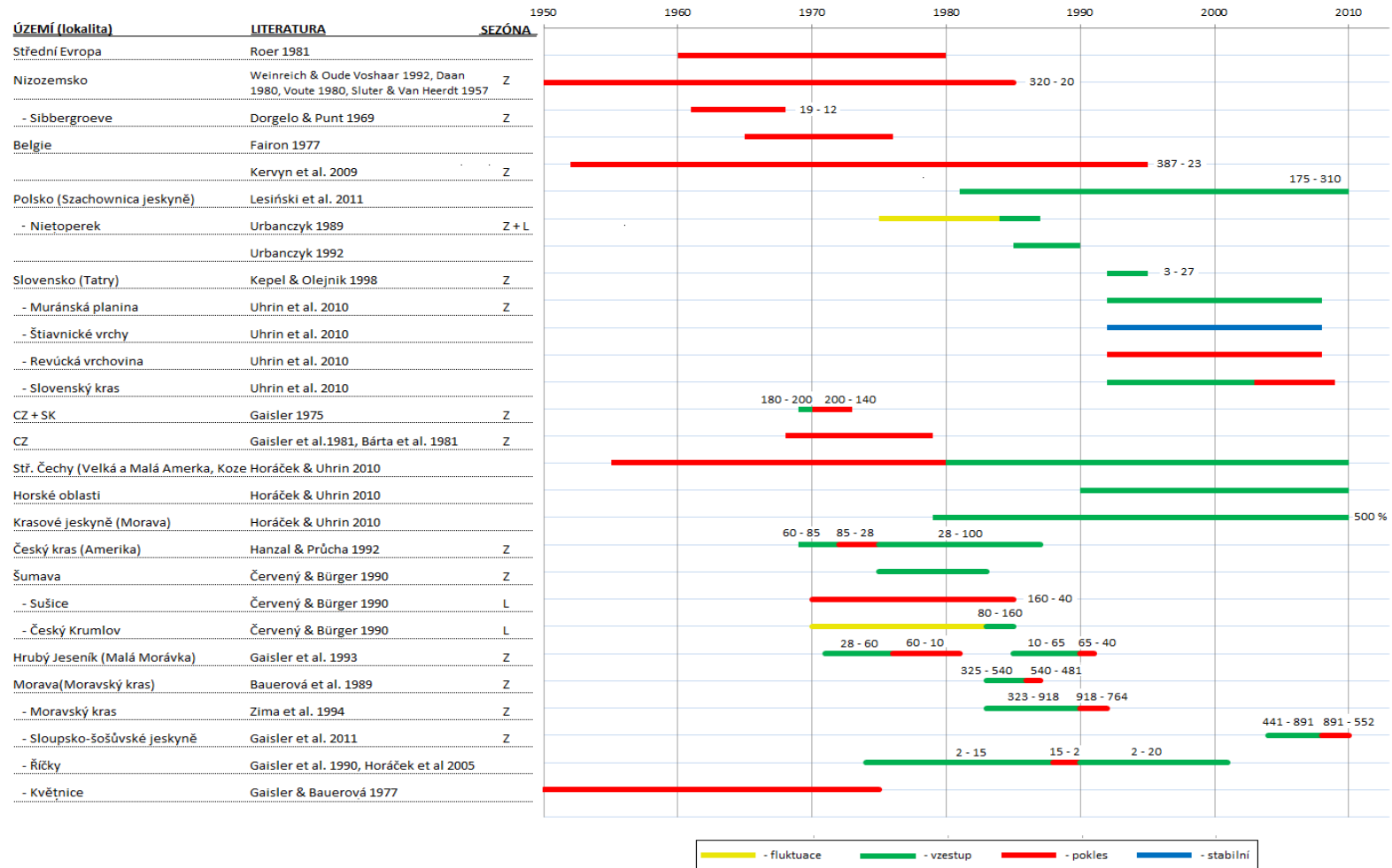
Obr. 2. Shrnutí údajů o početnosti druhu Myotis myotis na evropských lokalitách. Sezóna: období sčítání (L – letní kolonie, Z – zimoviště) Číselné rozpětí uvedené na konci některých časových úseků znázorňuje změny počtu jedinců na daných lokalitách, pokud byly uvedeny v použité literatuře.