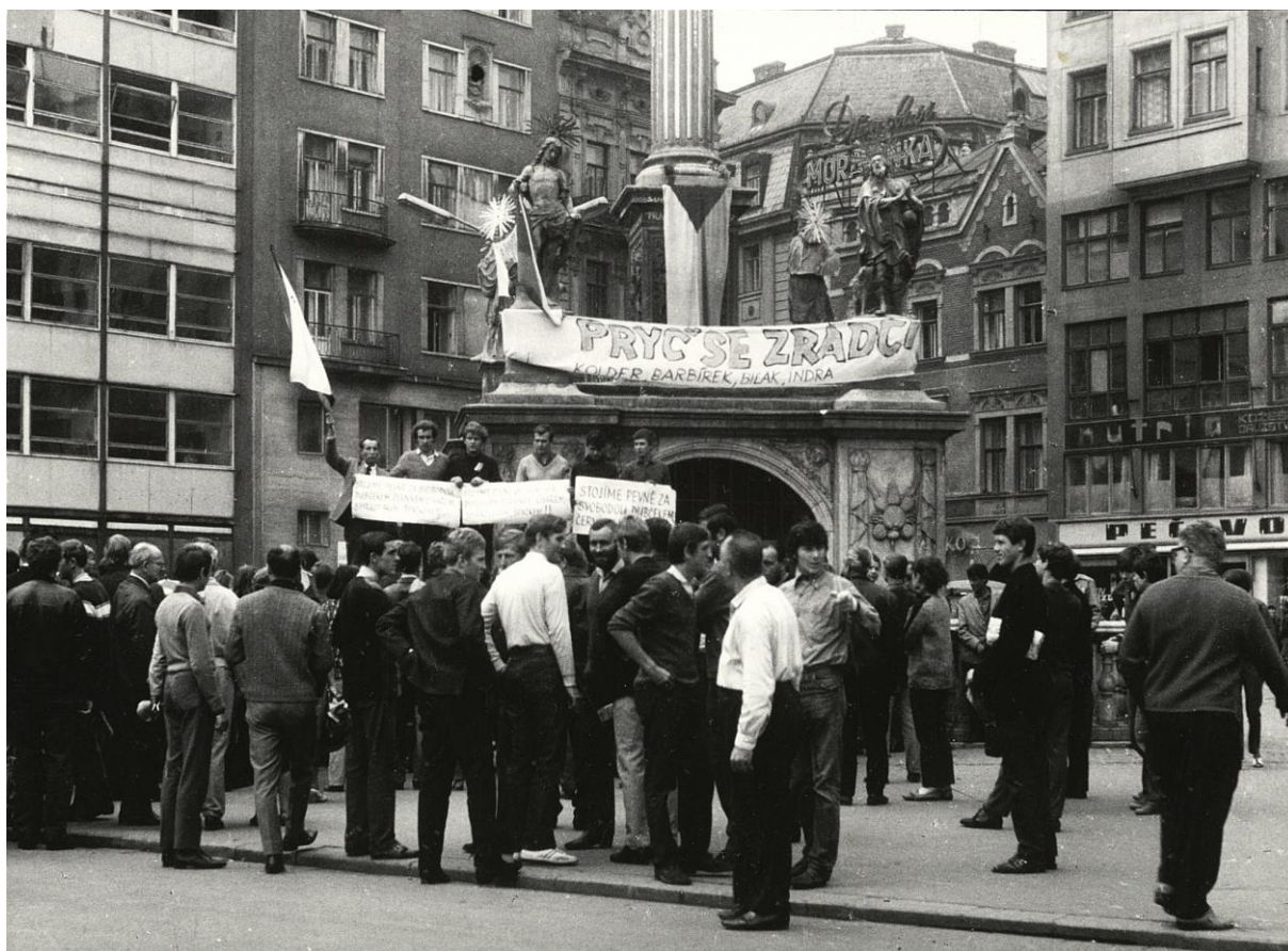
Shromáždění na náměstí Svobody.