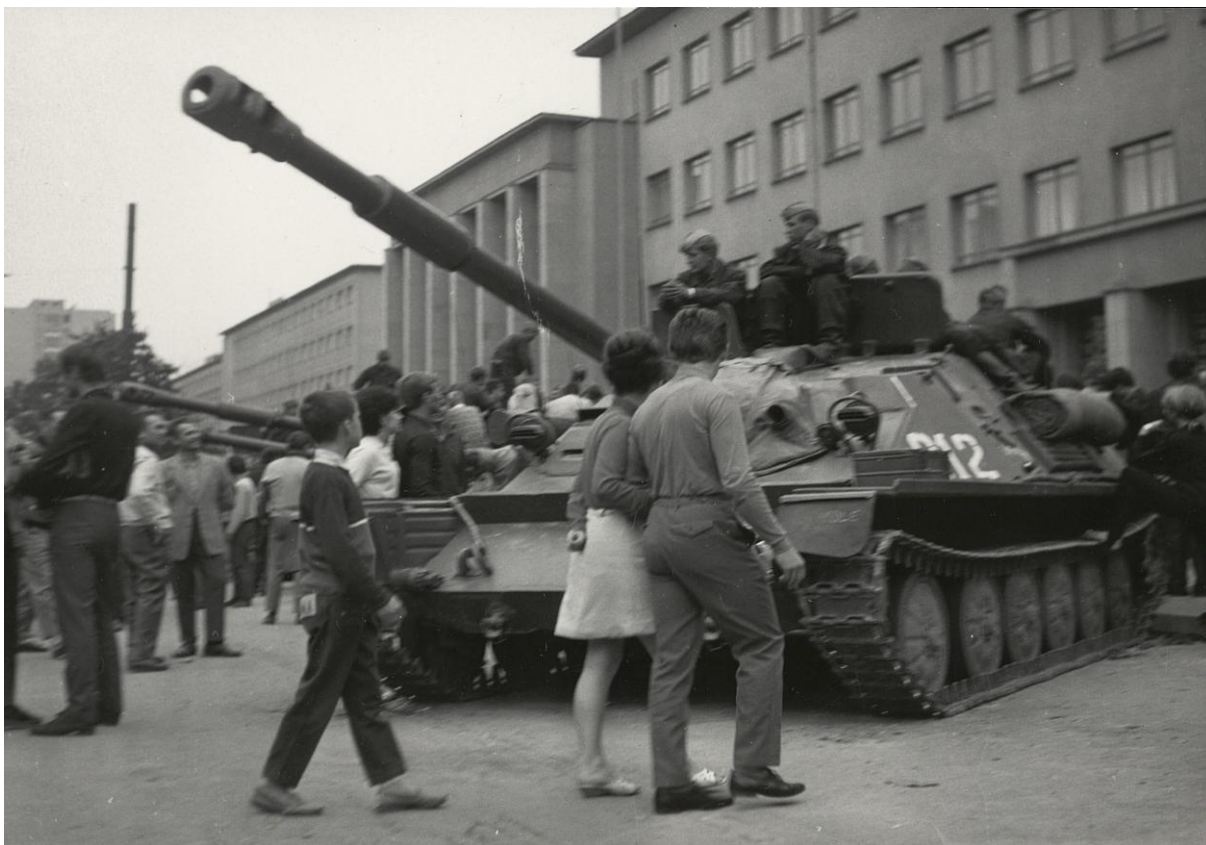
Tank před budovou tehdejší Vojenské akademie Antonína Zápotockého.