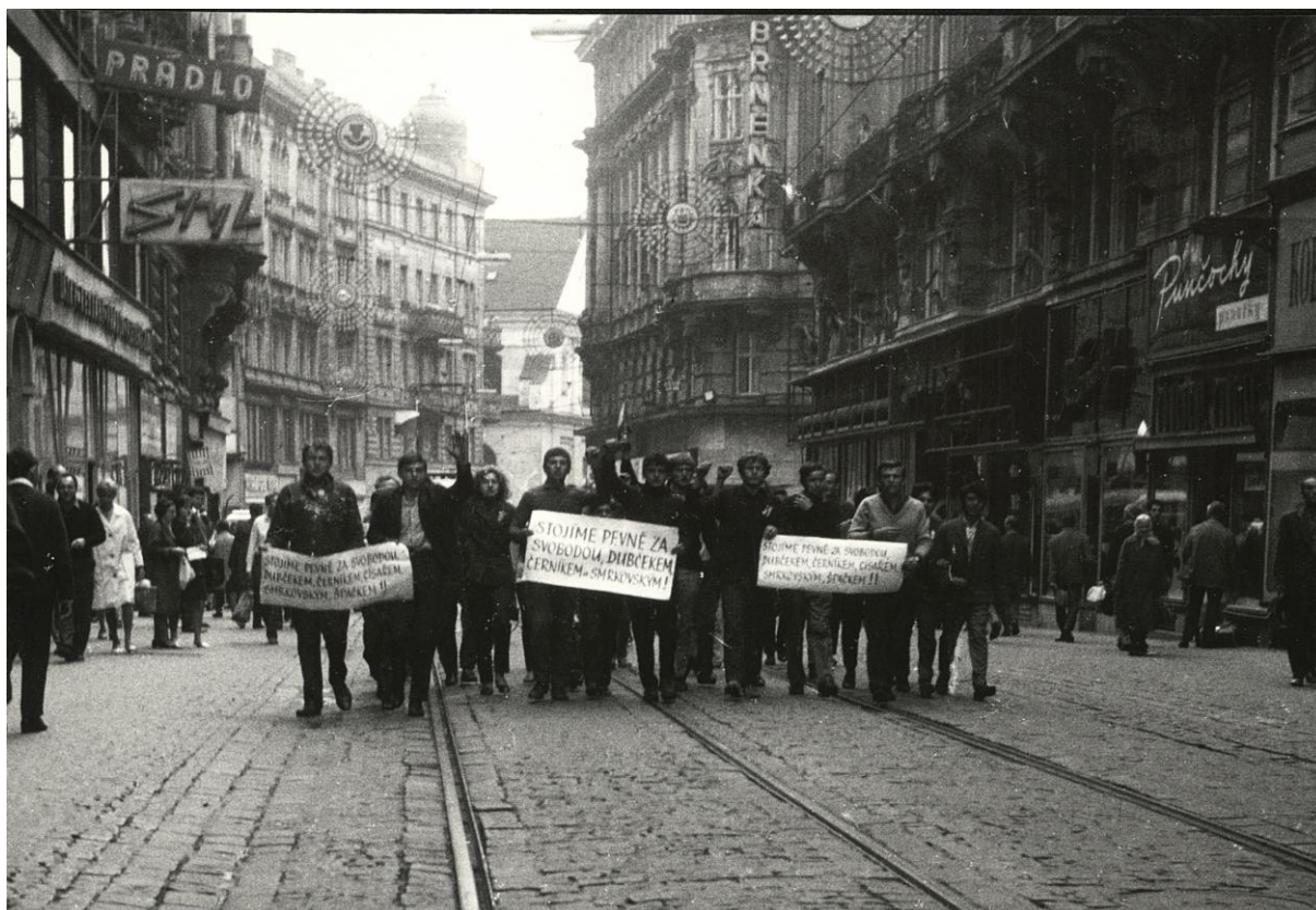
Průvod protestujících v dnešní Masarykově ulici.