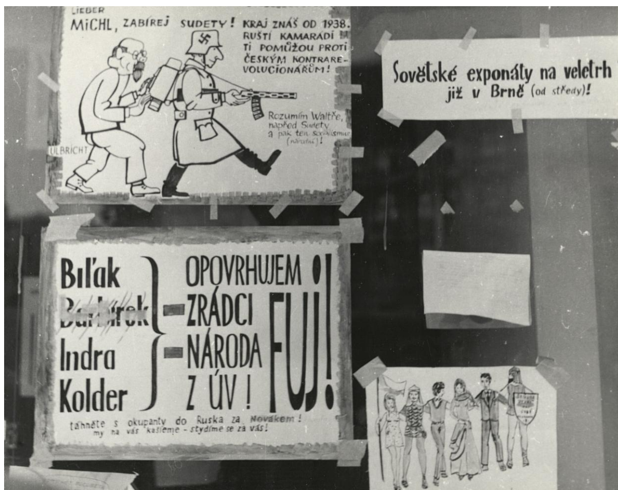
Ukázka antisovětských nápisů na jedné z brněnských výloh.