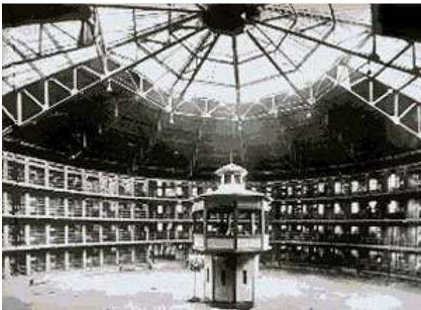
Obrázok 1 Panoptikon – dohliadajúca veža.

Pre predstavu priestorového riešenia disciplinujúcej spoločnosti Foucault použil práve Benthamov 54 Panoptikon, ktorý stelesňuje väzenie, uprostred ktorého je pozorovacia veža, kde môže, ale i nemusí byť umiestnený dozorca.