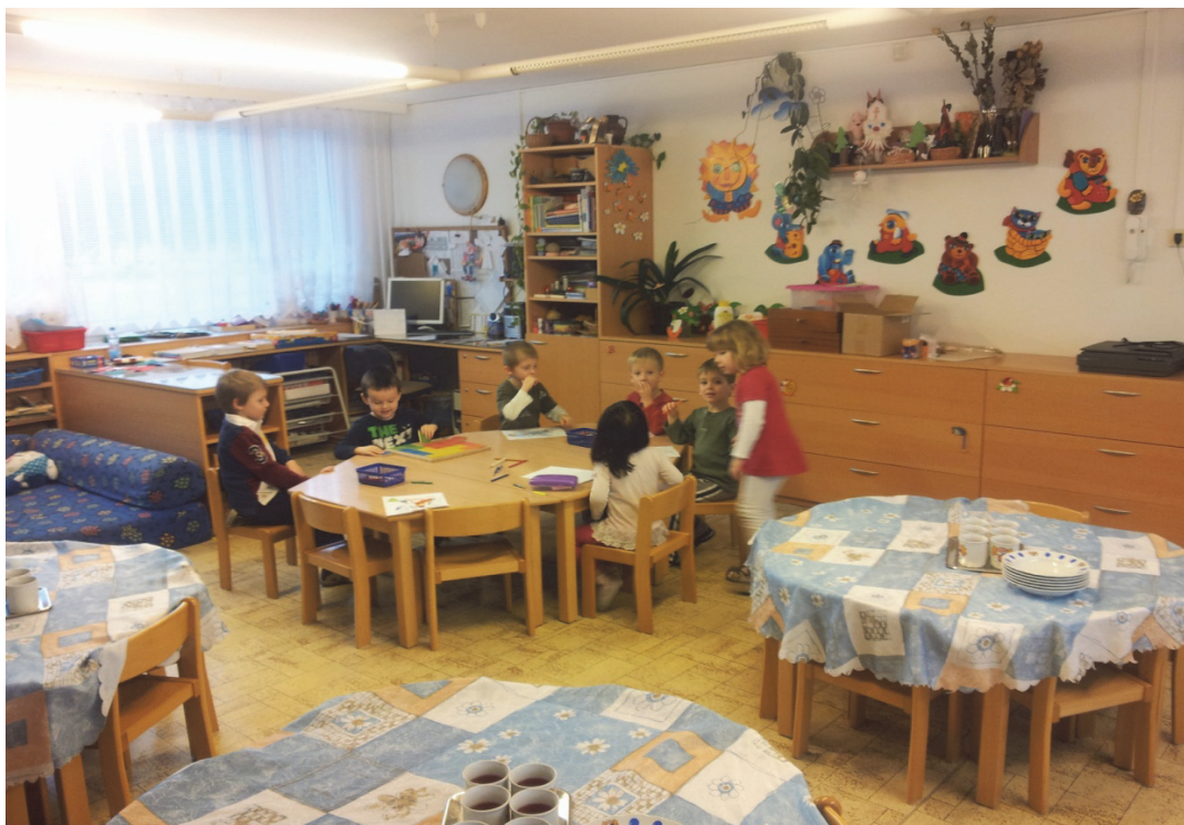
Příloha č.1, uspořádání stolů pro děti ve společenské místnosti ve školce v ČR