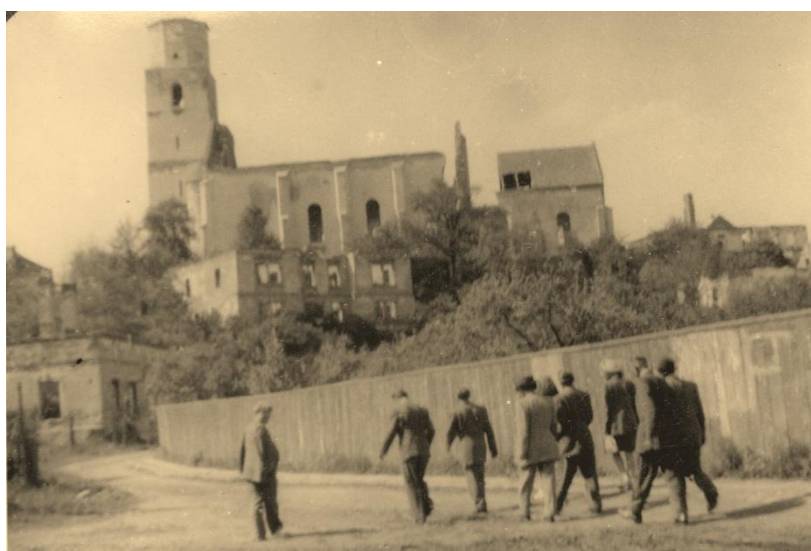
Obr. 1 - Zájezd do Osoblahy po válce