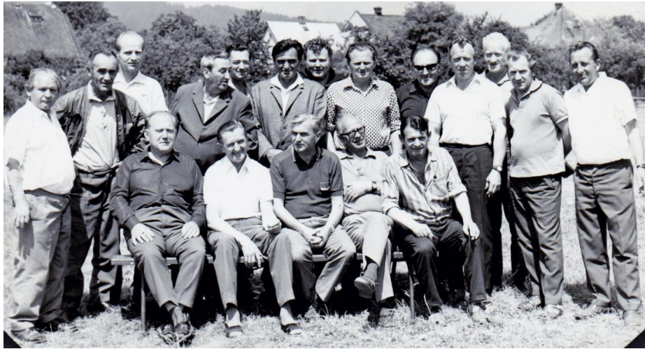
Obr. 4 – schůzka při otevření kabin