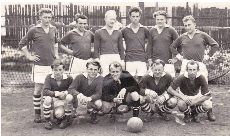
Obr. 3 - mužstvo v okresní soutěži