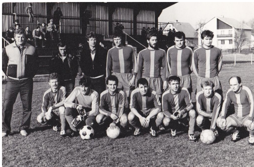
Obr. 7 – mužstvo A – 1986