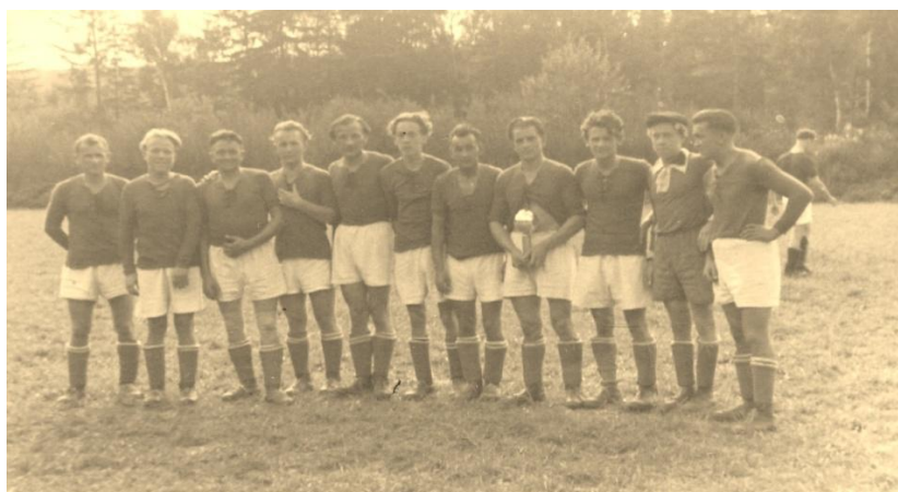
Obr. 2 - mužstvo 1947