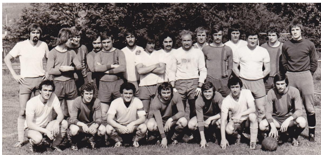
Obr. 9 – TJ Dakon 1981