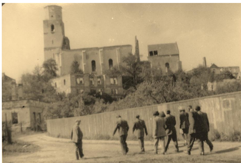
Obr. 1 - Zájezd do Osoblahy po válce