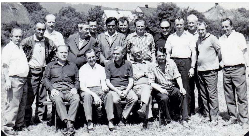
Obr. 4 – schůzka při otevření kabin