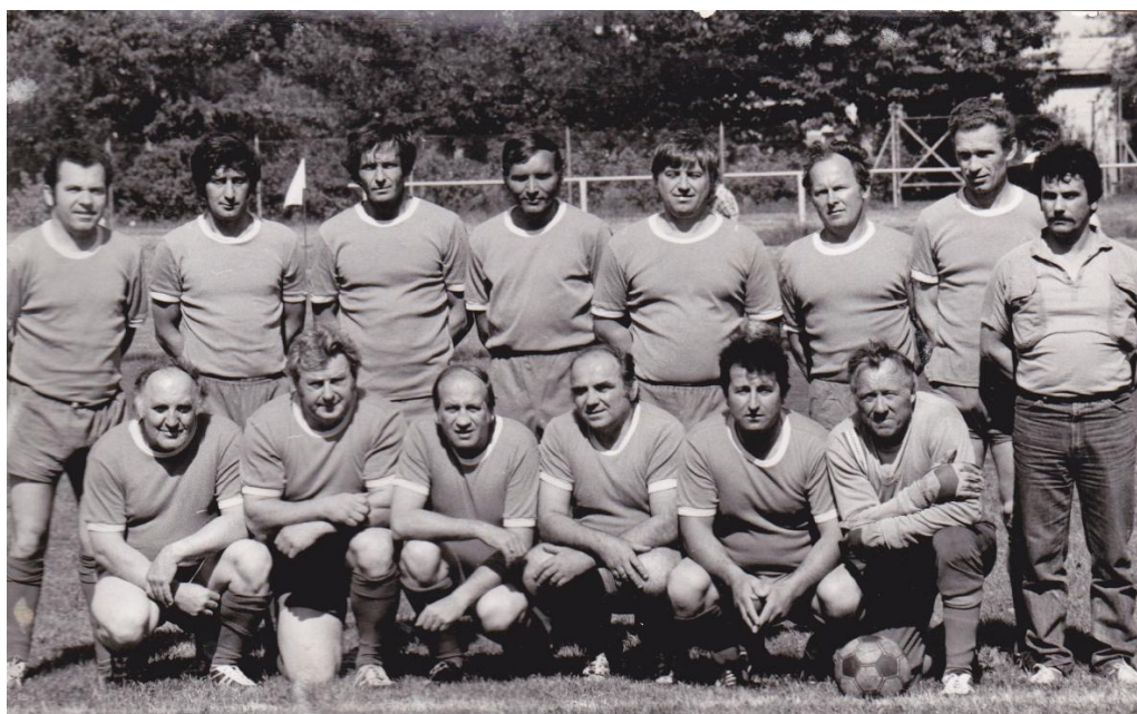
Obr. 10 – Stará garda FK AVÍZO