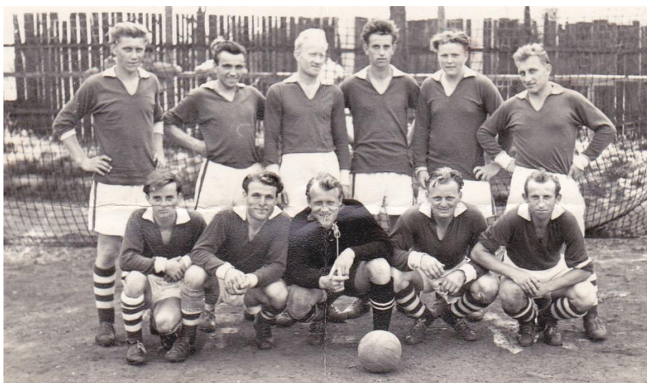
Obr. 3 - mužstvo v okresní soutěži