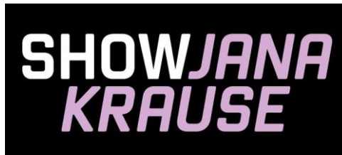
Obrázek 1, logo pořadu

13 Z hlediska mediální prezentace je marketing Show Jana Krause daleko propracovanější, než u svého předchůdce Uvolněte se, prosím . Jak už bylo zmíněno v úvodu této kapitoly, celkovému posunu vpřed napomáhá již samotná změna názvu, ve kterém je obsaženo jméno moderátora a posouvá tak značku Jan Kraus daleko více do povědomí diváků. S tím souvisí i grafické logo pořadu,