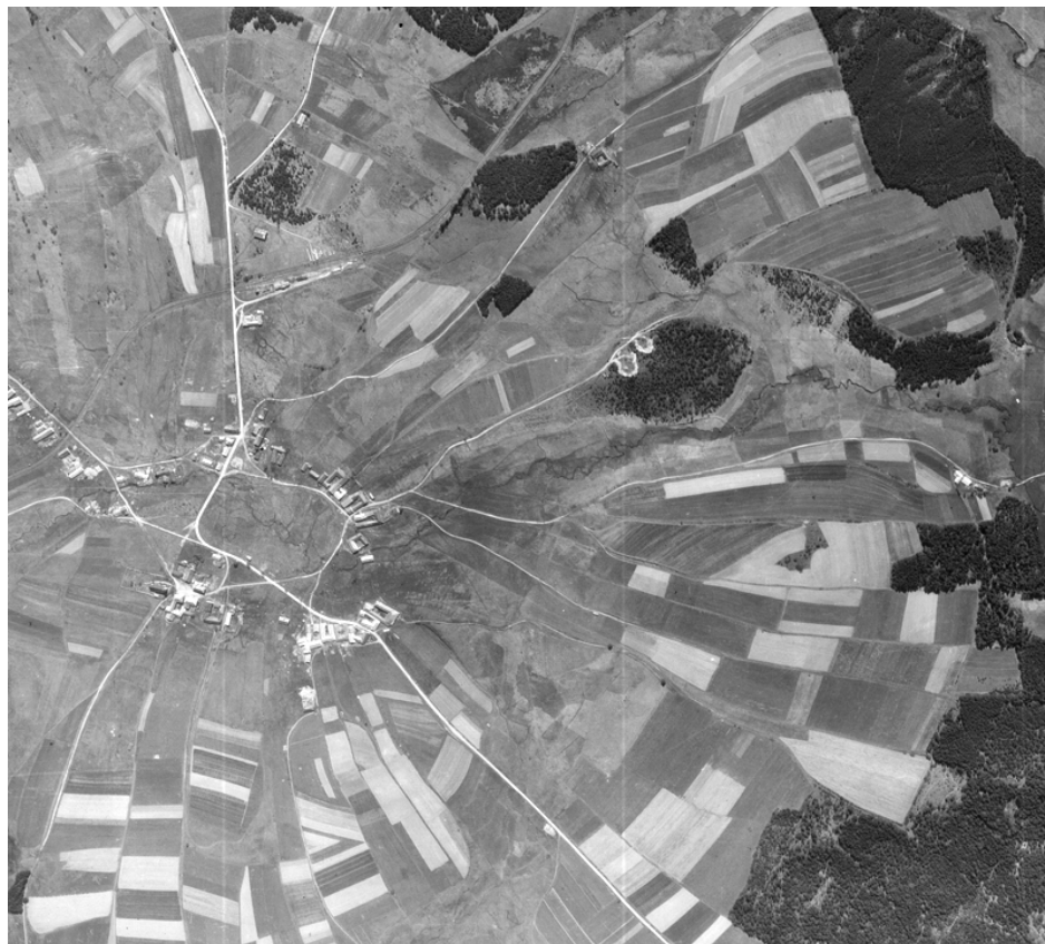
Příloha č. 6: Ukázka zdrojových dat- ortofoto z roku 2005