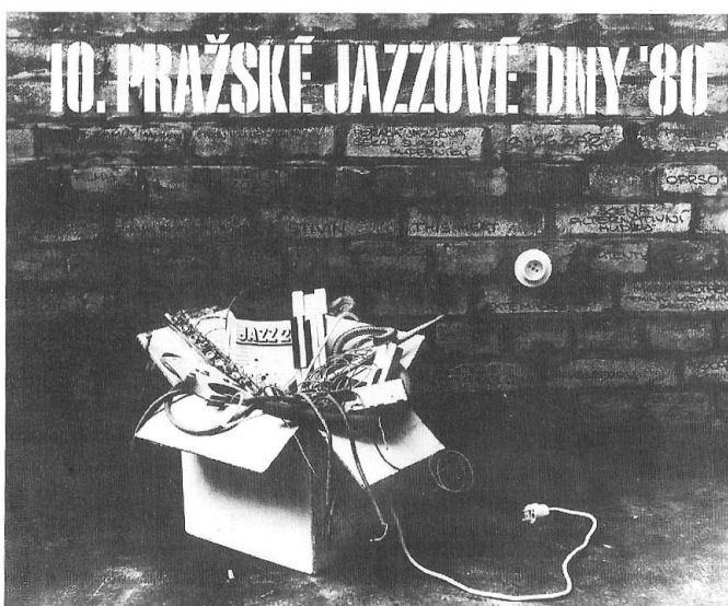
Obrázek 2. Škatule vytažená ze zásuvky, na plakátu 10. Pražských jazzových dnů. Epitaf Jazzové sekce?

za kvalitu její kulturní činnosti 89 , režim se rovněž chystal tvrdě zakročit proti celému okruhu rockové muziky 90 ). Svaz hudebníků nevěděl, jak má situaci řešit, a další 3 roky se potácel se Sekcí v diskuzích o způsobu organizace a vzájemného vymezení práv. 91 V průběhu této doby se Sekce, vzhledem k zákazu koncertní činnosti, orientuje stále více na vydavatelskou a