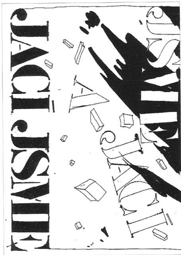
Obrázek 5. Titulní strana brožury „Jací jsme?“.

doklad bezradnosti státních autorit sjevem, který se jim naprosto vymkl z rukou, je to naprosto výjimečné. 186