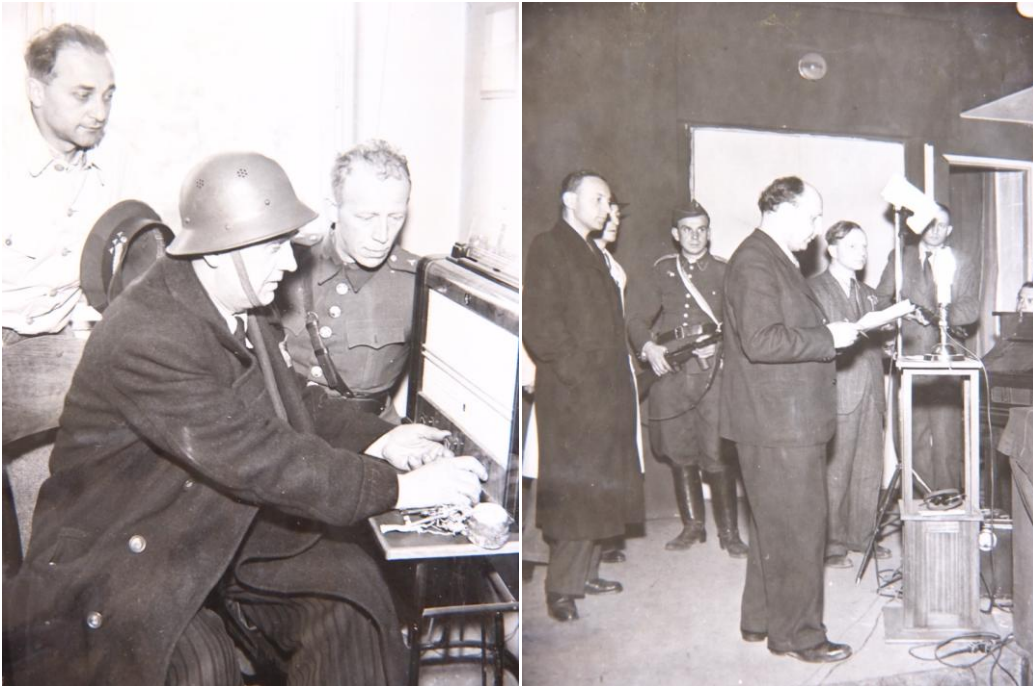
Hlasatelna v Husově sboru na Vinohradech a budova Českého rozhlasu na Vinohradech po skončení Pražského povstání.