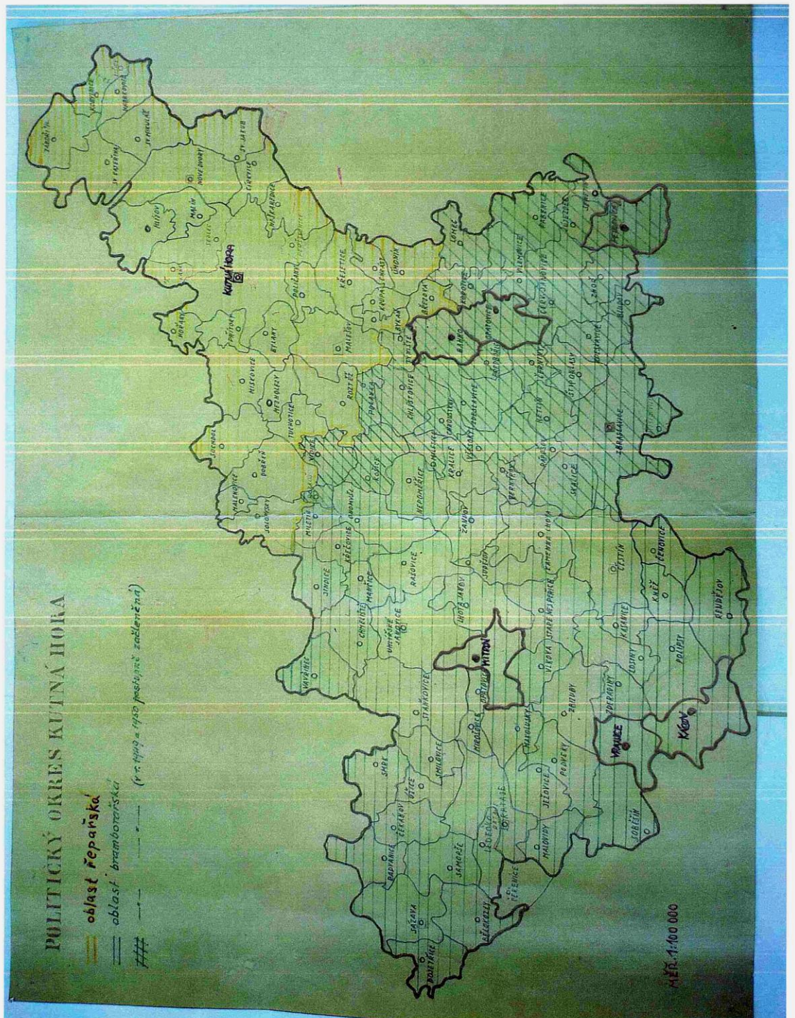
Příloha II – Mapa zemědělských výrobních oblastí okresu Kutná Hora.