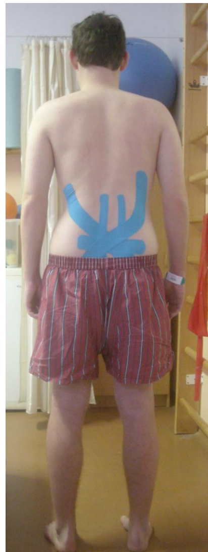
Příloha č. 6: Stoj pacienta zezadu – výstupní fotografie