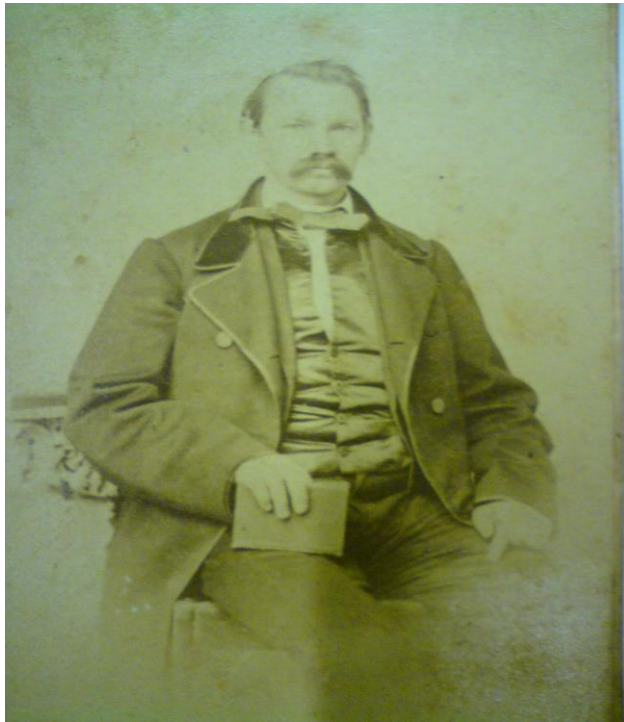
5) Fotografie Josefa Věnceslava Soukupa od A. Žáka z roku 1866.