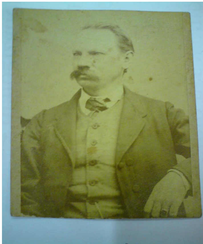
6) Fotografie od Adolfa Müllera z roku 1869.