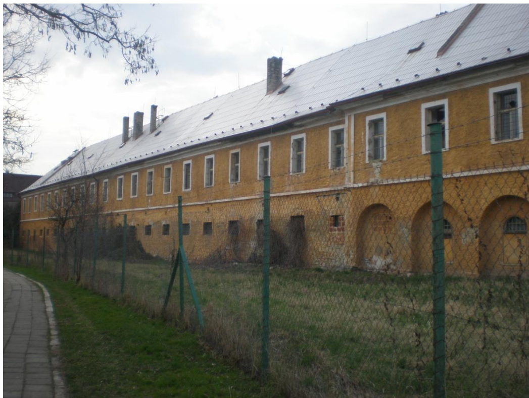
Obrázek 1: kasárna v Postoloprtech 147