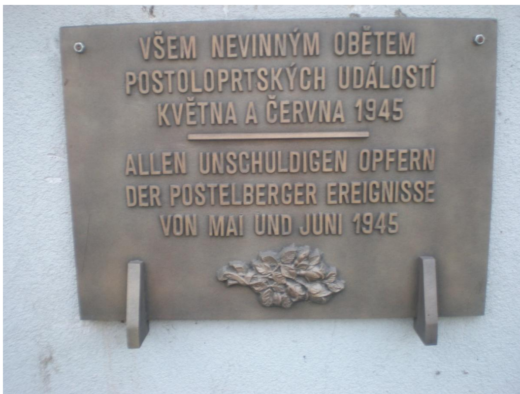
Obrázek 3: Pamětní deska 149