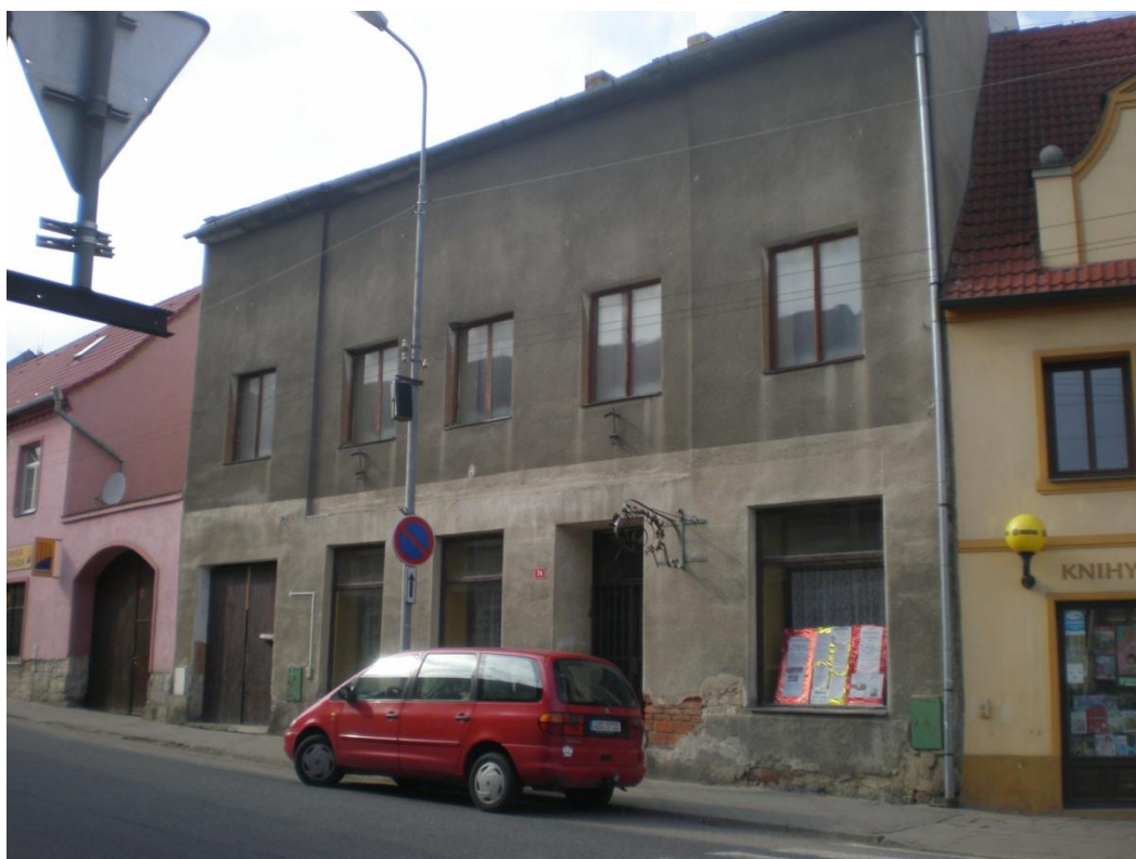
Obrázek 2: Sídlo OBZ, dům č.74 148