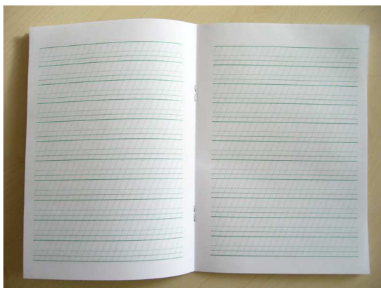
Obr. č. 3 - pomocné linky v sešitě