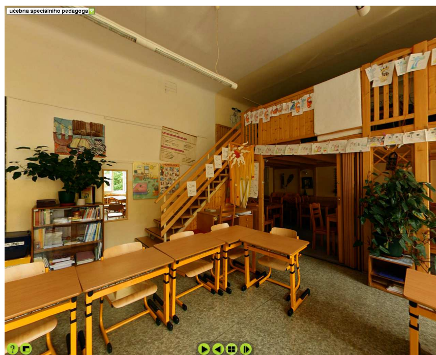
Obr. č. 2 – učebna speciálního pedagoga – patro s počítači

Virtuální prohlídka celé školy FZŠ Tábořská je k dispozici na internetových stránkách - http://www.zstaborska.cz/stranky-zvlast/virtual/popup_taborska.html .