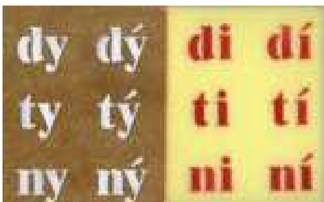
Obr. č. 5 – deska na procvičování měkkých a tvrdých slabik