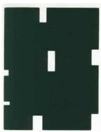
Obr. č. 4 – čtecí (dyslektické) okénko