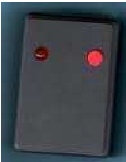
Obr. č. 7 – bzučák na procvičování délek