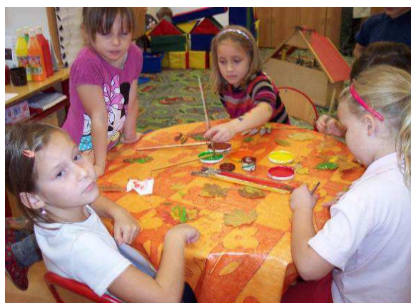
Obr. č. 29: Obtisk listů (2012)