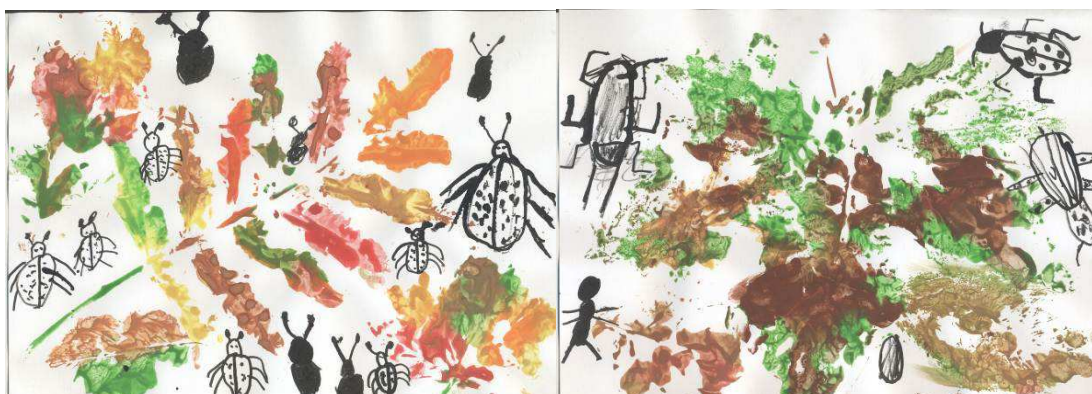
Obr. č. 34: Kam se schovávají brouci (2012)