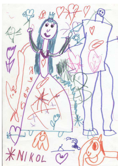
Obr. č. 10: Skupinová kresba (2012)