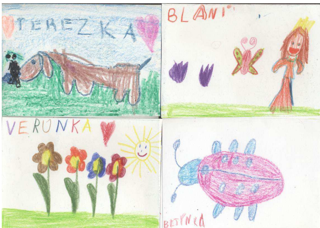
Obr. č. 3: Ukázky vizitek (2012)