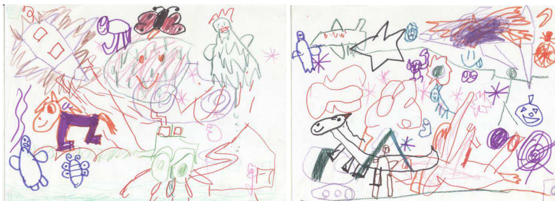
Obr. č. 8: Skupinová kresba (2012)