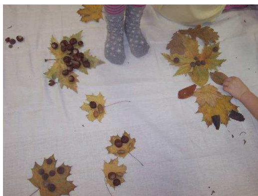
Obr. č. 44: Ztvárněný skřítek Podzimníček (2012)