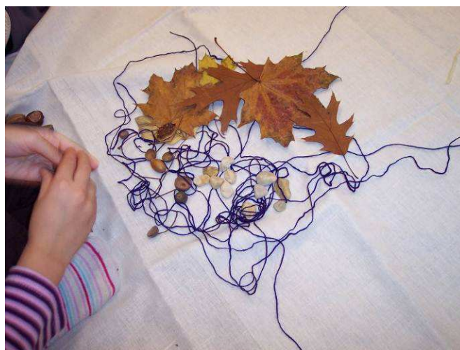
Obr. č. 28: Pavučina – vzkaz Měsíci (2012), foto archiv autorky