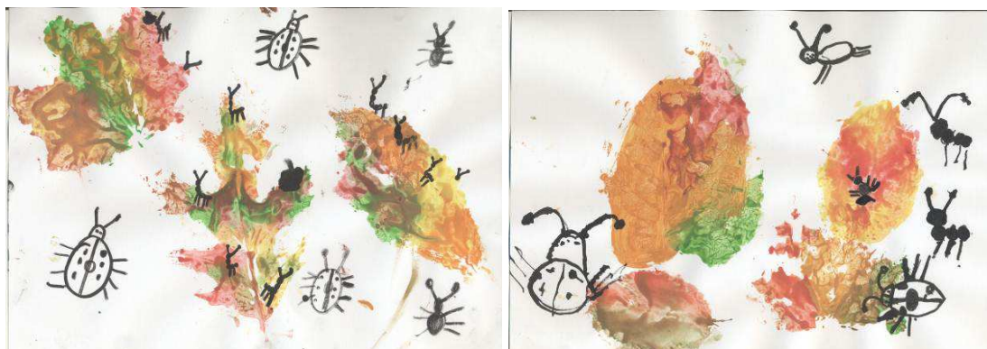
Obr. č. 30: Kam se schovávají brouci (2012)