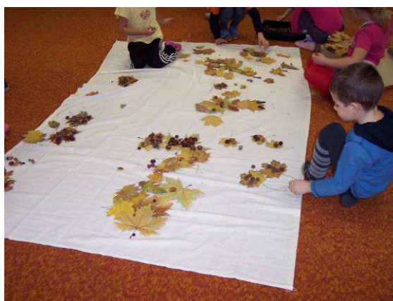
Obr. č. 40 a č. 41: Průběh tvorby z přírodnin 2012, foto archiv autorky