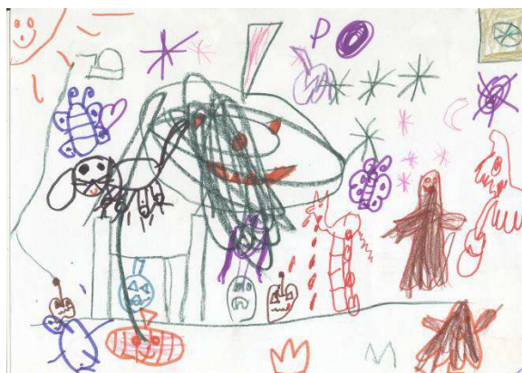
Obr. č. 13: Skupinová kresba (2012)