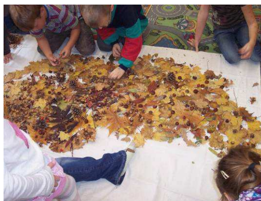
Obr. č. 18 a č. 19: Tvoření obrazu (2012), foto archiv autorky.