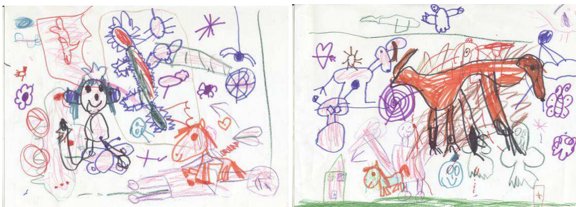
Obr. č. 4 : Skupinová kresba (2012)