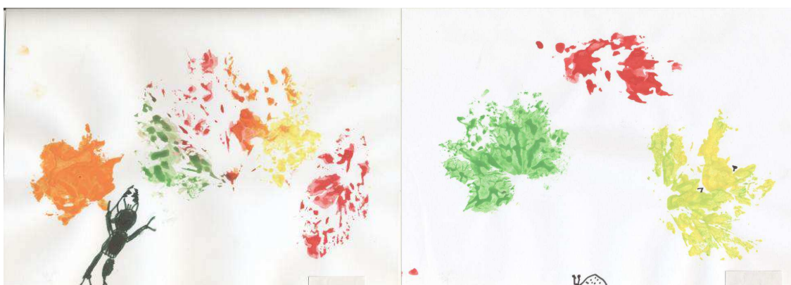
Obr. č. 47: Kam se schovávají brouci (2012)