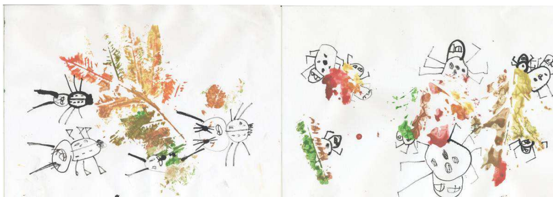
Obr. č. 36: Kam se schovávají brouci (2012)