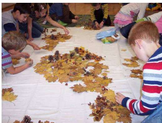
Obr. č. 17: Začátek tvorby obrazu (2012)