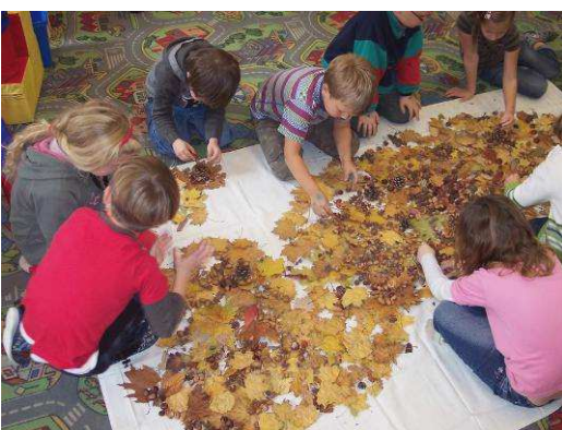
Obr. č. 20 a č. 21: Dokončovací práce na obrazu (2012), foto archiv autorky