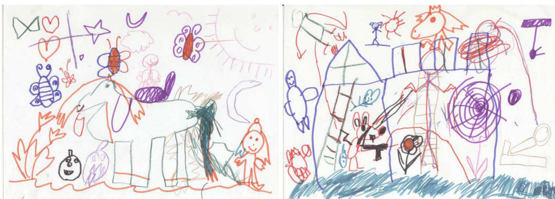
Obr. č. 6 : Skupinová kresba (2012)