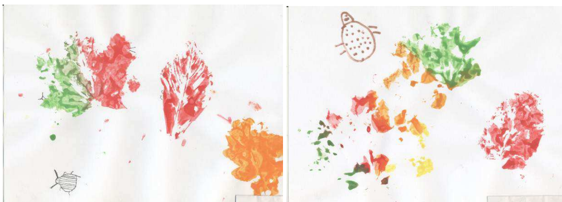
Obr. č. 45: Kam se schovávají brouci (2012), foto archiv autorky