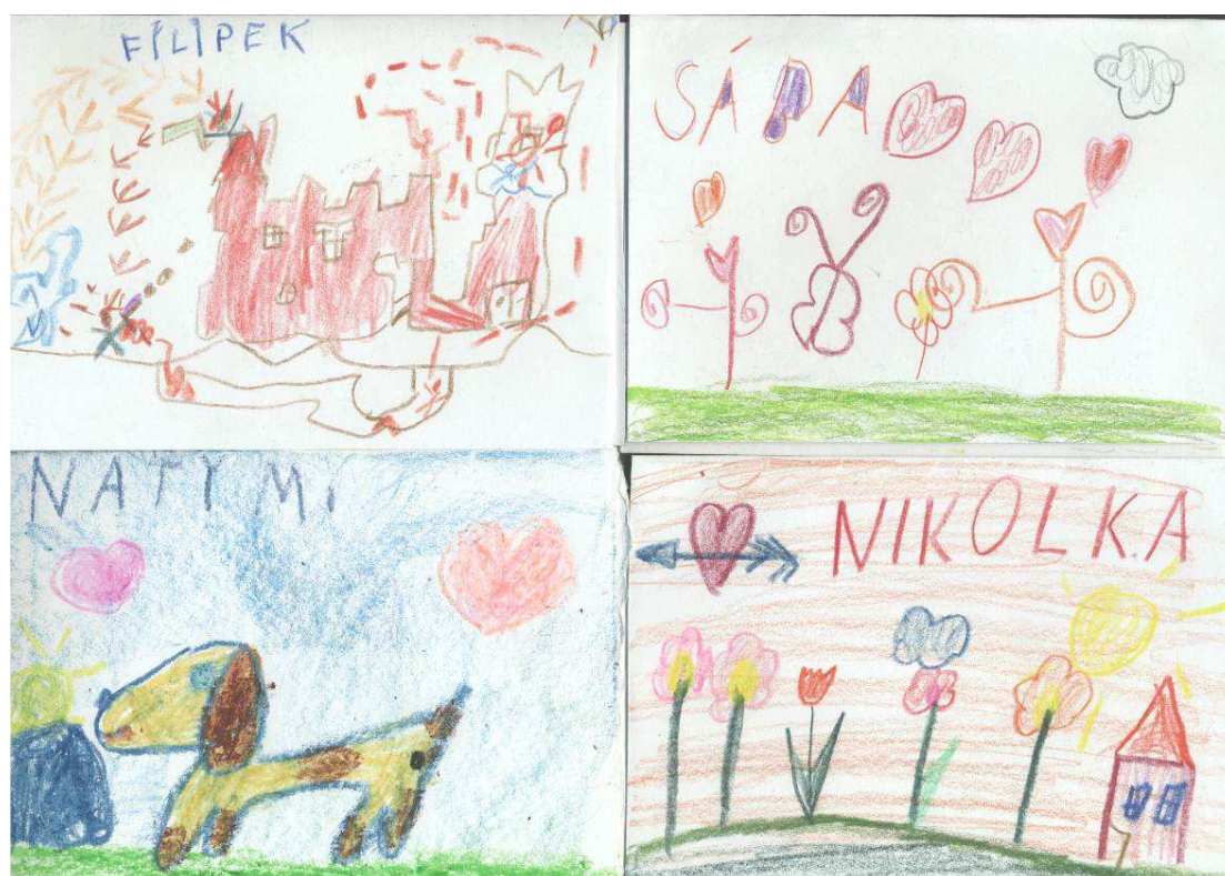
Obr. č. 2: Ukázky vizitek (2012)