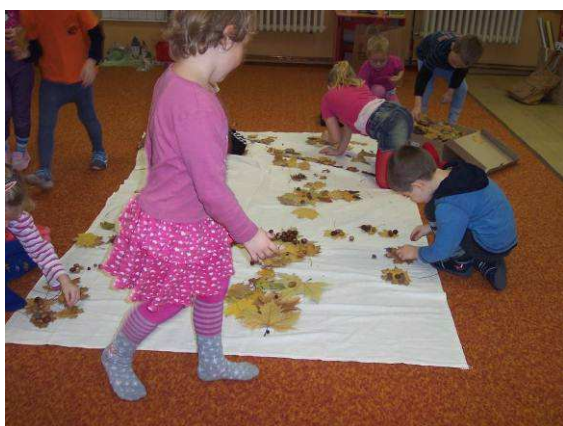
Obr. č. 39: Průběh tvorby obrazu pro potěšení Měsíce (2012)