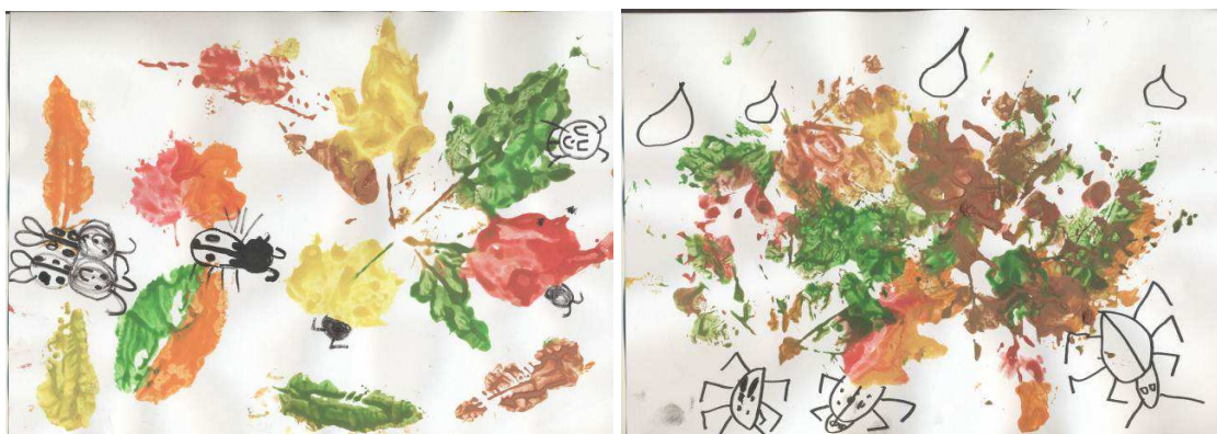
Obr. č. 32: Kam se schovávají brouci (2012)