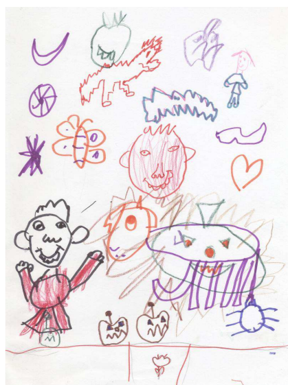
Obr. č. 14: Skupinová kresba (2012)