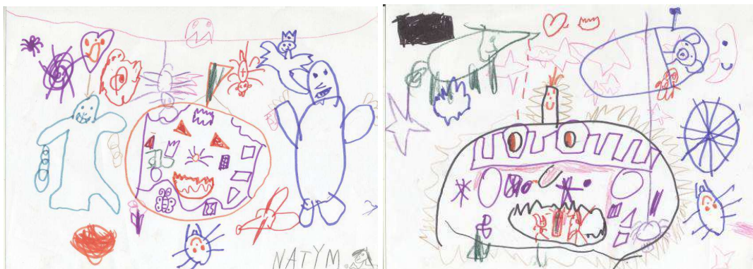
Obr. č. 11: Skupinová kresba (2012)