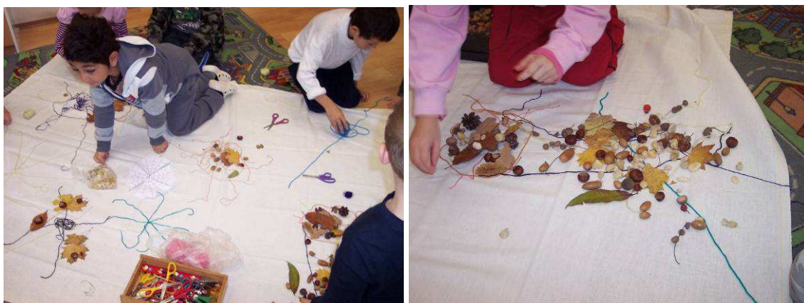
Obr. č. 24 (vlevo): Tvoření pavučin (2012)