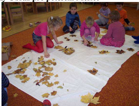
Obr. č. 38: Průběh tvorby obrazu pro potěšení Měsíce (2012)