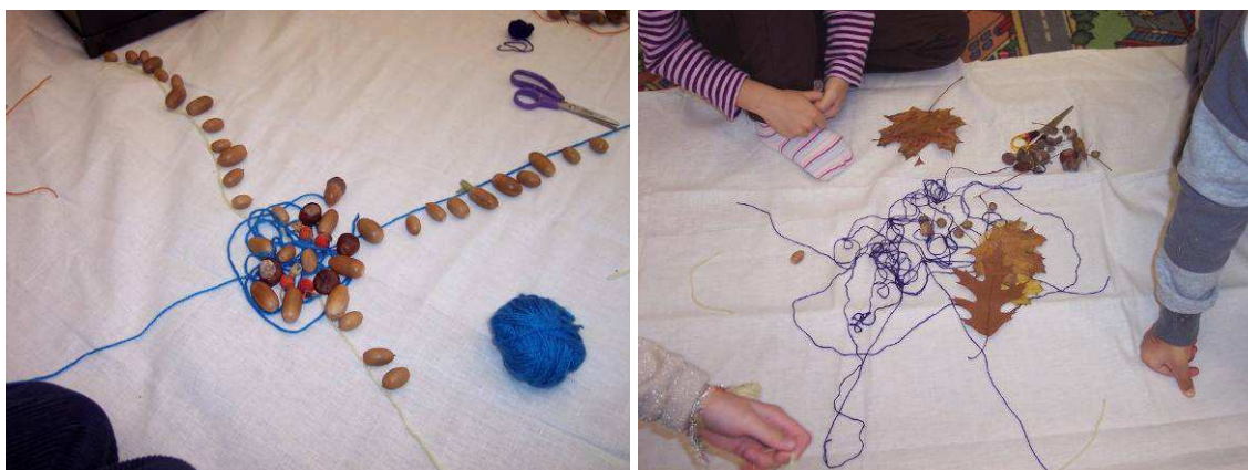
Obr. č. 26 (vlevo): Pavučina – kapky rosy (2012)