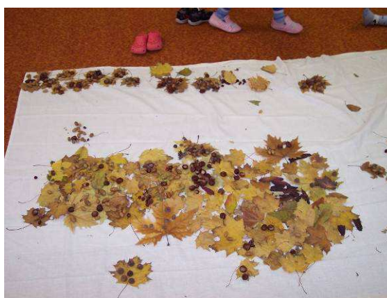
Obr. č. 42 (vlevo): Obraz v průběhu tvorby (2012), foto archiv autorky