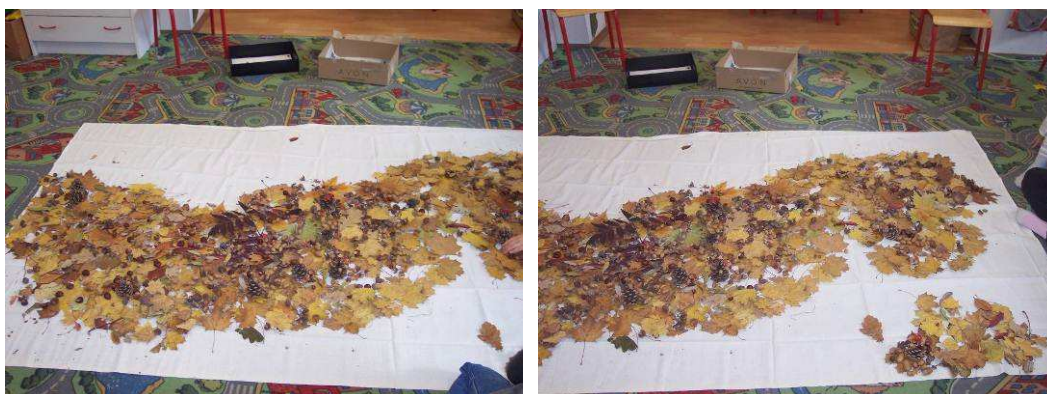
Obr. č. 22 a č. 23: Výsledný obraz z přírodnin pro potěšení Měsíce (2012)