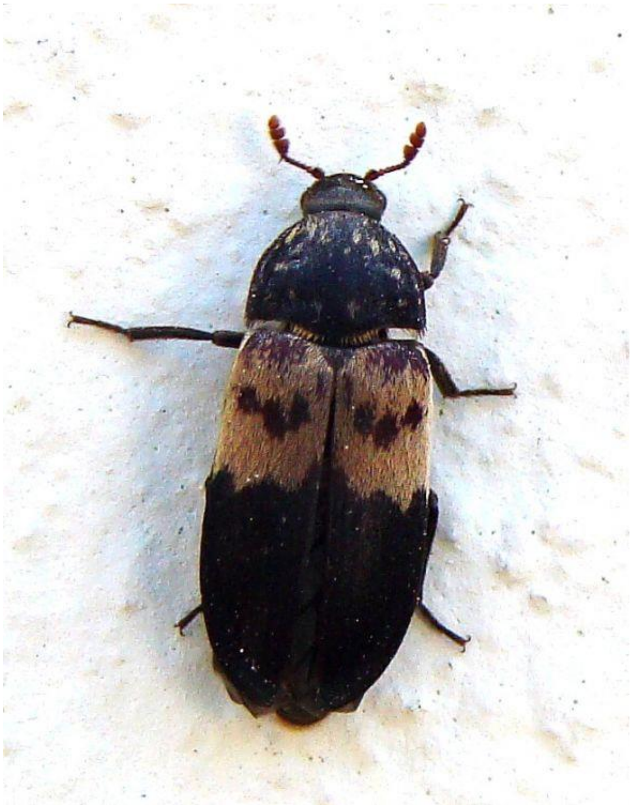
Príloha A.4: Kožiar, kožojed česky ( Dermestes lardarius )