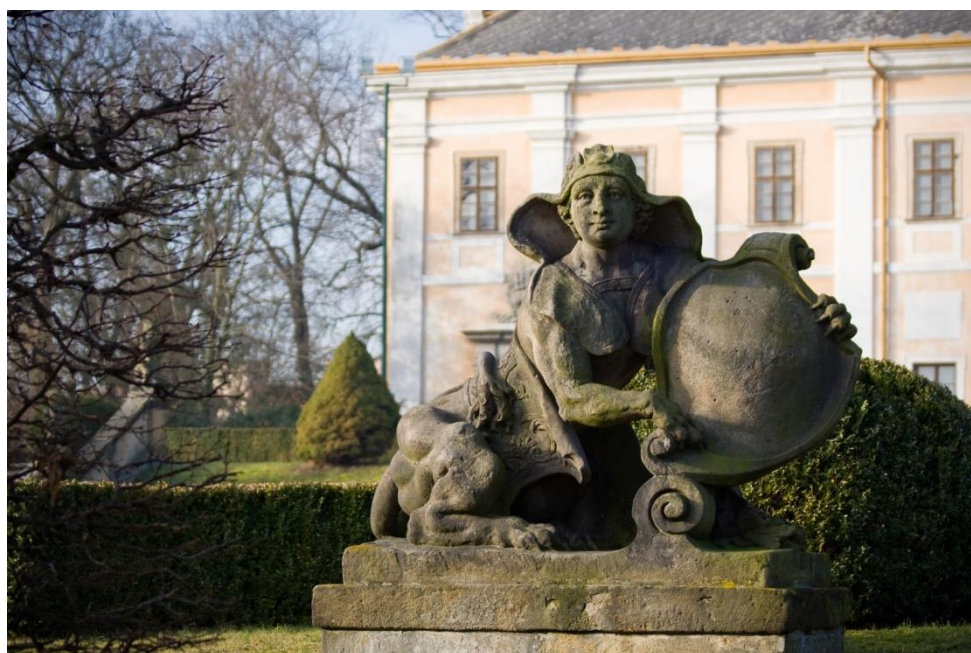
Obr. XII - Socha sfingy s kartuší.