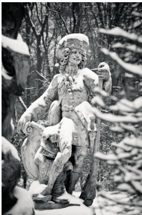
Obr. IV- Alegorická socha Března.