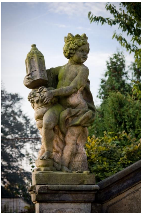
Obr. XI - Alegorická socha Evropa.