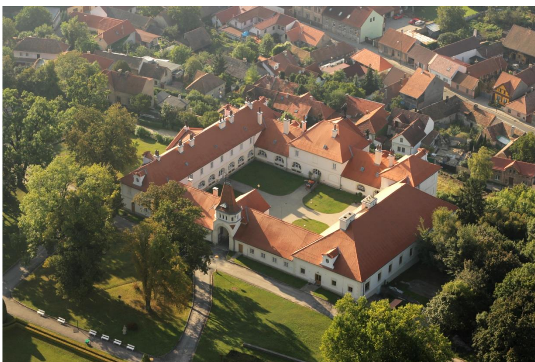
Obr. III - Letecký pohled na bývalý klášter řeholních kanovníků sv. Augustina.