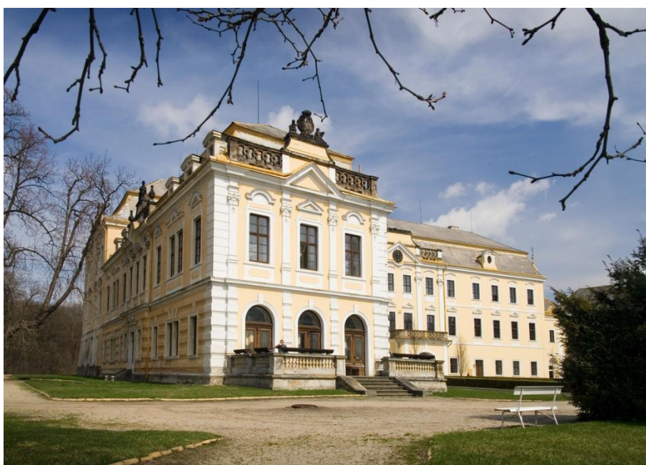
Obr. II - Pohled na část severního a západního křídla zámku.