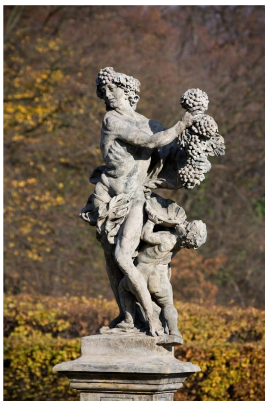
Obr. VI - Alegorická socha Podzim.