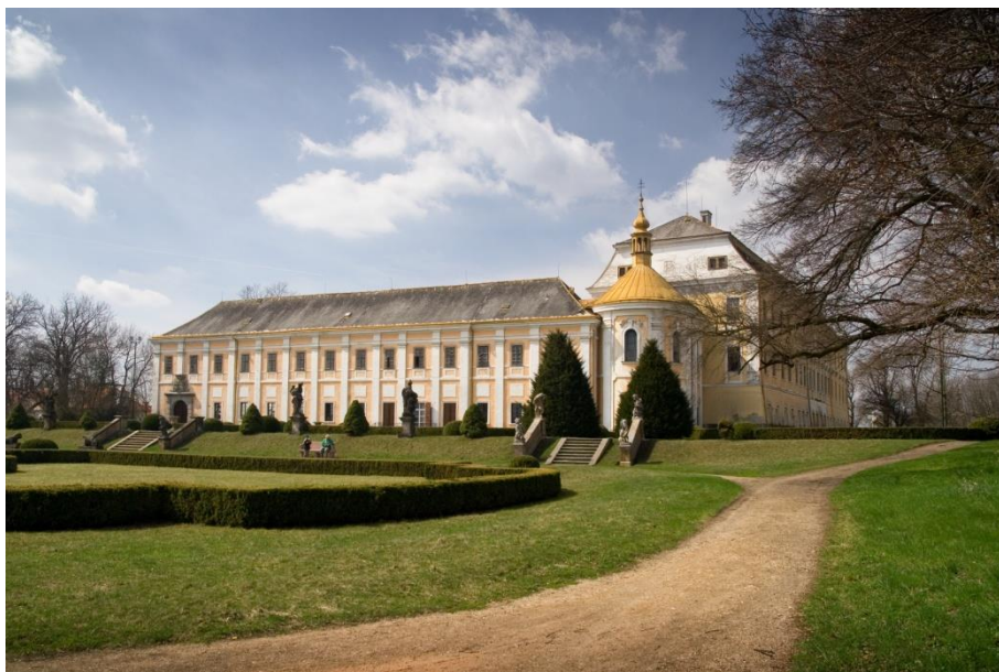
Obr. I - Pohled na východní průčelí východního křídla zámku.