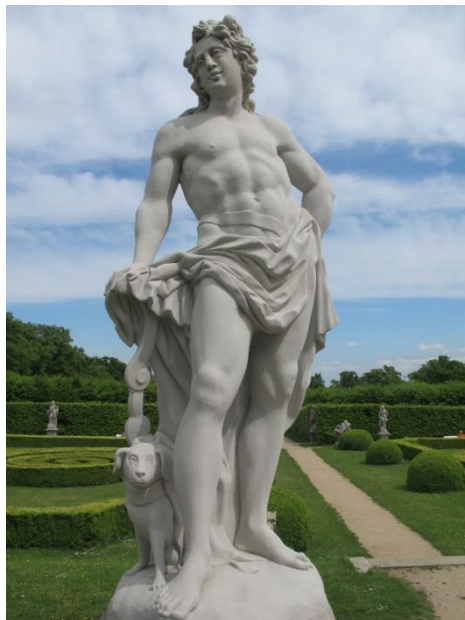
Obr. VIII - Socha Apollona.