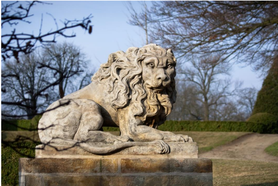
Obr. IX - Socha levého lva.