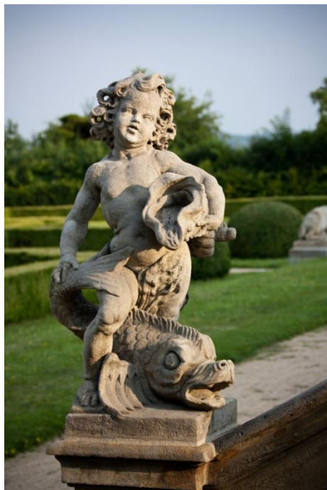
Obr. V - Putti Voda.