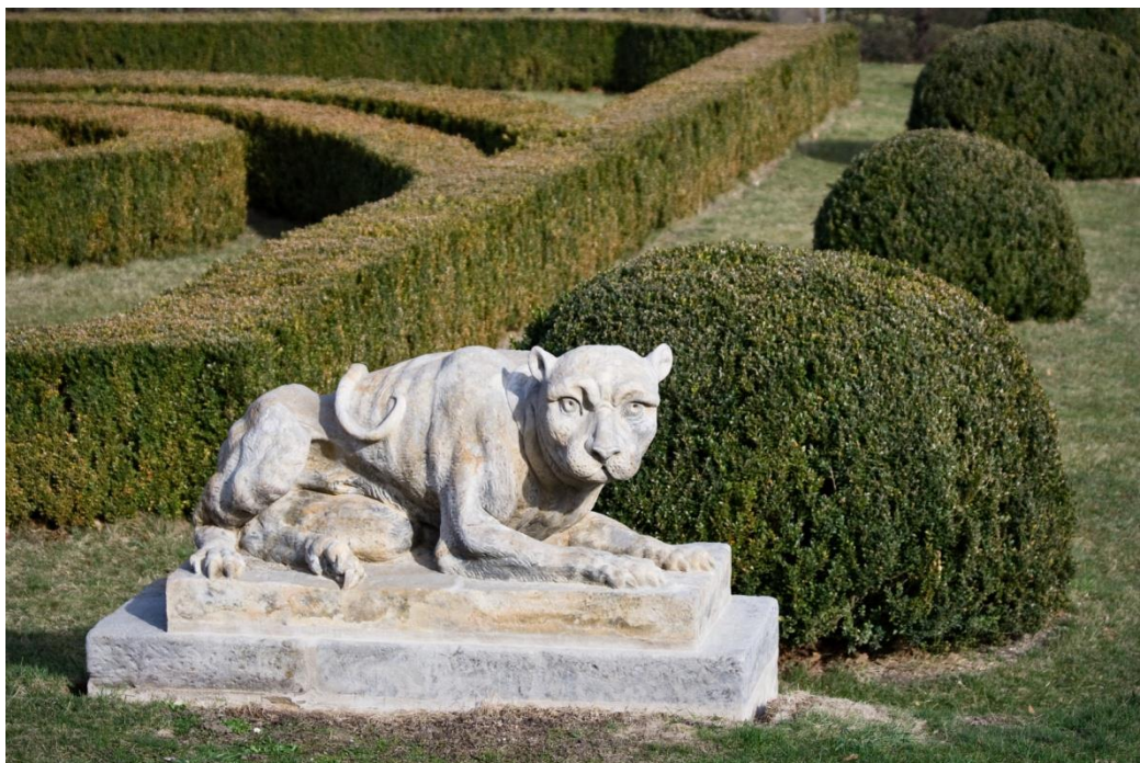
Obr. X - Socha pravé lvice.