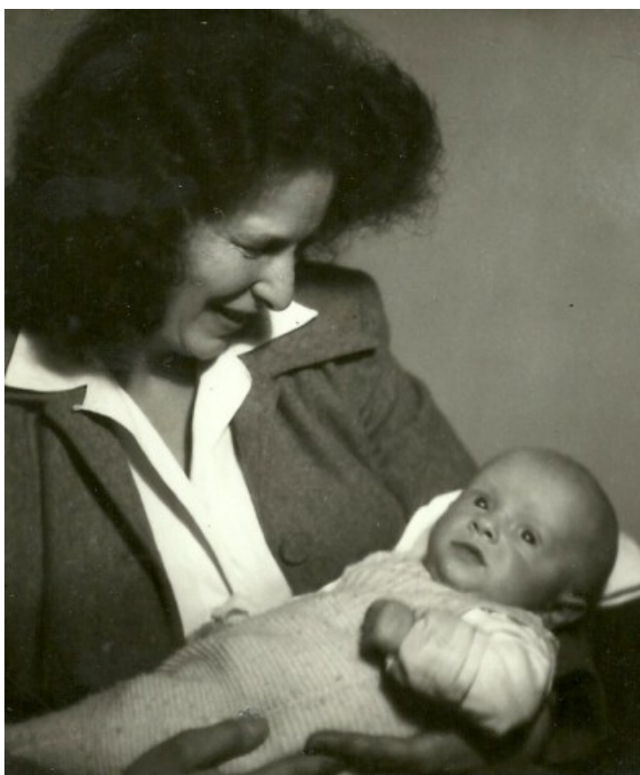
Matka a syn (1948)