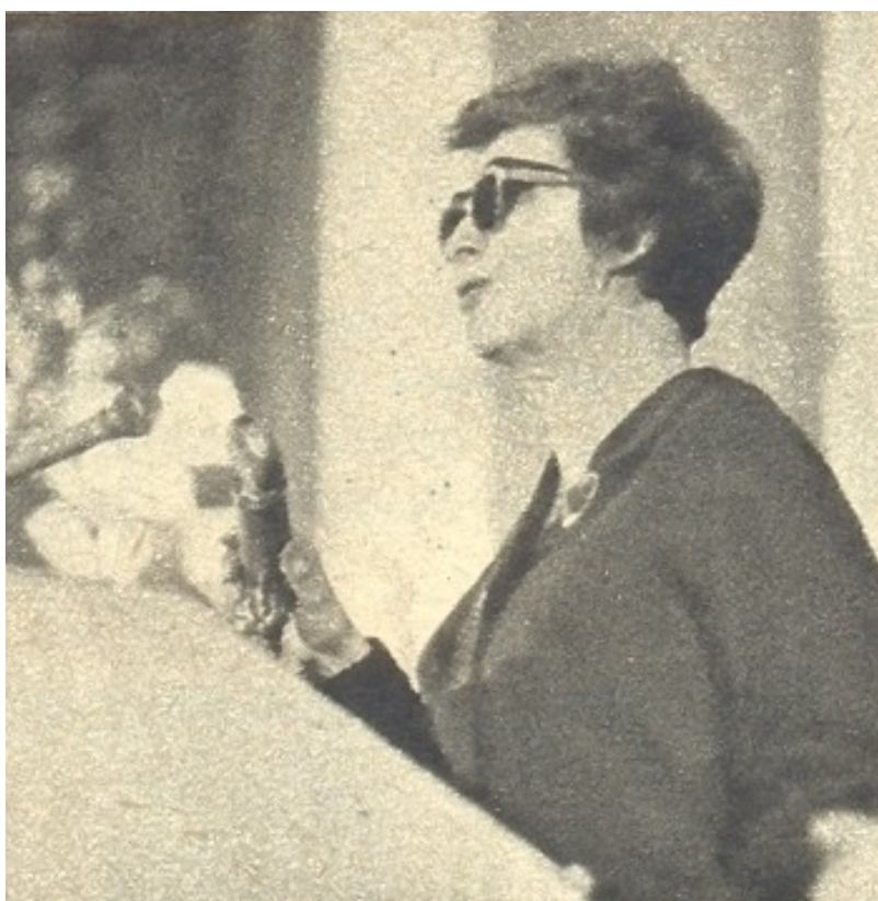
Při obhajobě základních principů obrodného procesu (13.11.1968)