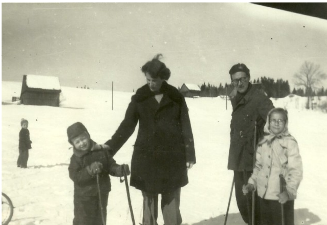
Rodina na zimní dovolené (50.léta)