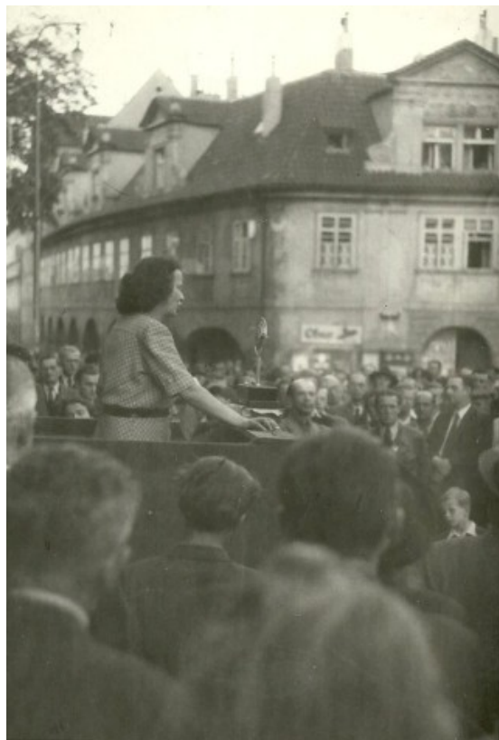
Před auditoriem: v plénu VS OSN (USA,1951) ..... před lidmi na náměstí (asi 2.pol.40.let)