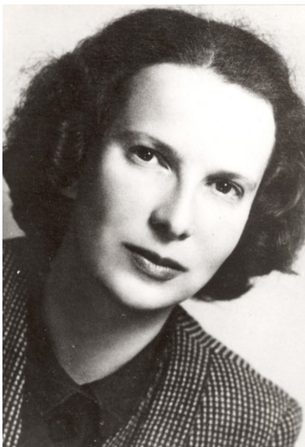
Foto z indexu