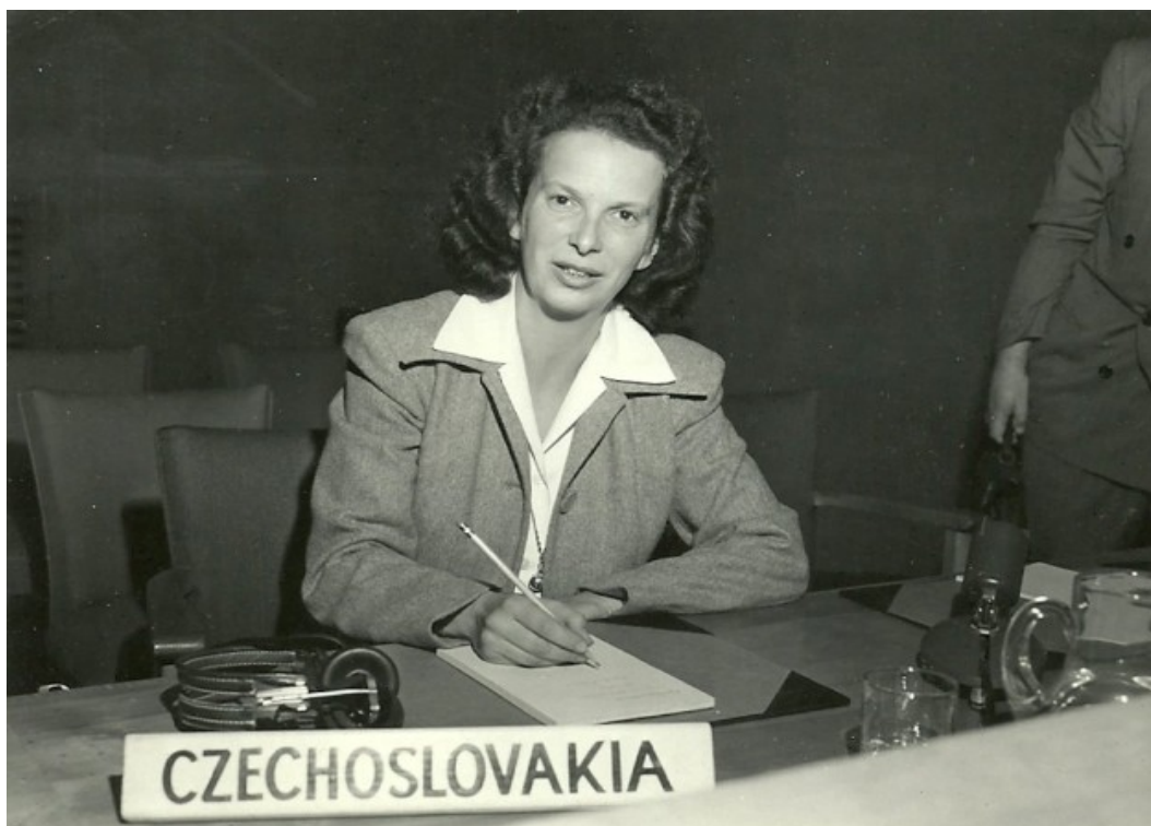
Jako čs. delegátka na zasedání Valného shromáždění OSN (druhá pol. 40. let)