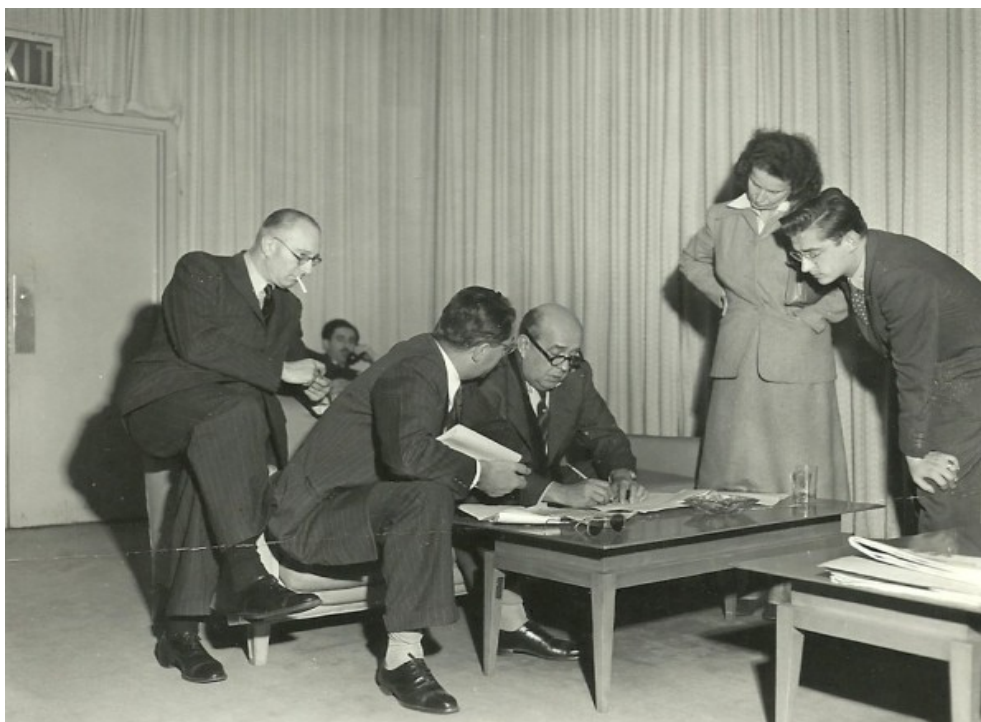
S ministrem Janem Masarykem na zasedání Valného shromáždění OSN (2. pol. 40. let)