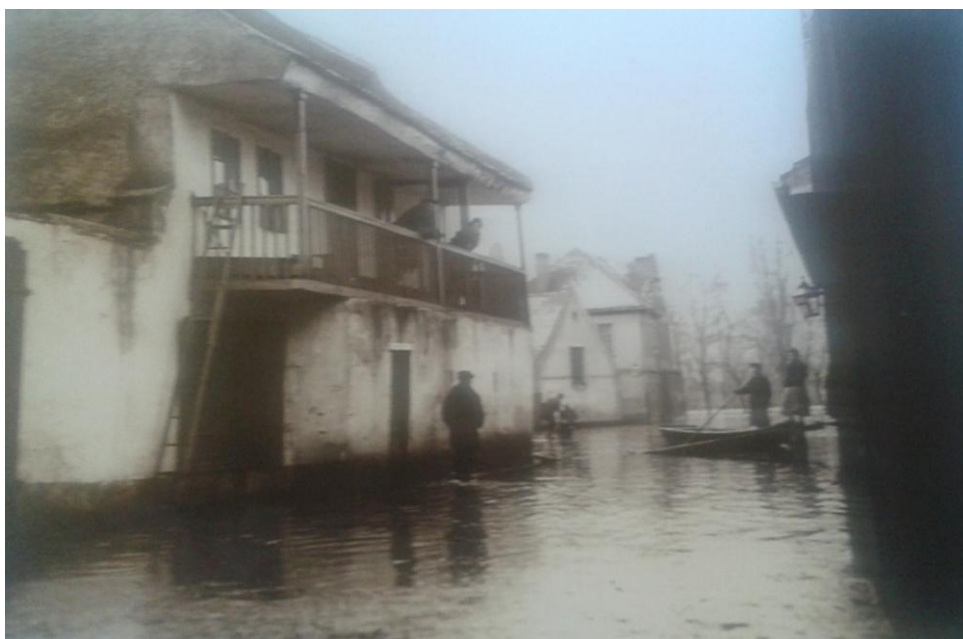
Obrazová příloha číslo IV. – Povodeň v únoru 1920, pohled na Koželužskou ulici směrem k Vltavě 79