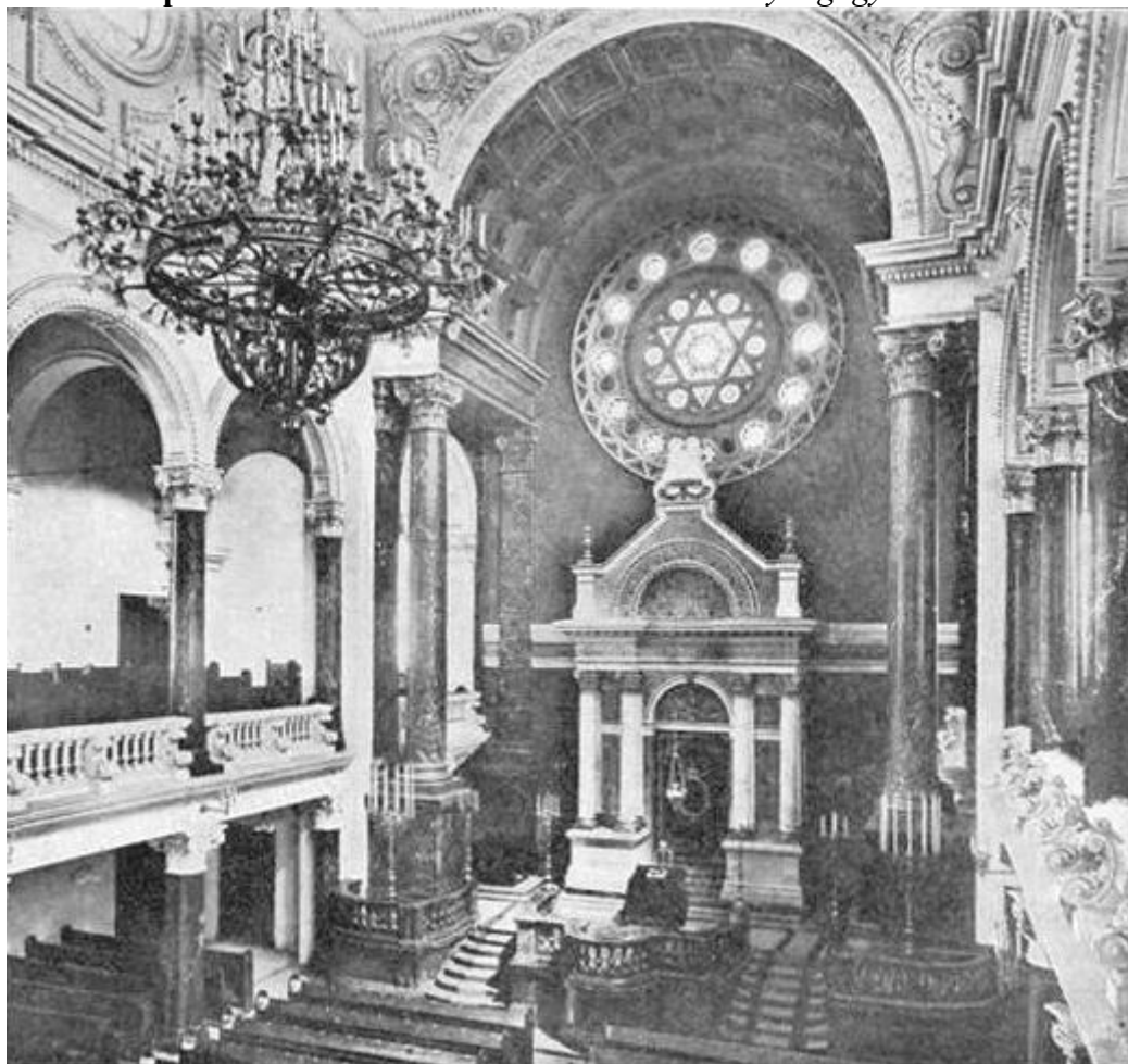
Obrazová příloha číslo XIV. – Interiér vinohradské synagogy