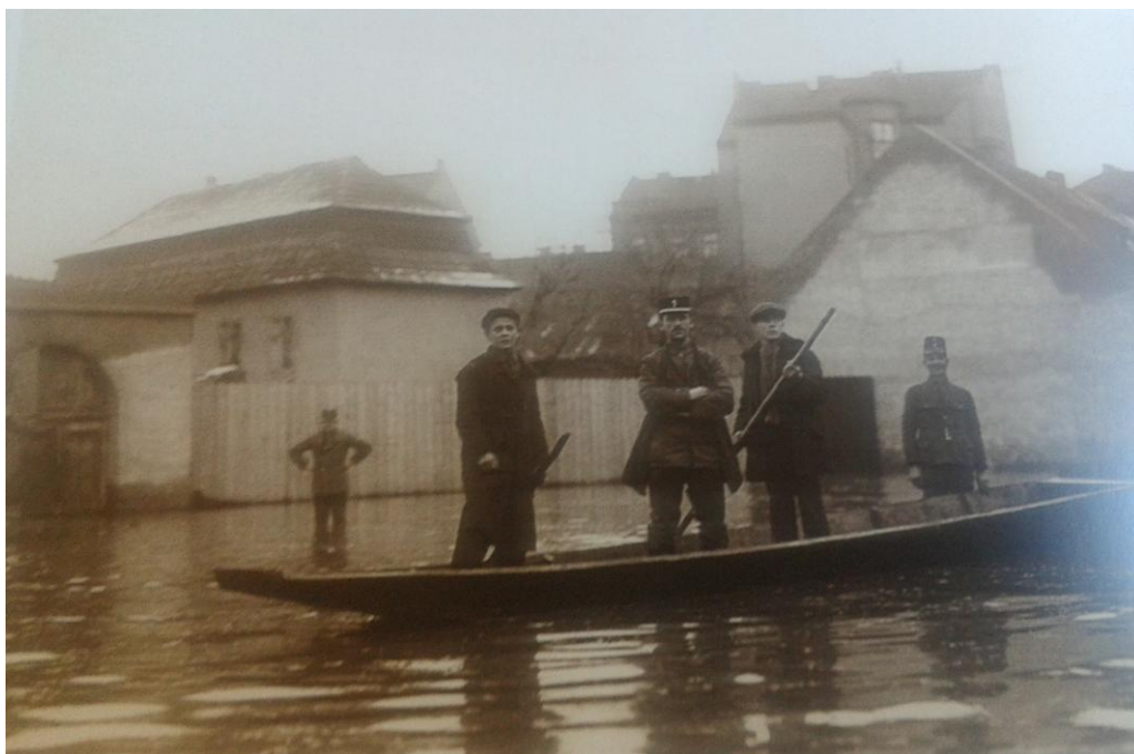
Obrazová příloha číslo VI. – Povodeň v únoru 1920, U Světova statku na tohu dnešní Zenklovy třídy (Primátorská) a Elsnicova náměstí (Světovo nábreží) 81