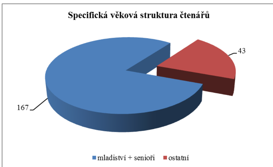
Graf 3 Specifická struktura čtenářů 20

Nové koncipované centrum by spojovalo knihovnu, která by tímto získala vlastní technické zázemí pro půjčovnu i sklad (jejichž absence se stává palčivým problémem), s prostory pro volnočasové aktivity. Zároveň by zde byl vytvořen dostatečný prostor pro studovnu s přístupem k internetu a došlo by k integraci stávajícího Informačního centra, které se nachází ve velmi stísněných prostorách na mšenské radnici. Tím by bylo možné zajistit propojení kulturně vzdělávací oblasti s oblastí informační nejen pro obyvatele obce, ale i návštěvníků Kokořínska, kterým rok od roku přibývá. Vzhledem k věkové struktuře klientů by byl kladen důraz na nabídku aktivit pro dvě dominantní věkové kategorie – do 15 let a nad 60, jak je zřejmé z následujícího grafu.