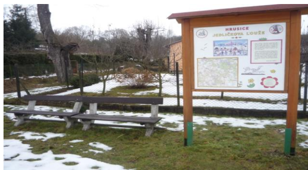
Foto: Informační tabule v místě bývalé Jedličkovy louže, Hrusice 8.1 2011

Pepík Ševců – Josef Lada zde naučil mluvit lidskou řečí nejen kocourka Mikeše, ale později i čuníka Pašíka. A když Mikeš kvůli rozbitému krajáci utekl do světa, přibyl do chalupy mrňous Náciček.“