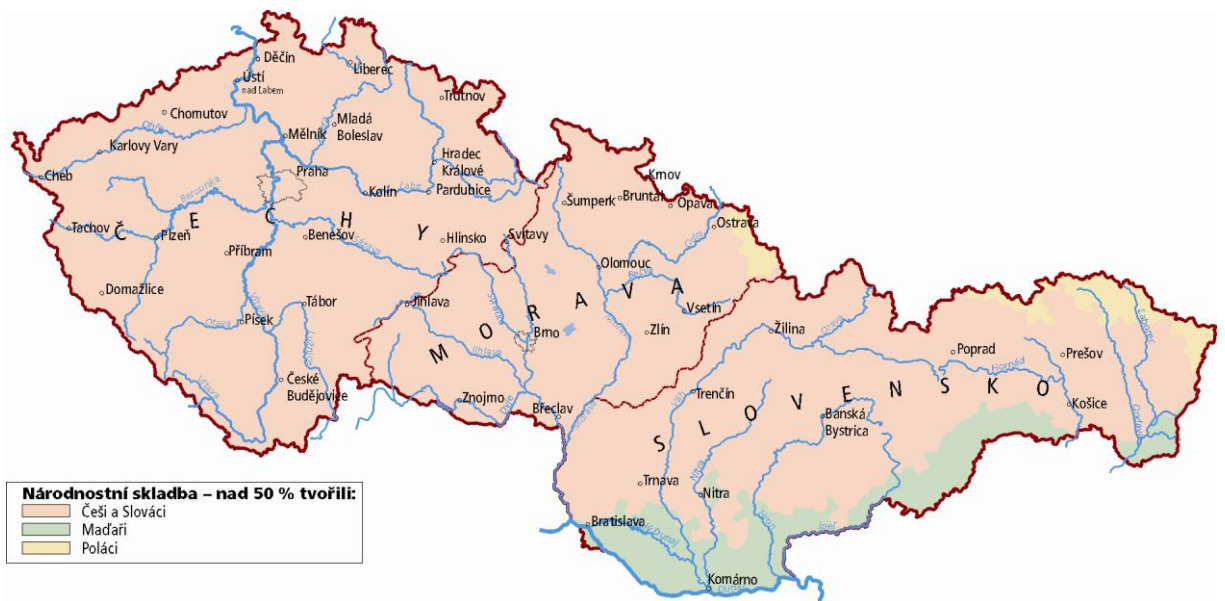
Mapa 2. Národnostní skladba obyvatelstva v ČSR po druhé světové válce (Semotanová 2006).