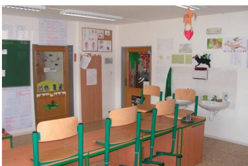
Obr. 3 Prostory školní učebny v Dětském domově se školou Zařízení pro děti – cizince. ( www.ddc.cz )