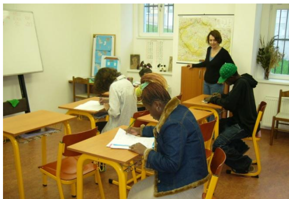
Obr. 1 Výuka klientů Diagnostického ústavu Zařízení pro děti – cizince. ( www.ddc.cz )