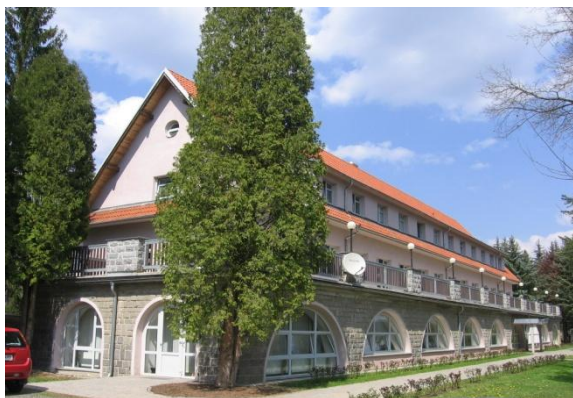
Obr. 2 Budova A Dětského domova Zařízení pro děti – cizince. ( www.ddc.cz )