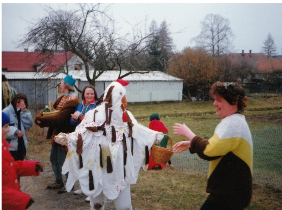
Účastníci masopustní obchůzky v Kostelní Radouni – rok 1993