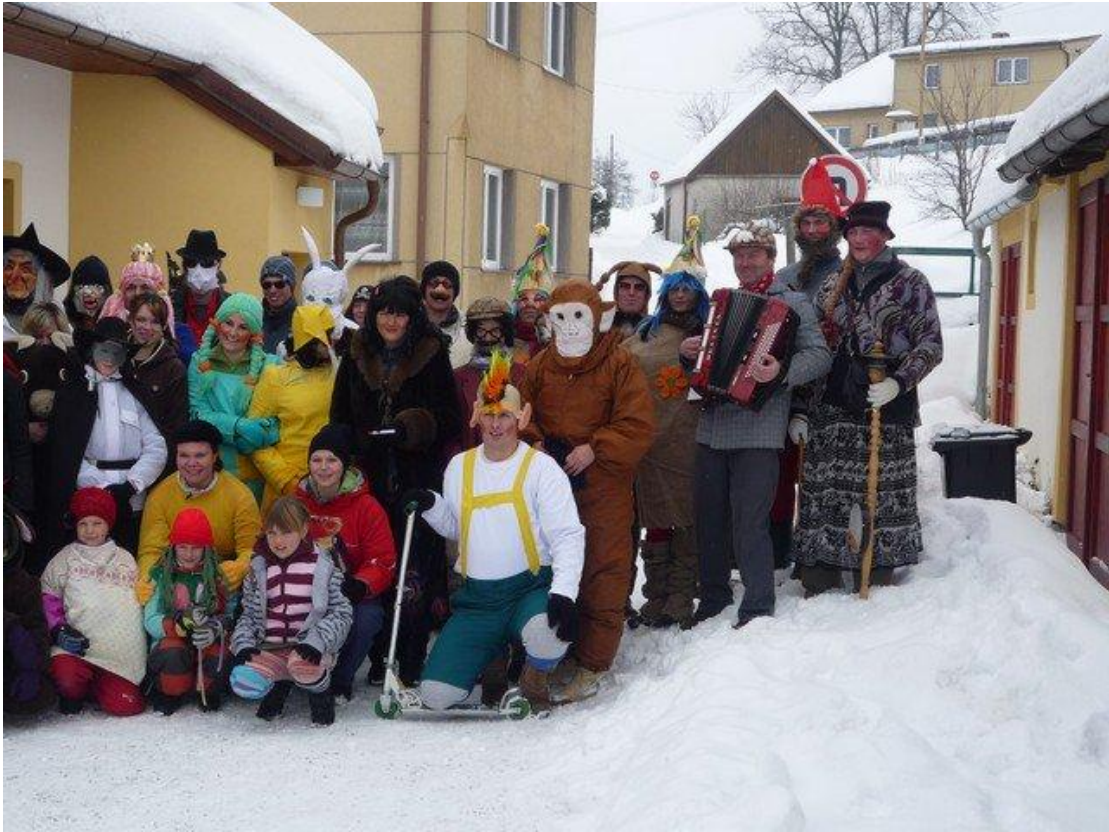
Účastníci masopustní obchůzky v Kostelní Radouni – rok 2010