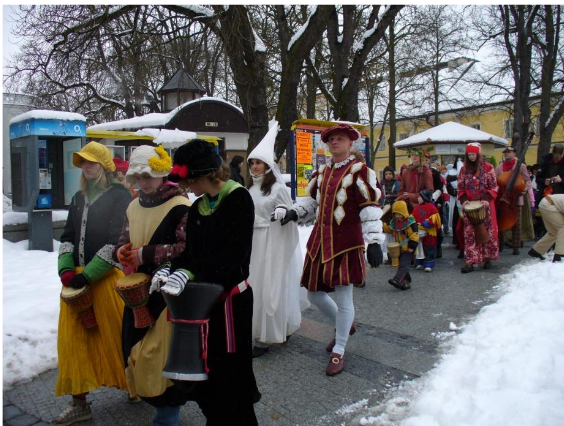
Účastníci masopustního průvodu v Jindřichově Hradci – rok 2009