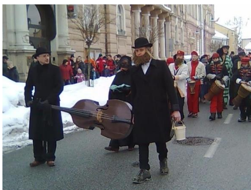
Účastníci masopustního průvodu v Jindřichově Hradci – rok 2009