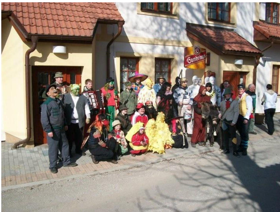
Účastníci masopustní obchůzky v Kostelní Radouni – rok 2011