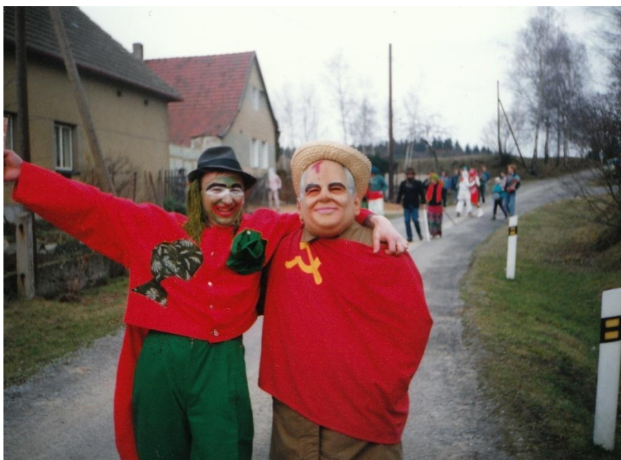
Účastníci masopustní obchůzky v Kostelní Radouňi – rok 1993