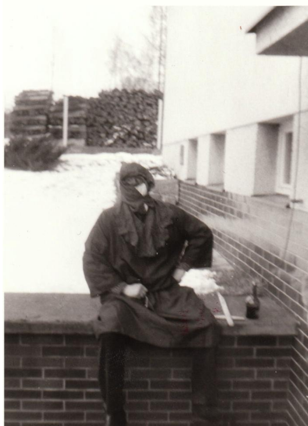
Účastník masopustní obchůzky v Kostelní Radouni – rok 1989