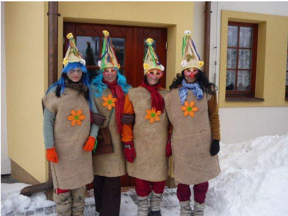
Účastníci masopustní obchůzky v Kostelní Radouni – rok 2010