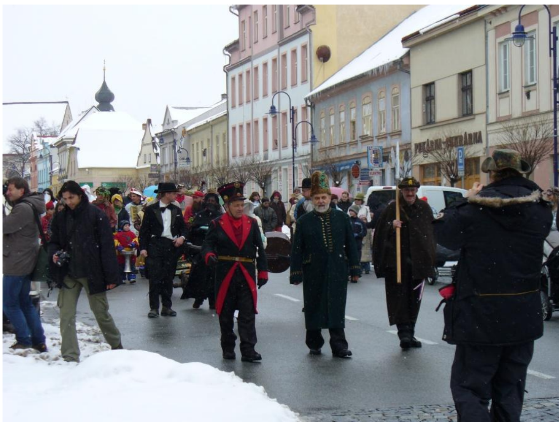
Účastníci masopustního průvodu v Jindřichově Hradci – rok 2009