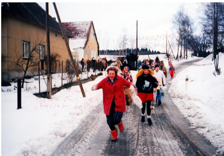
Účastníci masopustní obchůzky v Kostelní Radouni – rok 1993