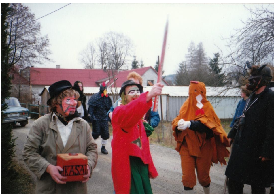
Účastníci masopustní obchůzky v Kostelní Radouňi – rok 1993