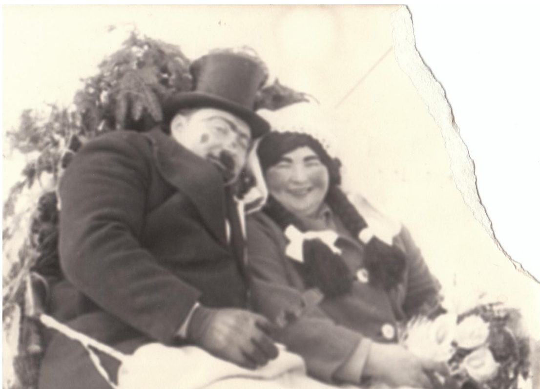
Účastníci masopustní obchůzky v Kostelní Radouni – rok 1975