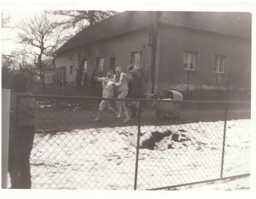
Účastníci masopustní obchůzky v Kostelní Radouni – rok 1989