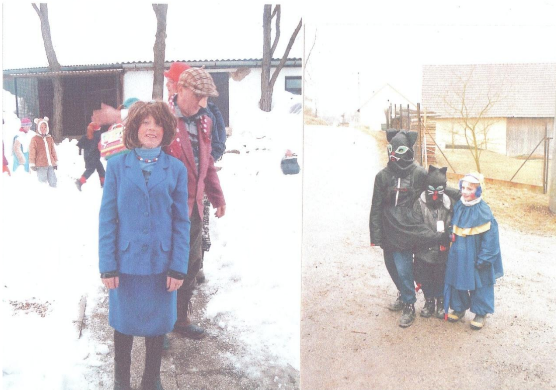
Účastníci masopustní obchůzky v Kostelní Radouni – rok 2006