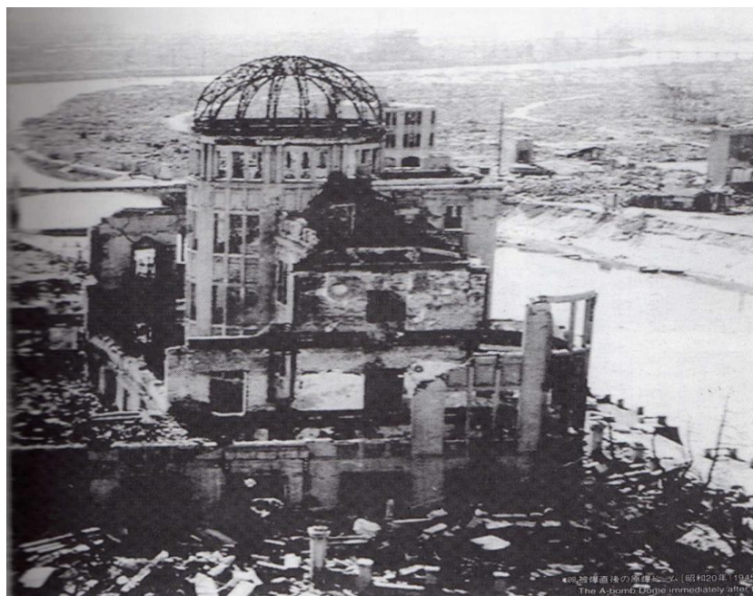
Obrázek 8: Průmyslový palác v Hirošimě po výbuchu jaderné bomby v roce 1945 (in Bohadlo: Japonsko – země, kterou jsem hledal ).