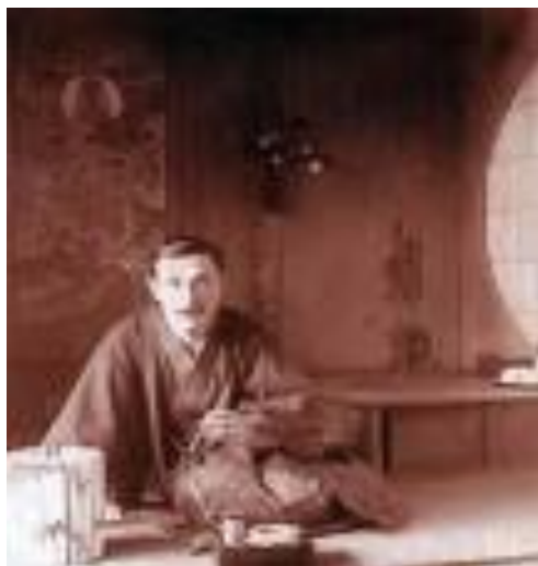
Obrázek 3: Joe Hloucha (in: KRAEMEROVÁ A. – ŠEJBL J.: Japonsko, má láska – český cestovatel a sběratel Joe Hloucha, Praha, Národní muzeum, 2007 ).