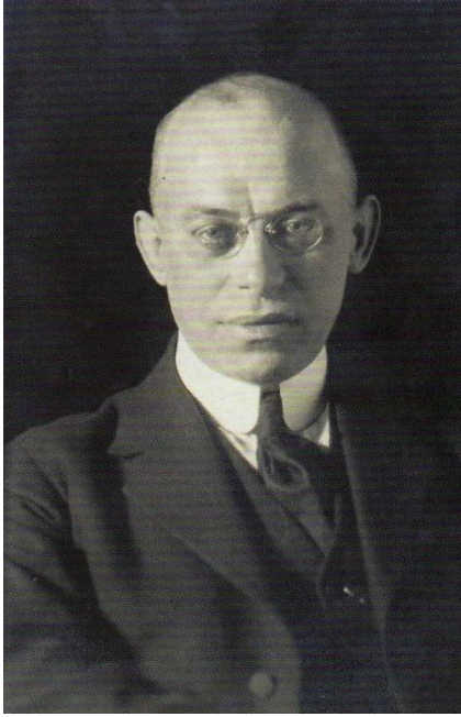
Obrázek 5: Architekt Jan Letzel v roce 1920 (in Bohadolo: Japonsko – země, kterou jsem hledal ).