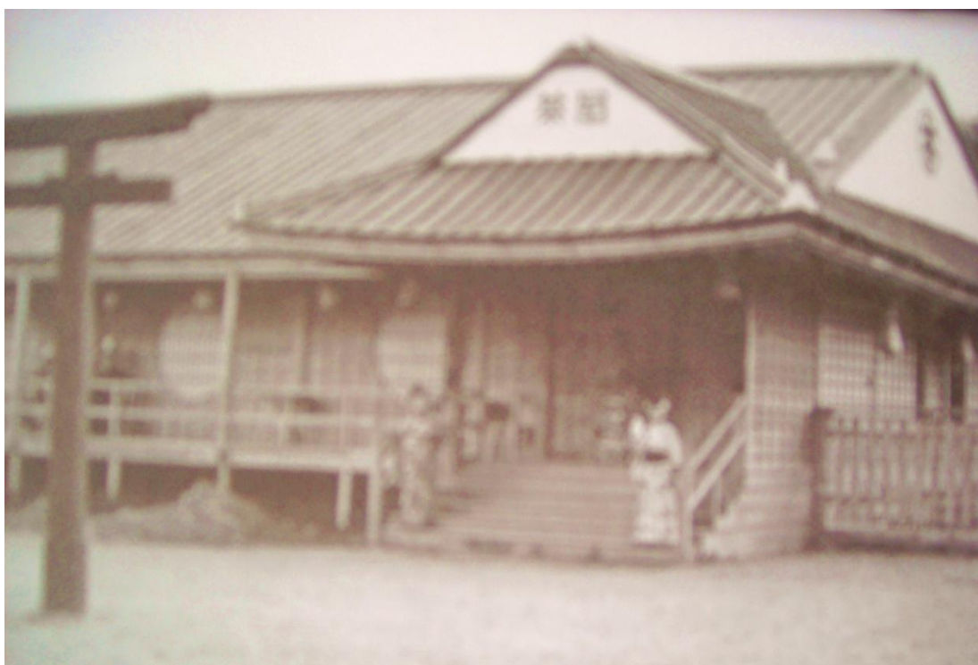
Obrázek 4: Hlouchova čajovna Jokohama (in: KRAEMEROVÁ A. – ŠEJBL J.: Japonsko, má láska – český cestovatel a sběratel Joe Hloucha, Praha, Národní muzeum, 2007 ).