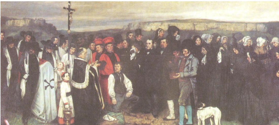
7. Un enterrement à Ornans , par Gustave Courbet