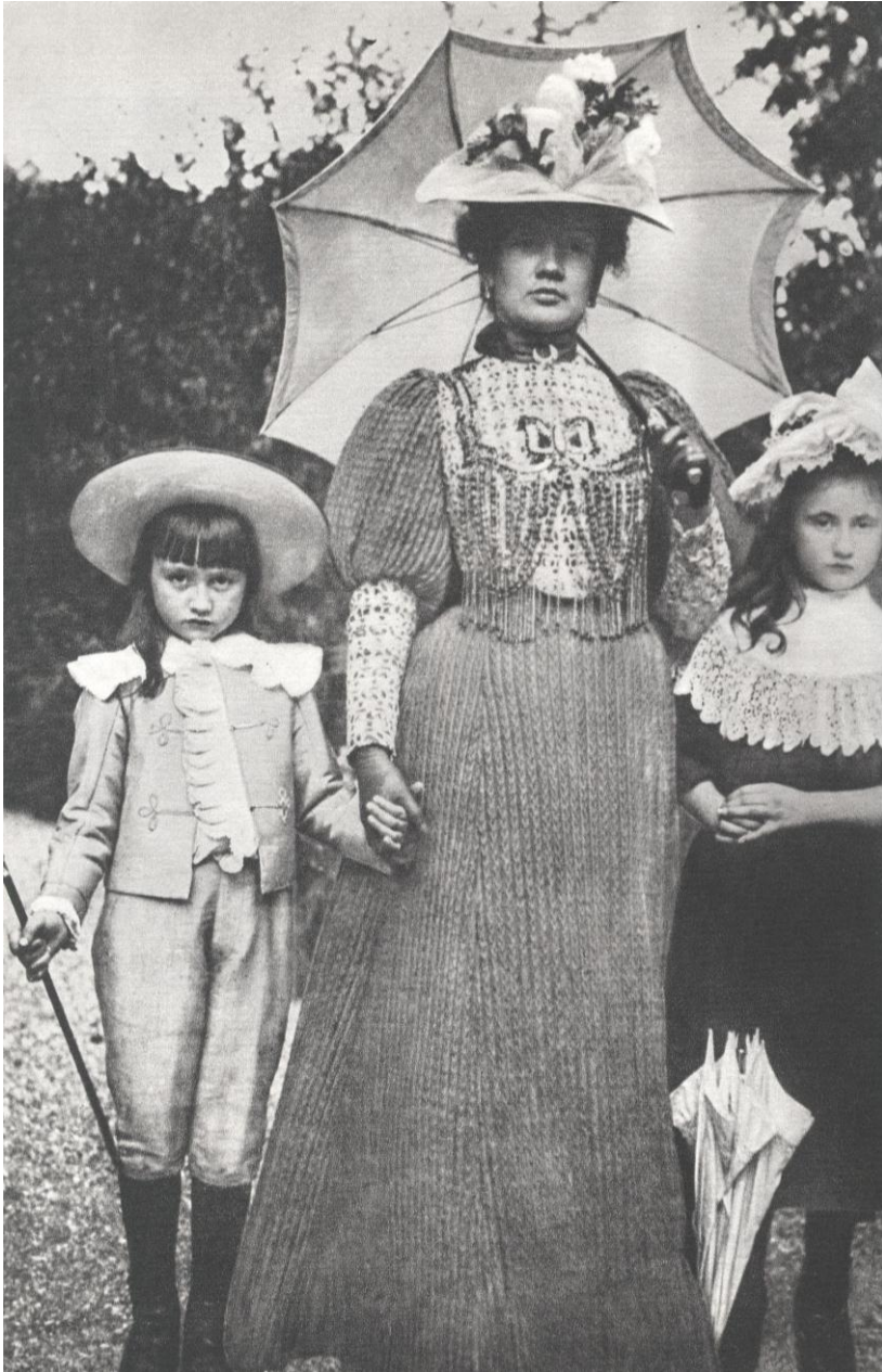
11. Jeanne Rozerot et les enfants- Denise et Jacques