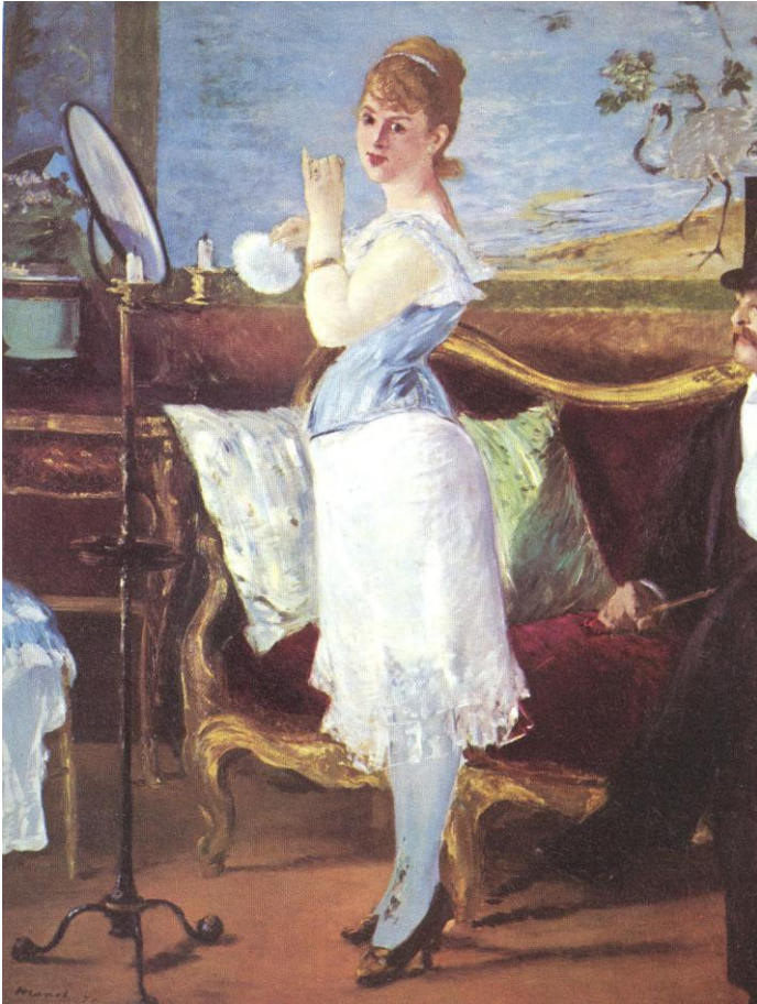
6. Nana , par Édouard Manet