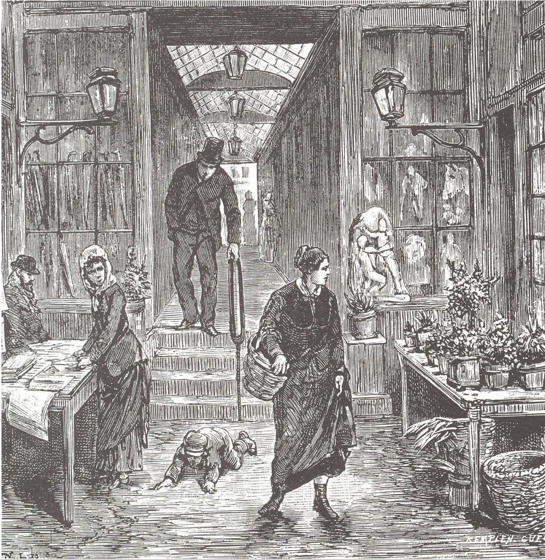
3. Le passage du Pont-Neuf à Paris , par Castelli