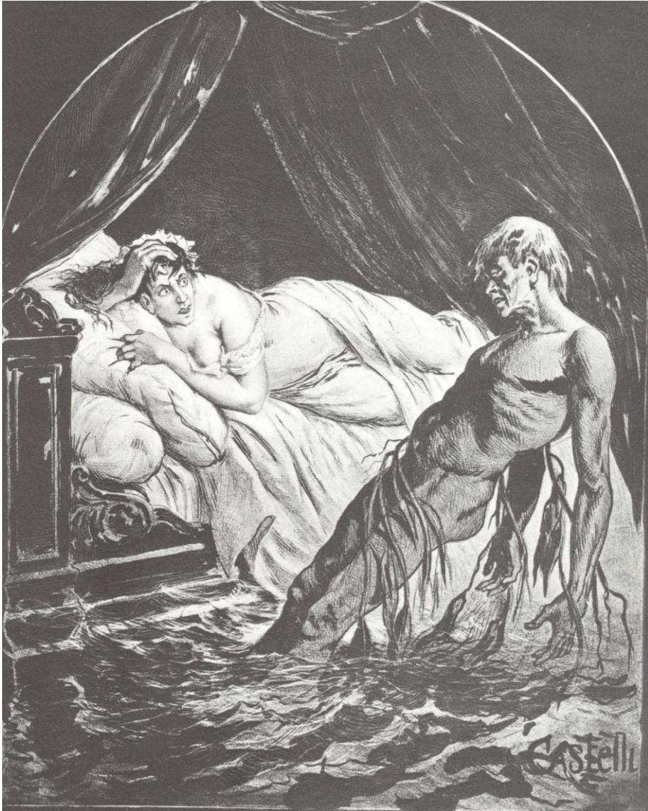
4. Affiche de librairie pour Thérèse Raquin- Le couchemar de Thérèse , par Castelli