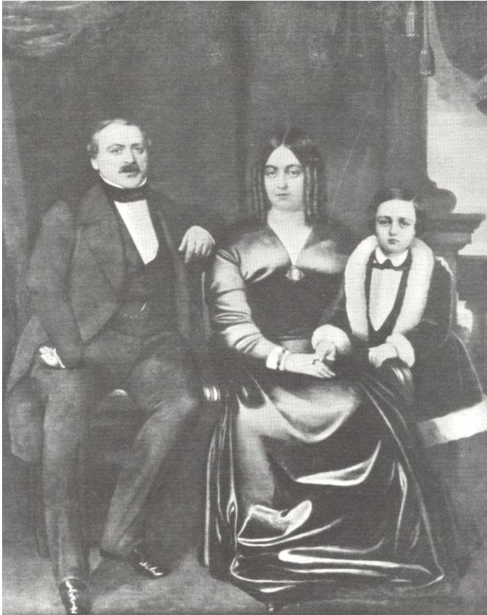
1. La famille Zola- François, Émilie et Émile