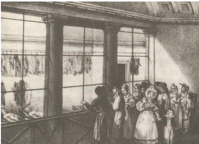
9. Vie intérieure de la Morgue- La Morgue , par Delannois