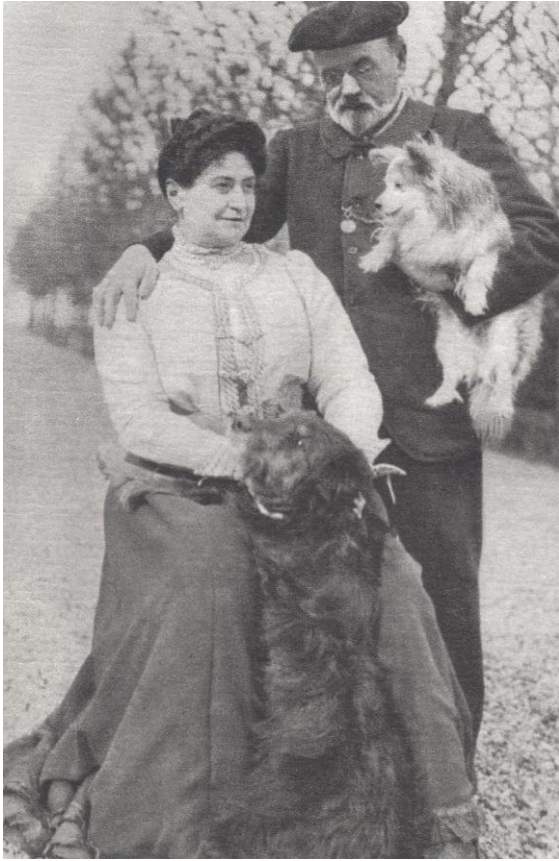
8. Alexandrine Meley avec Émile Zola