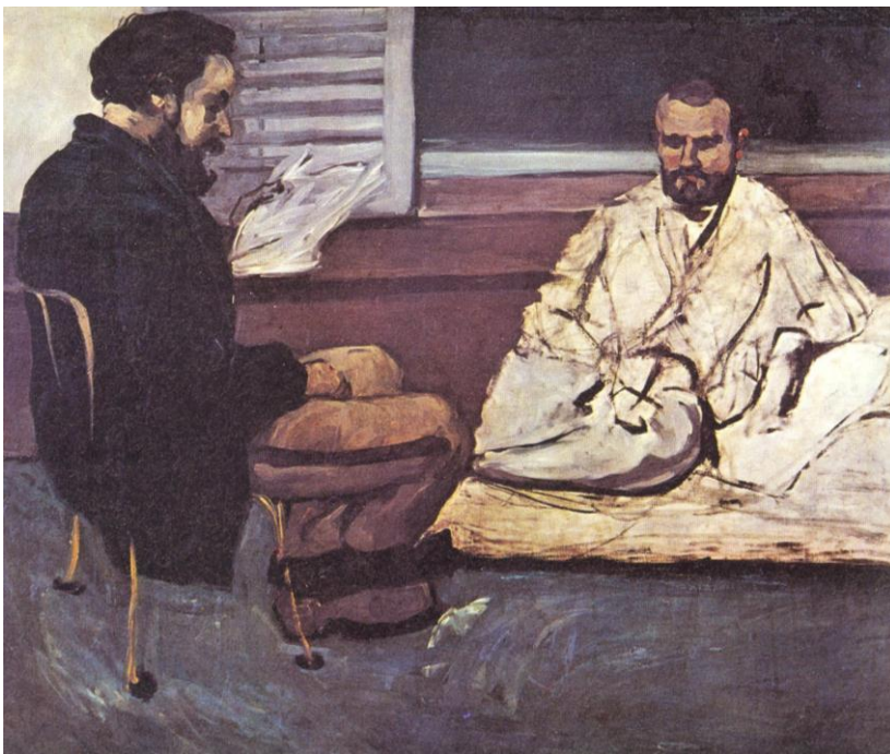
2. Paul Cézanne- Paul Alexis lisant un manuscrit à Zola