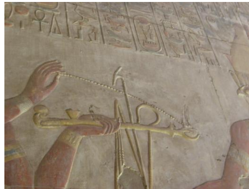
Chrám Sethiho I. v Abydu, 19. Dynastie (1290 - 1279)