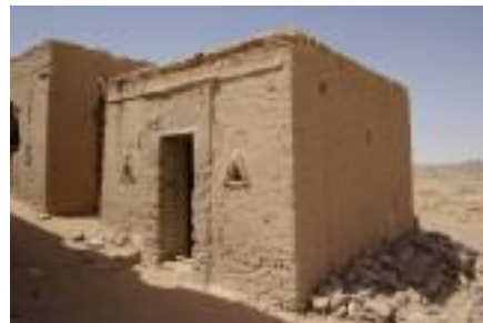
Kaple Exodu na pohřebišti Bagawat v oáze Chárga, 4. stol. n. l.