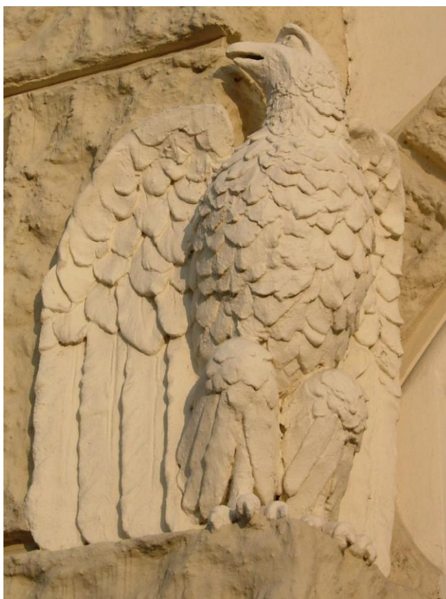
Obr. 13: Říšská/opavská orlice na fasádě tzv. Nového Schmetterhausu/Hlásky (1901-1903).