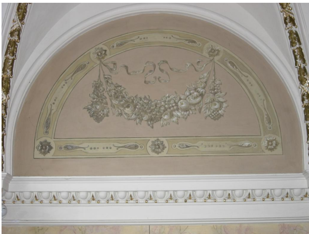
Obr. 8: Raimund Alt, Rudolf Hermann (?): Detail dekorativní výmalby schodišťové haly.