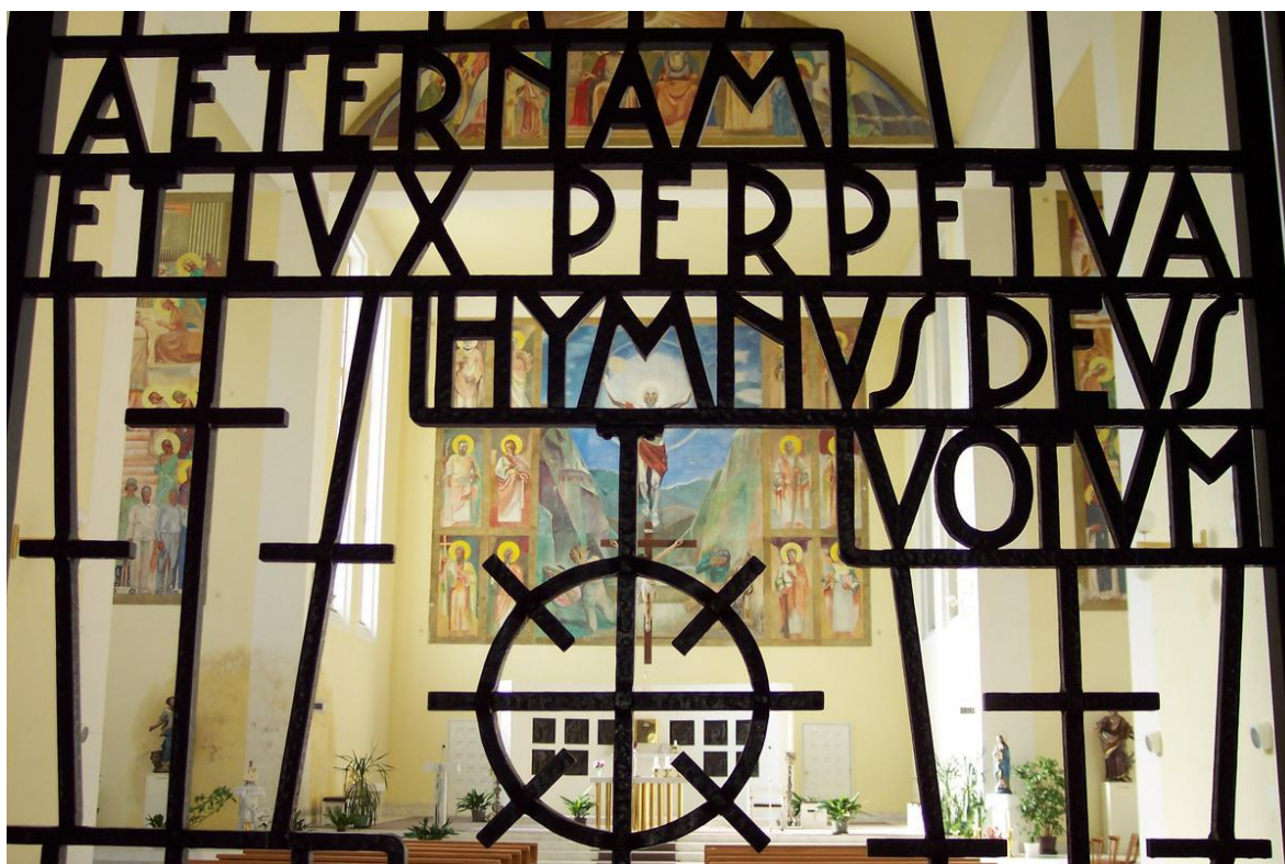
Obr. 26: Ludwig Blucha: Tepaná mříž chrámové předsíně v kostele sv. Hedviky v Opavě (1935).