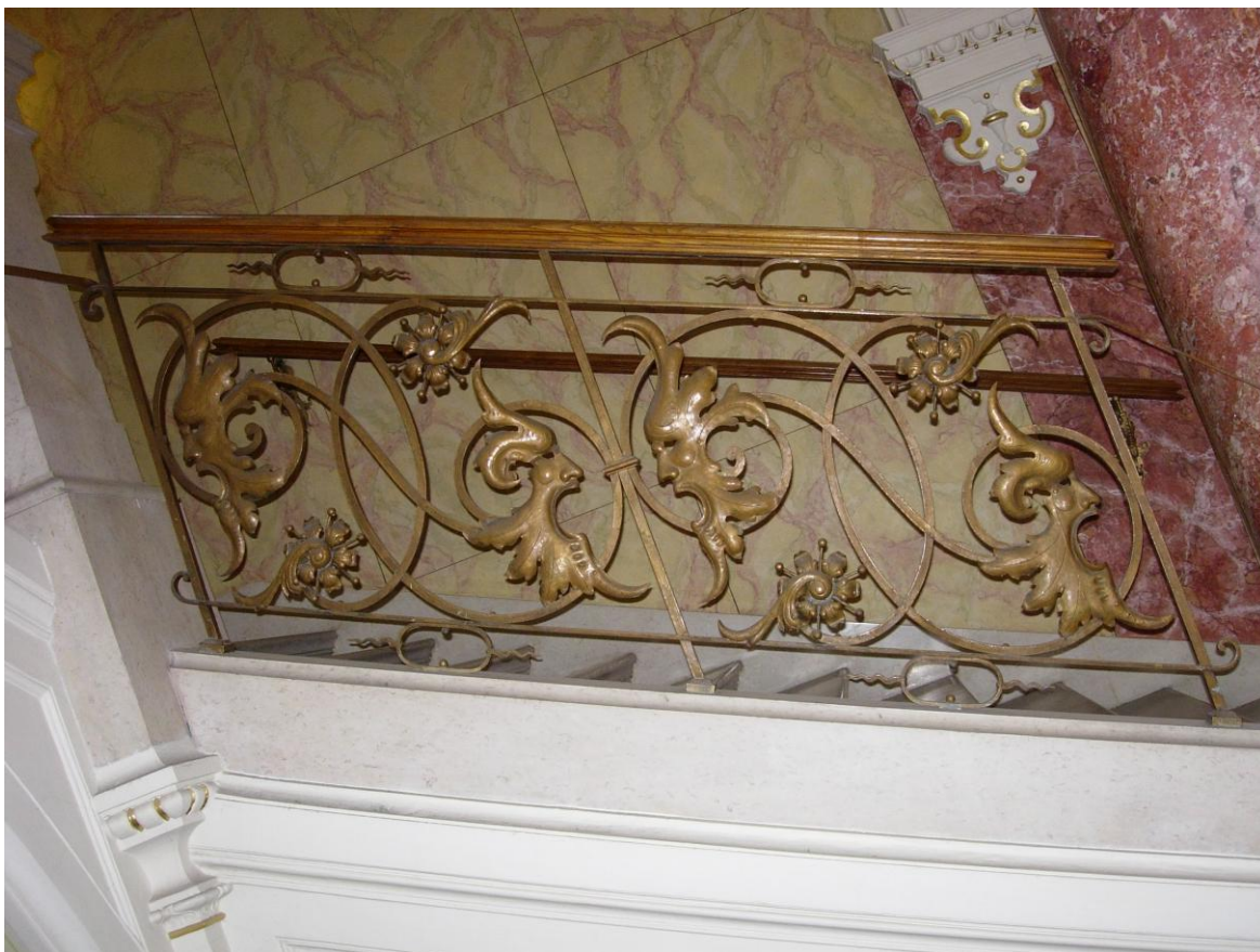
Obr. 9: Franz Stošenovsky: Detail tepaného zábradlí ve schodišťové hale.