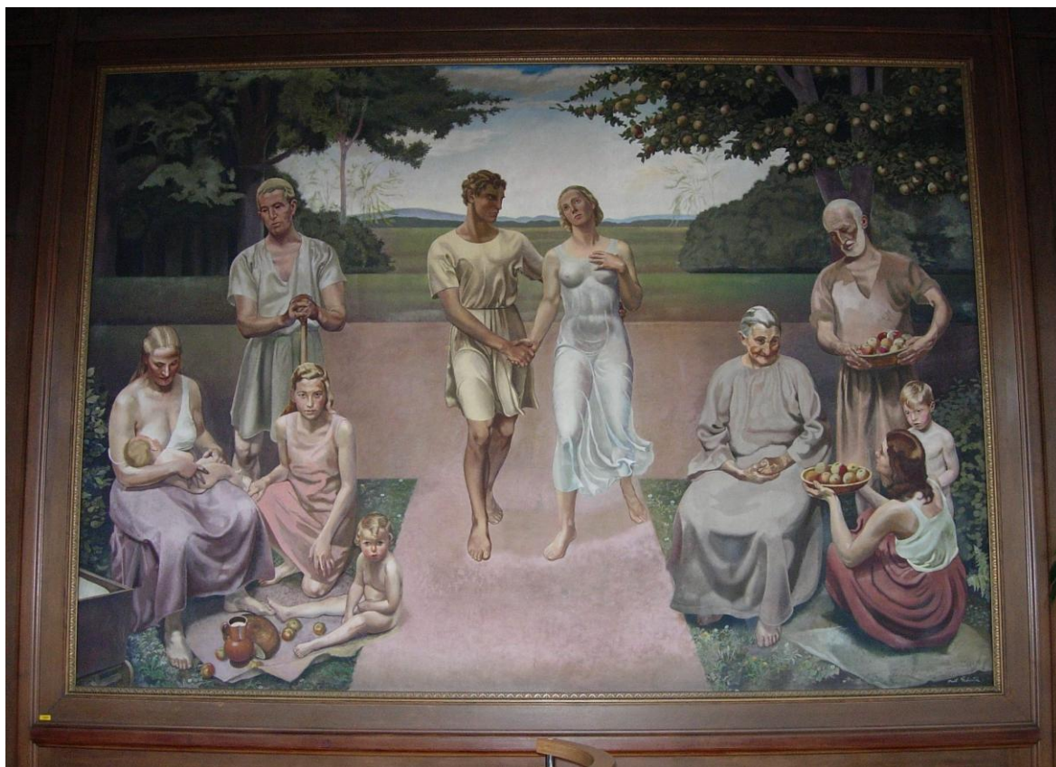
Obr. 10: Paul Gebauer: „Cesta života“ (1933?), monumentální obraz ve velkém zasedacím sále Městské spořitelny v Opavě.