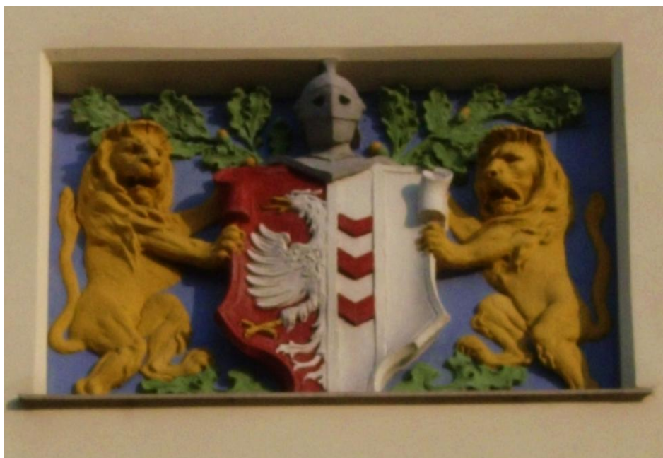
Obr. 12: Polychromovaný reliéf s městským znakem, lvy jako štítonoši a dubovými ratolestmi na hlavním západním průčelí.