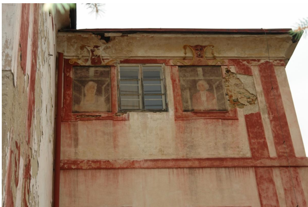
obr. 22 – jihovýchodní roh zámku, iluzivní okna, nad nimi maskaron s volutovými ozdobami