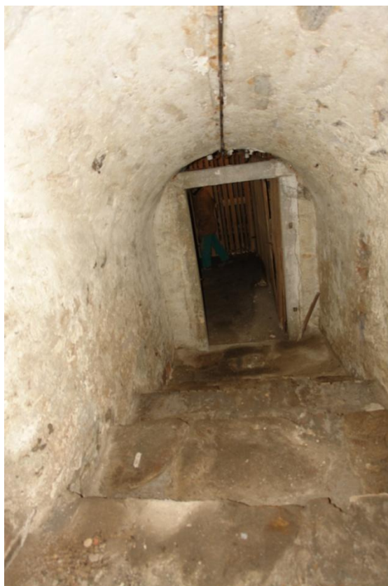
obr. 6 – schodiště do druhého suterénu, zaklenuto valenou klenbou ve spádu