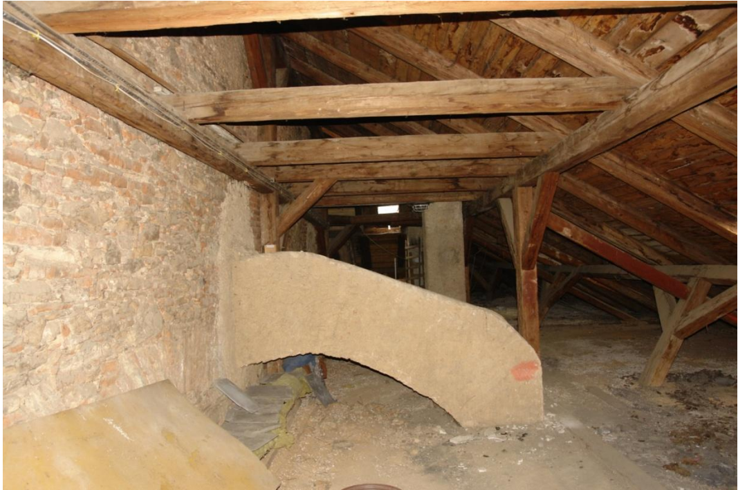
obr. 19 – půda s kouřovodem