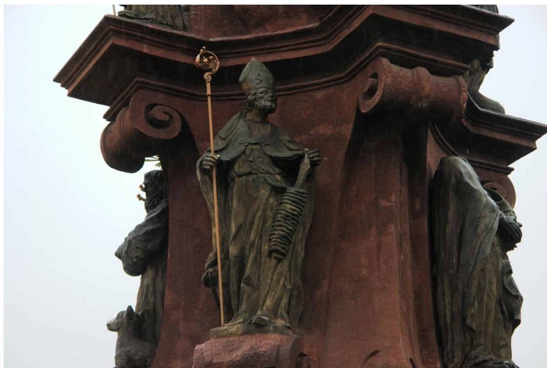
obr. 78 – sloup Čtrnácti pomocníků – sv. Erasmus