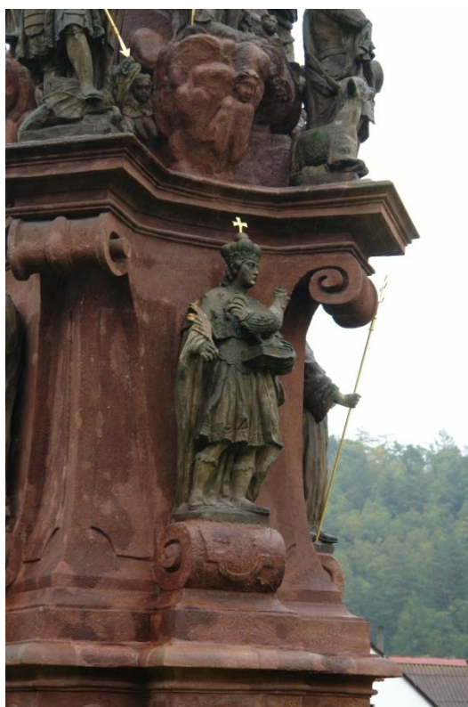
obr. 76 – sloup Čtrnácti pomocníků – sv. Vít