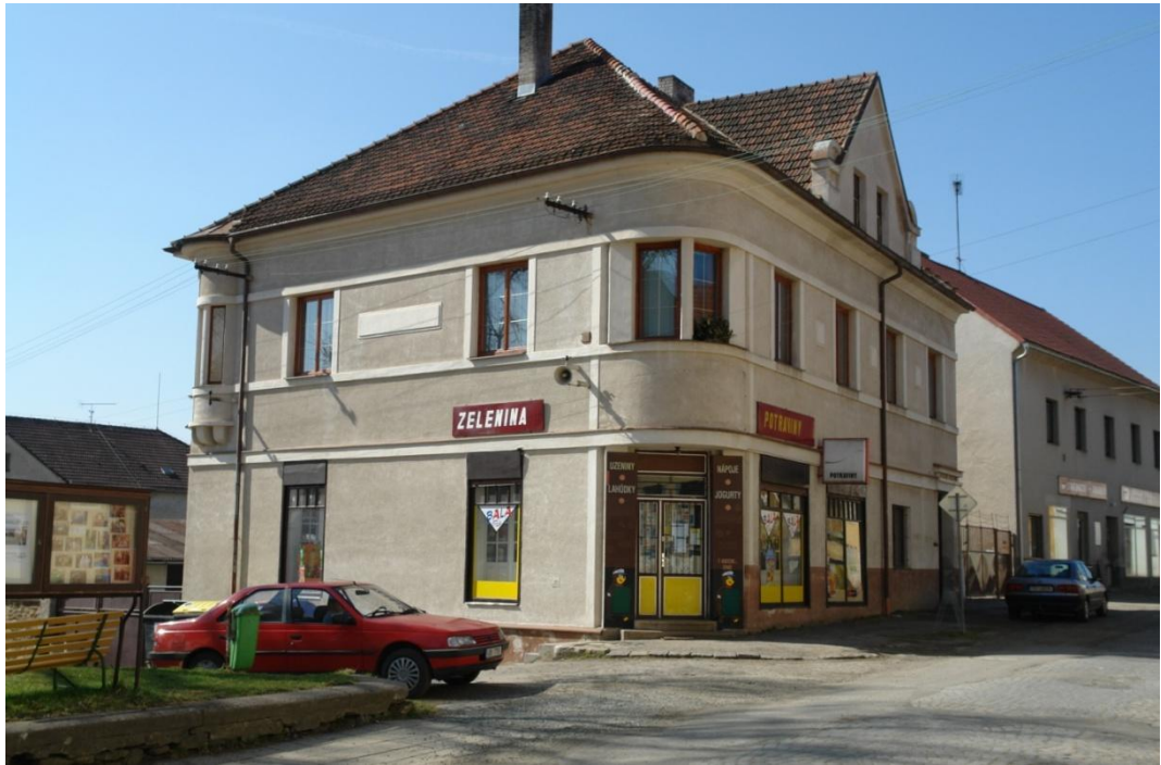
obr. 31 – dům č. p. 80