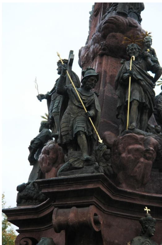
obr. 73 – sloup Čtrnácti pomocníků – sv. Jiří