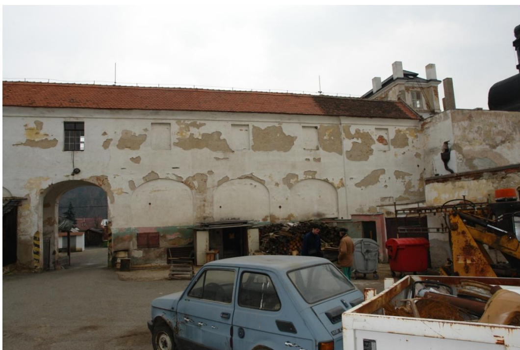
obr. 24 – spojovací chodba ze strany hospodářského dvora