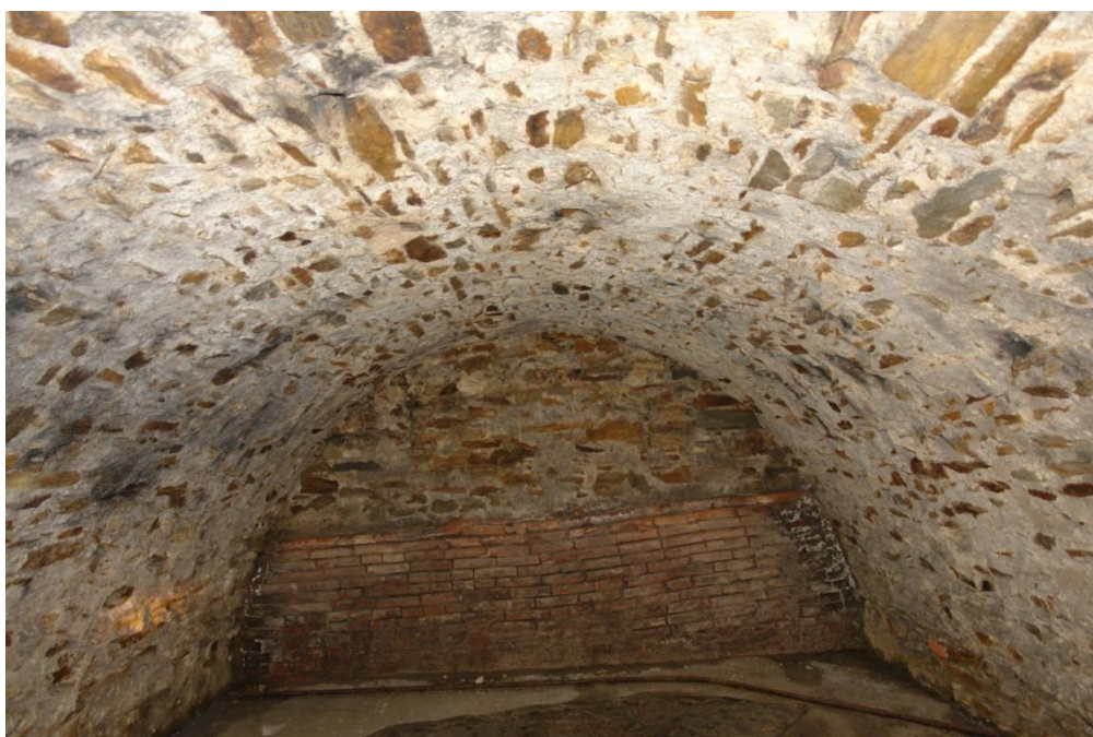
obr. 8 – druhý suterén, místnost s valenou klenbou