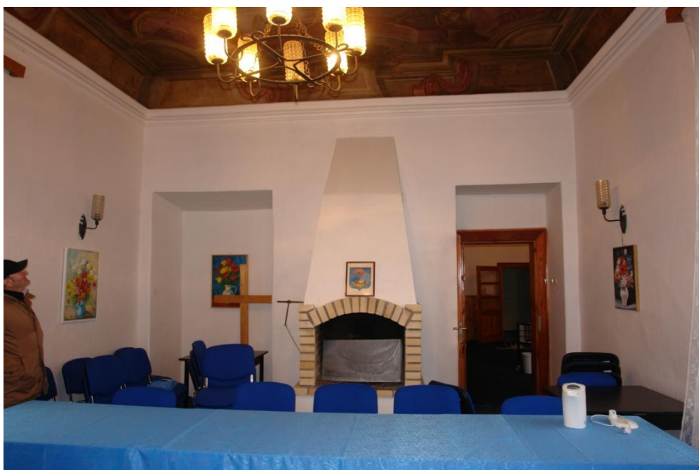
obr. 14 – přízemí, poslední místnost na západní straně s neckovou klenbou