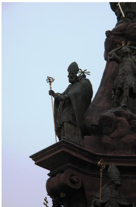
obr. 71 - sloup Čtrnácti pomocníků – sv. Blažej