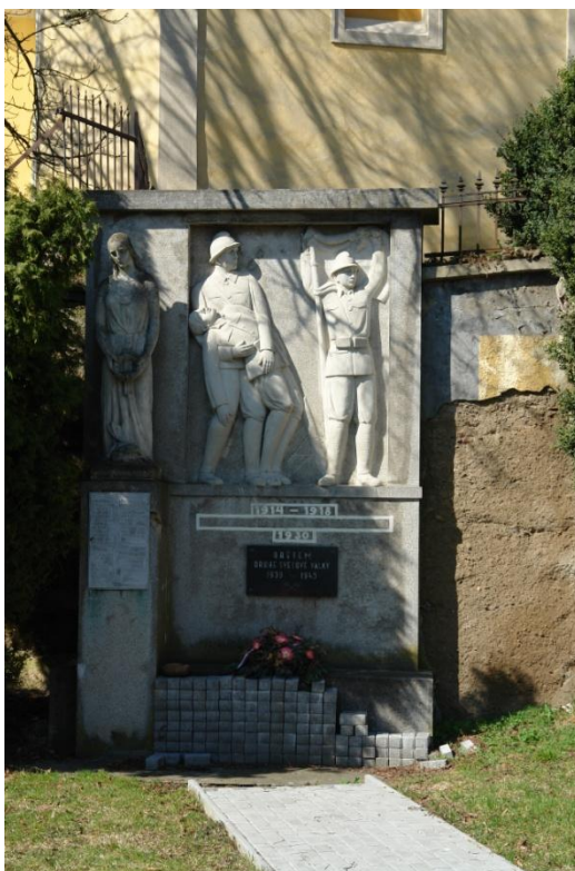
obr. 49 – památník obětem světových válek