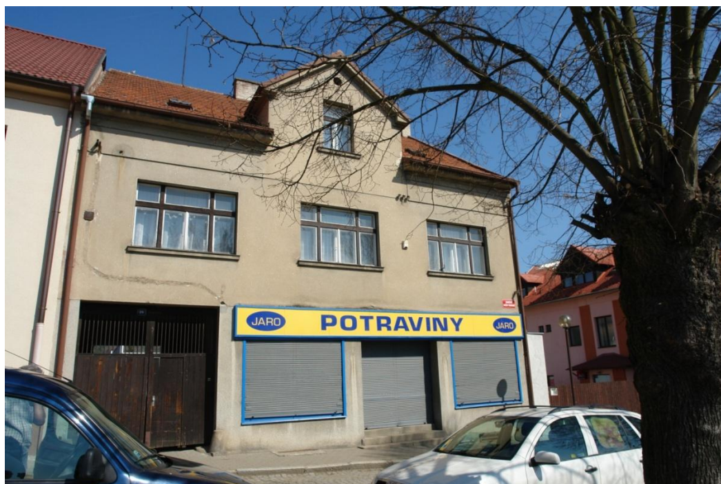
obr. 50 – dům č. p. 27