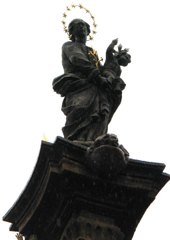
obr. 62 – sloup Čtrnácti pomocníků – Panna Marie s Ježíškem