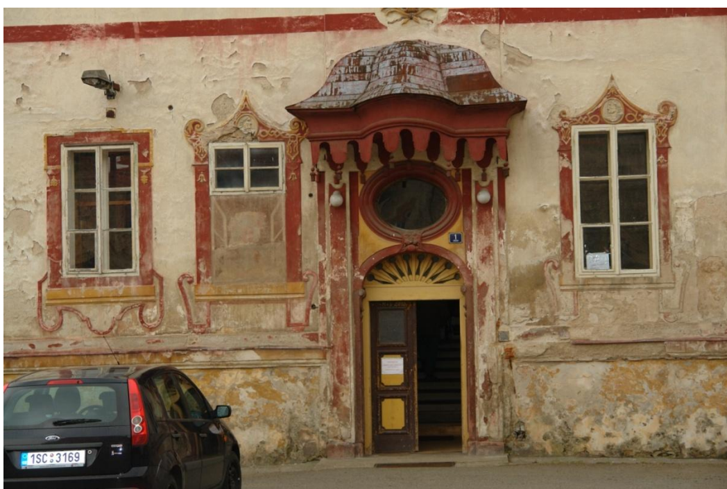
obr. 26 – vstup do zámku ze severní strany