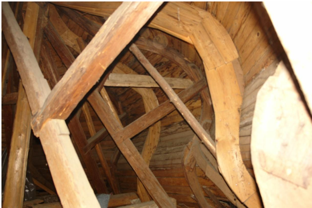
obr. 20 – střecha, zastřešení věže s dřevěným krovem