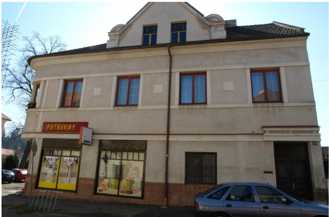
obr. 32 – dům č. p. 80