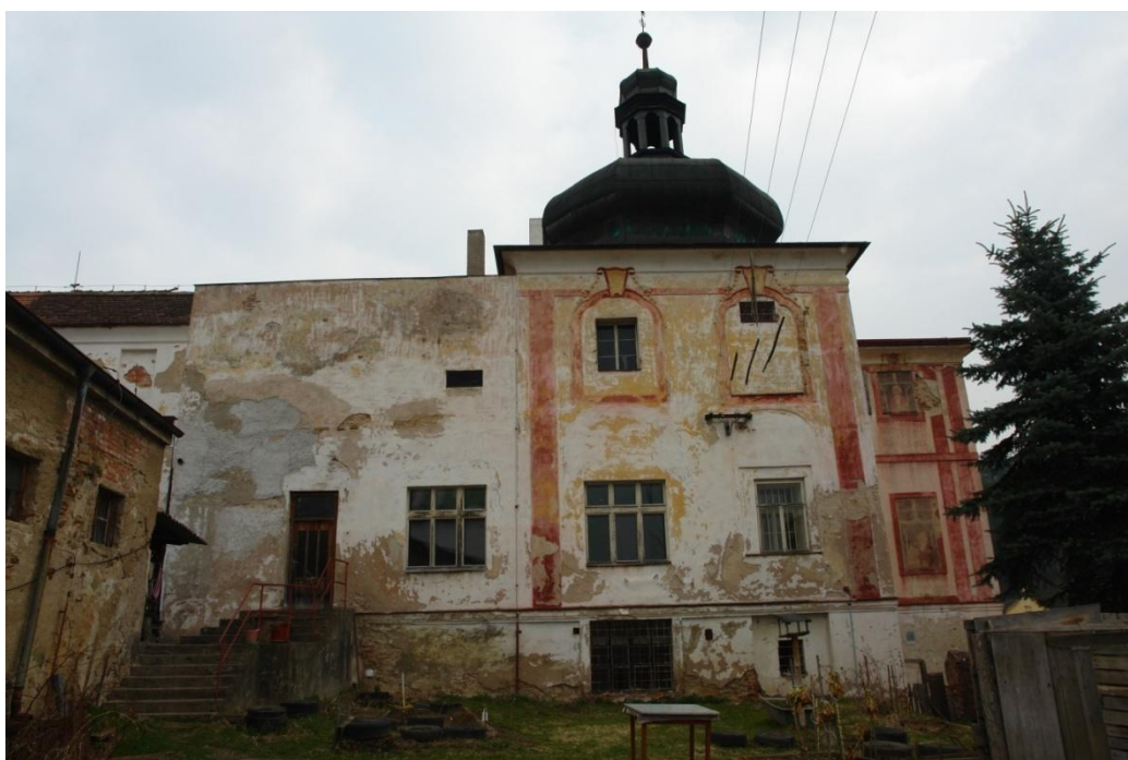
obr. 21 – jihozápadní strana zámku