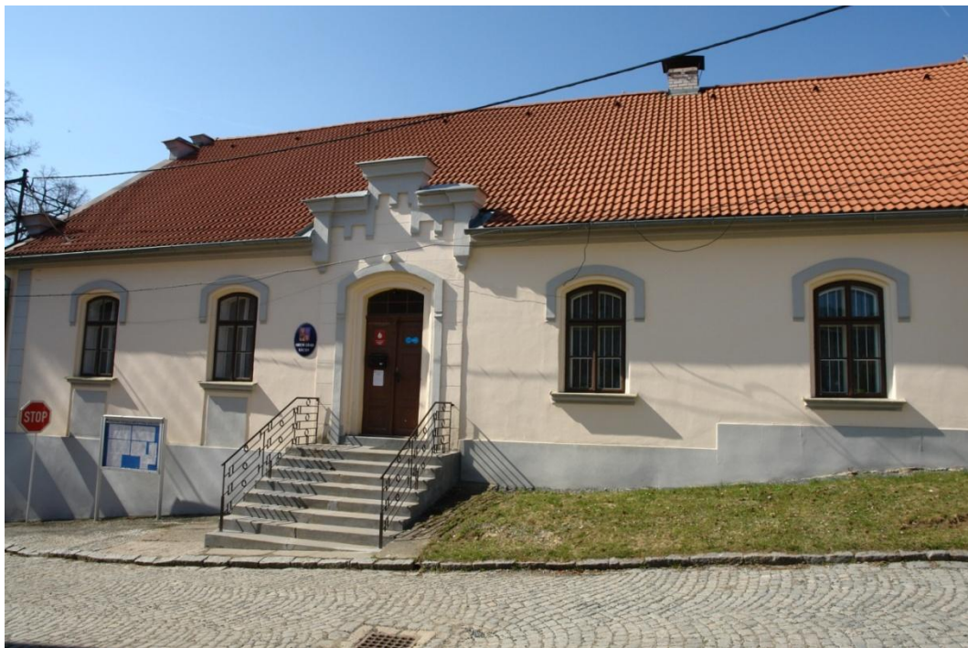
obr. 35 – dům č. p. 40 (radnice)