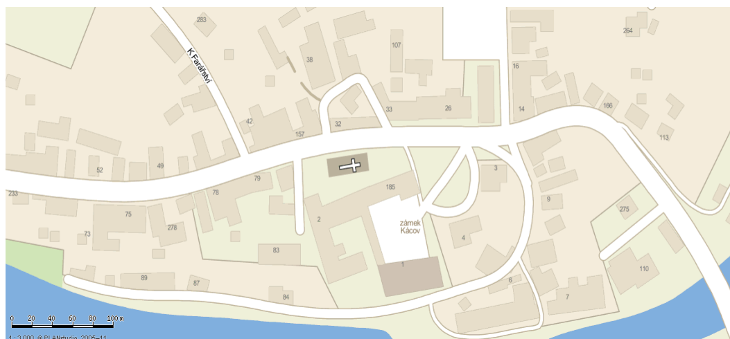
mapa č. 1

( http://www.mapy.cz/#x=15.028084&y=49.777630&z=16&c=2-8-3-15-14-x )