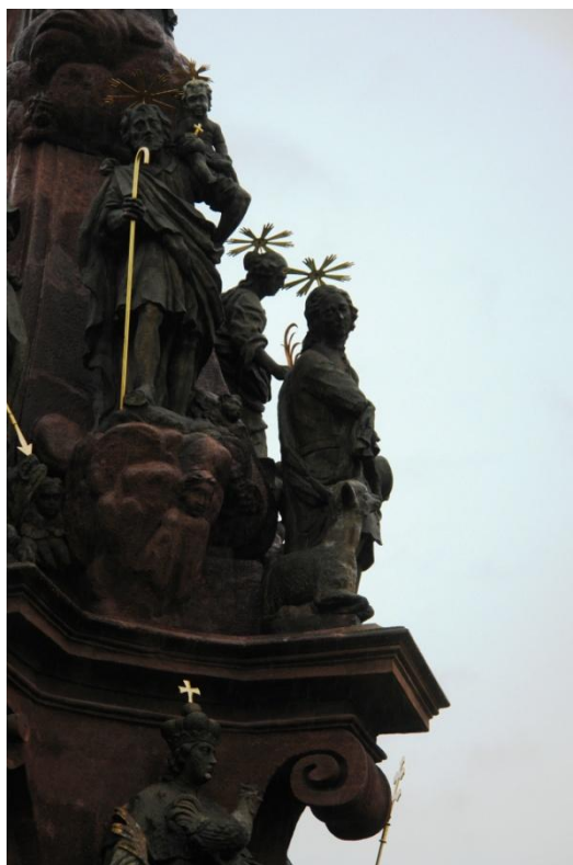
obr. 74 – sloup Čtrnácti pomocníků – sv. Jiljí