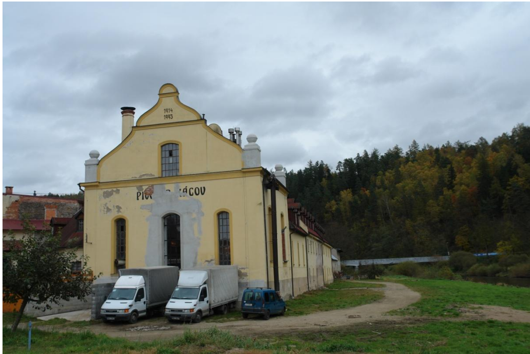
obr. 79 – budova pivovaru