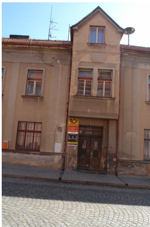
obr. 41 – domy č. p. 14, 15