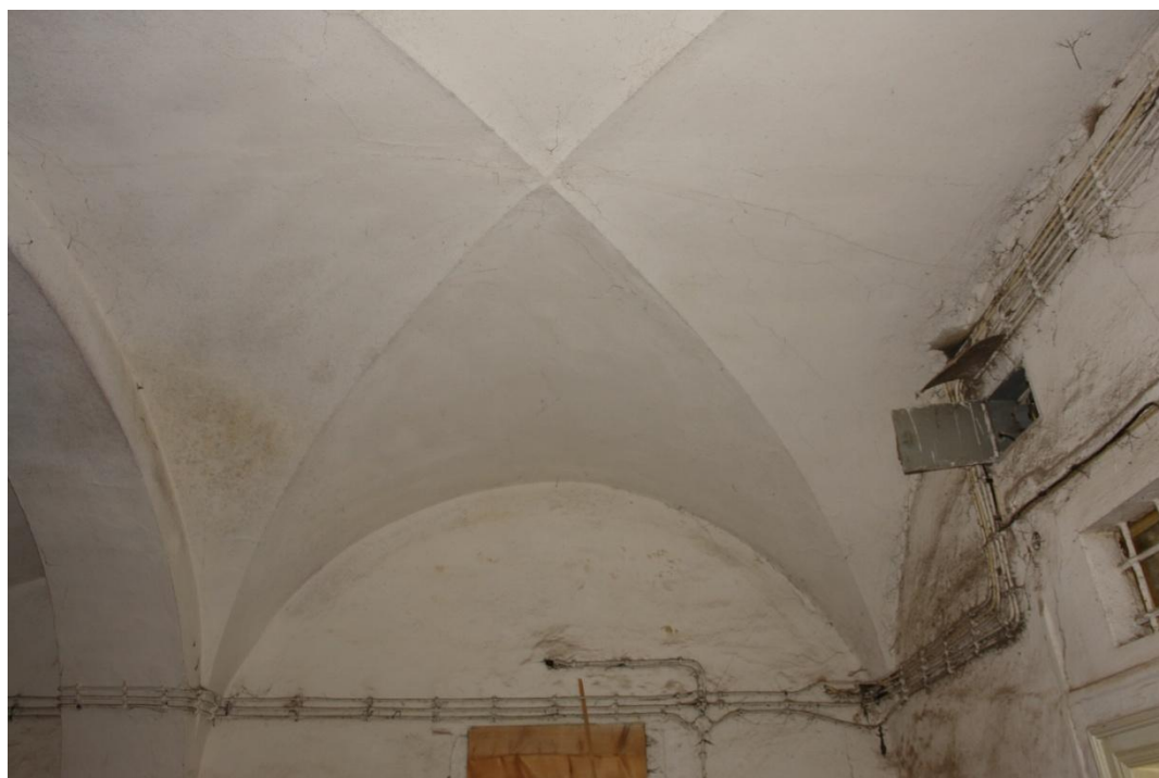
obr. 2 – první suterén (křížová klenba)