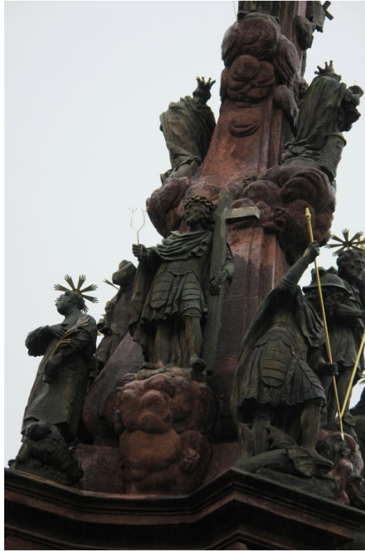
obr. 67 – sloup Čtrnácti pomocníků – sv. Achác