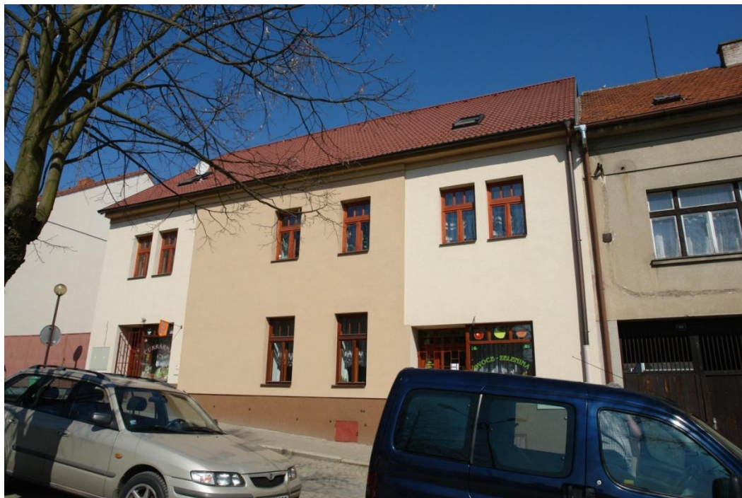
obr. 51 – dům č. p. 28