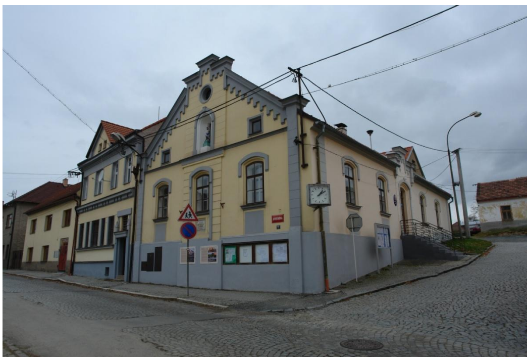
obr. 36 – dům vedle radnice č. p. 32