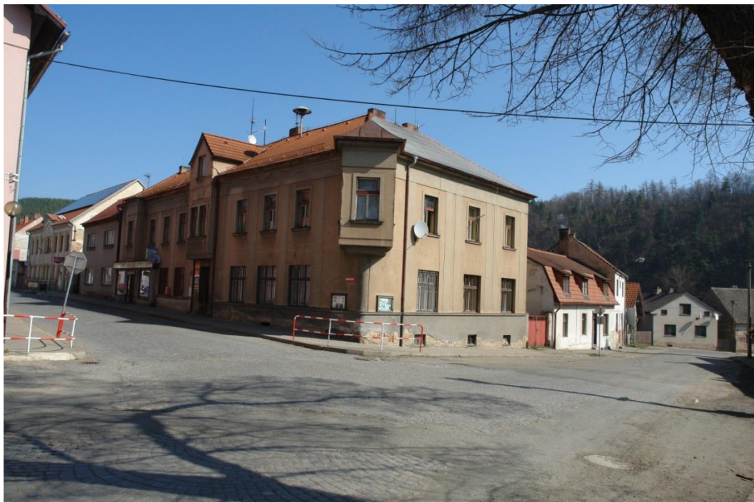
obr. 40 – domy č. p. 14, 15