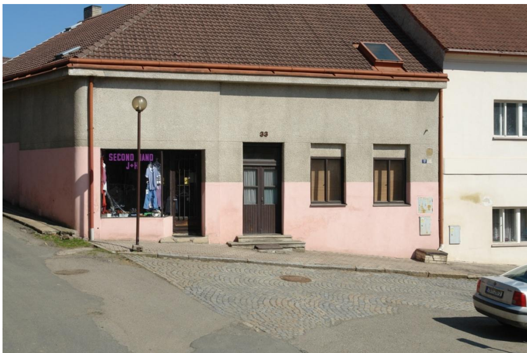
obr. 53 – dům č. p. 33