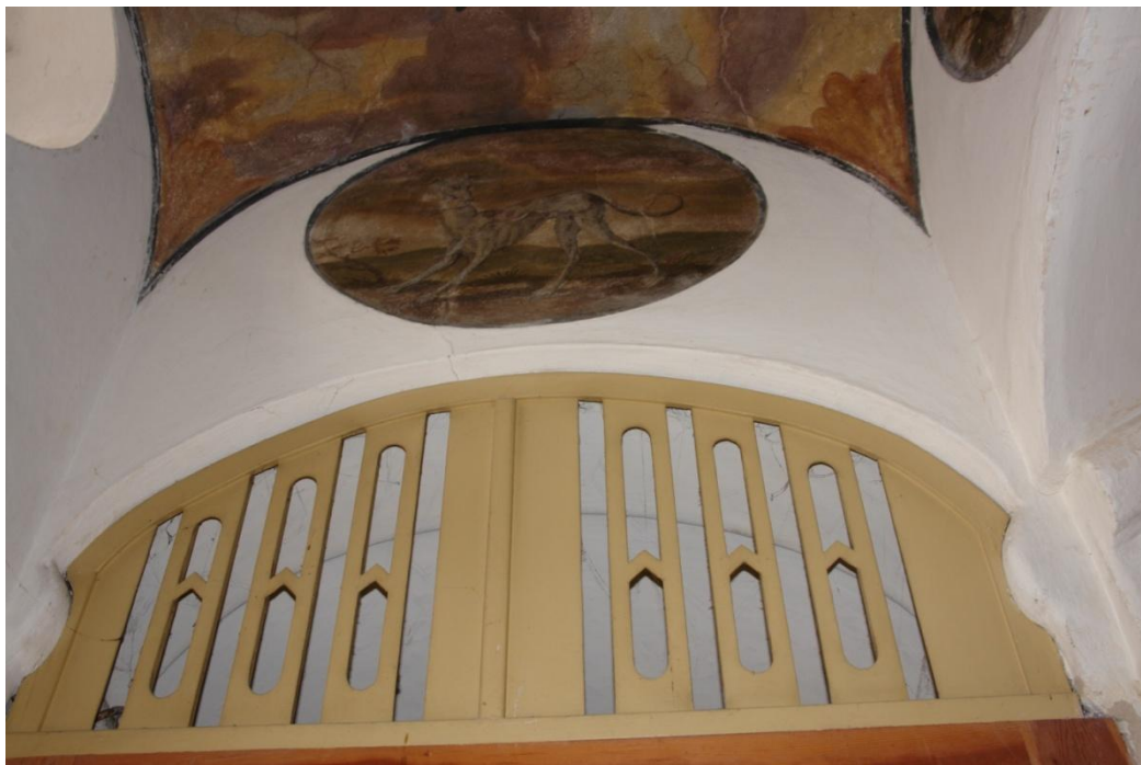
obr. 17 – strop u vchodu do zámku s barevnými loveckými motivy