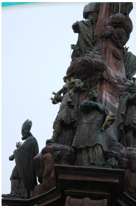
obr. 72 - sloup Čtrnácti pomocníků – sv. Cyriak