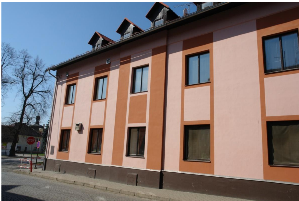
obr. 43 – dům č. p. 24 (hotel)