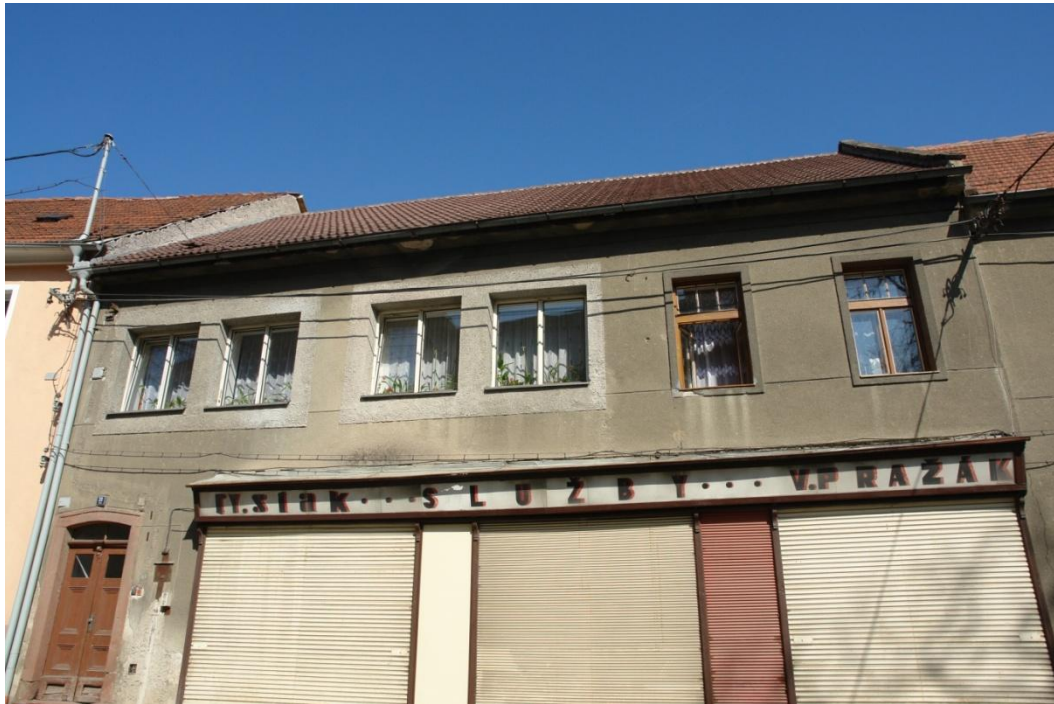
obr. 55 – domy č. p. 29, 30