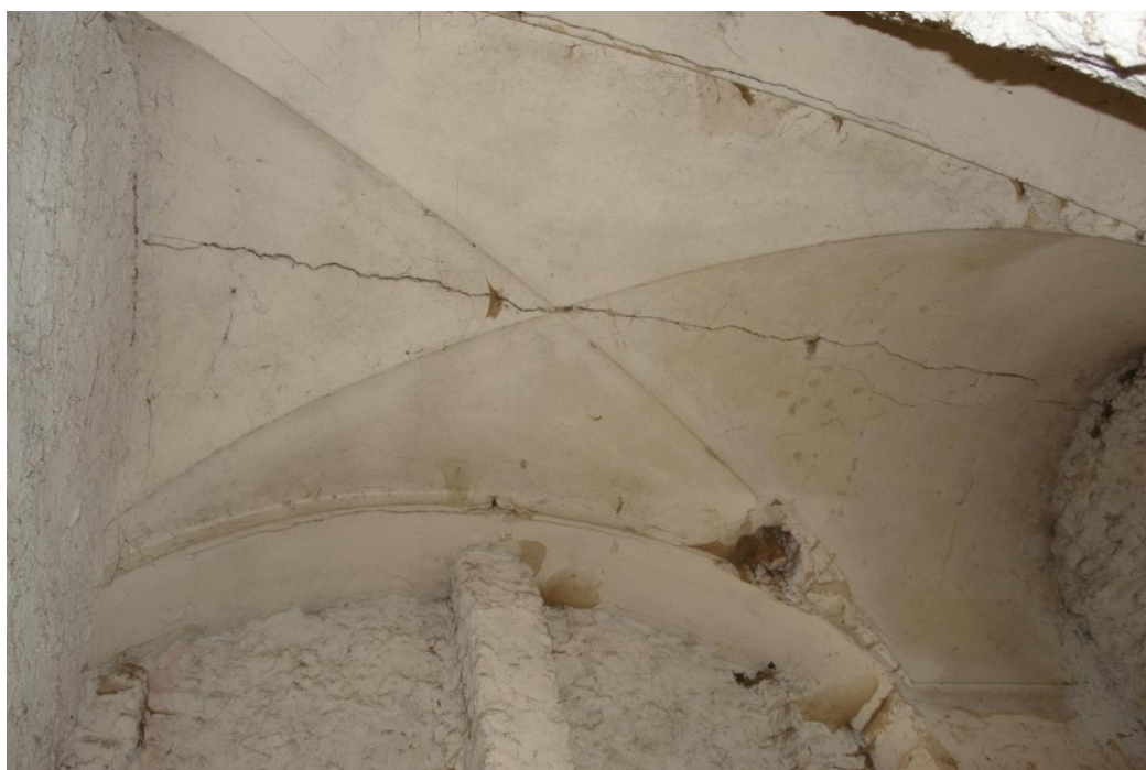
obr. 9 – spojovací chodba mezi zámekem a kostelem, v přízemí zaklenuto křížovou klenbou