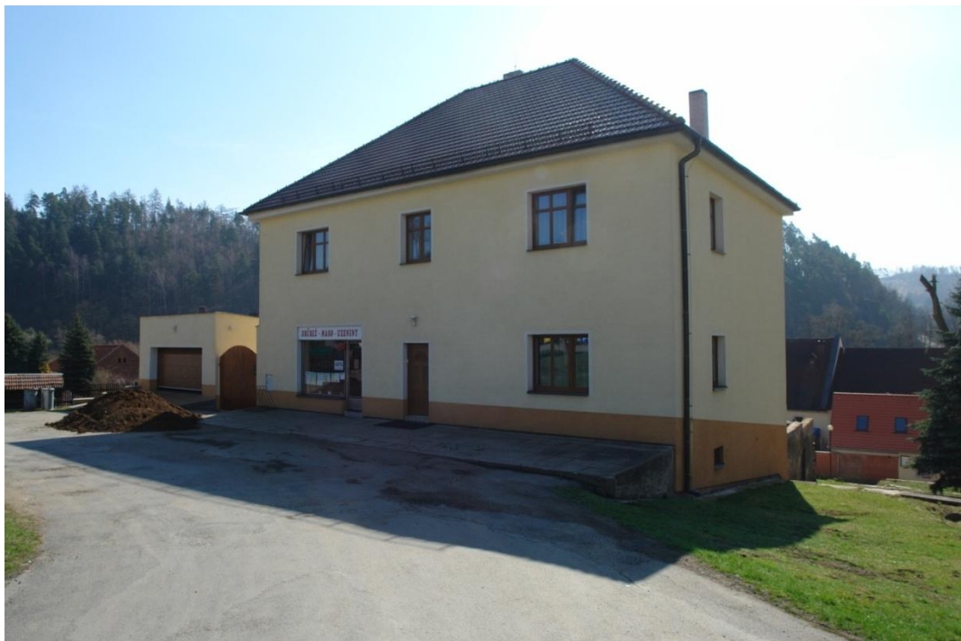
obr. 38 – dům č. p. 4