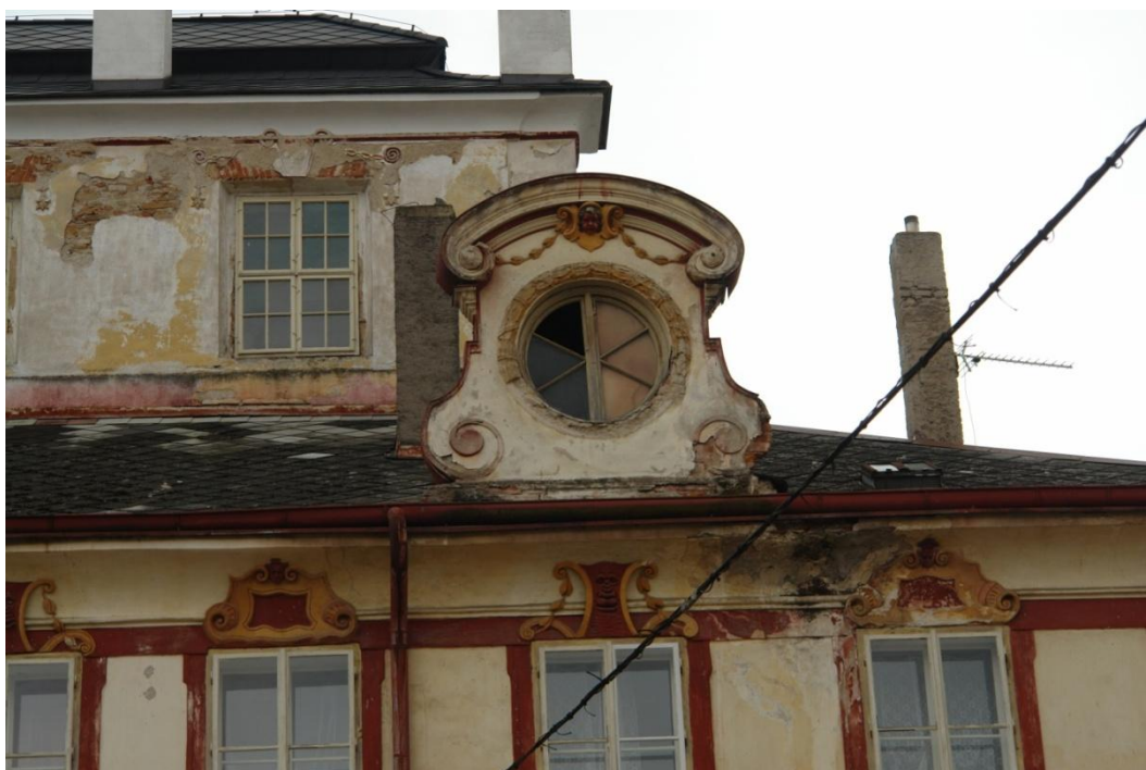
obr. 28 – severní strana, vikýř s kruhovým oknem