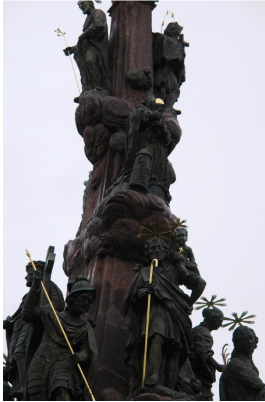
obr. 65 – sloup Čtrnácti pomocníků – sv. Barbora