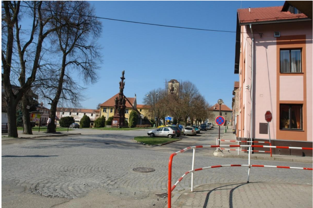
obr. 45 – prostor náměstí v Kácově z východní strany