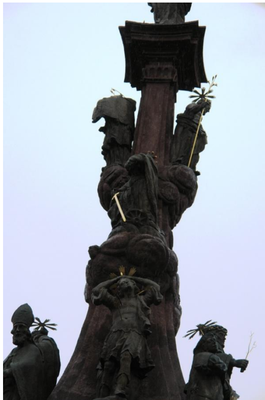
obr. 66 – sloup Čtrnácti pomocníků – sv. Kateřina Alexandrijská