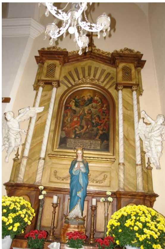
obr. 59 – oltář s obrazem Čtrnácti svatých pomocníků