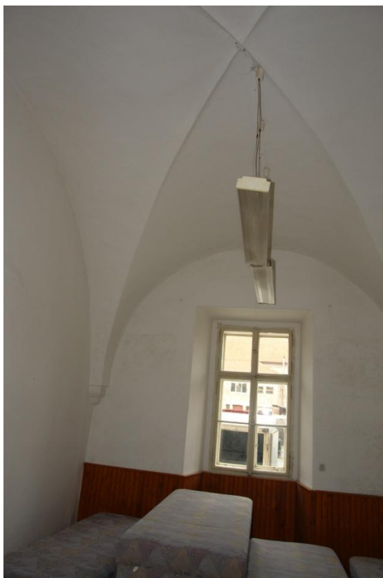
obr. 15 – přízemí, severovýchodní místnost s křížovou klenbou