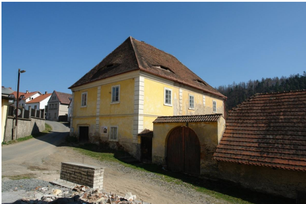
obr. 57 – nová barokní farní budova