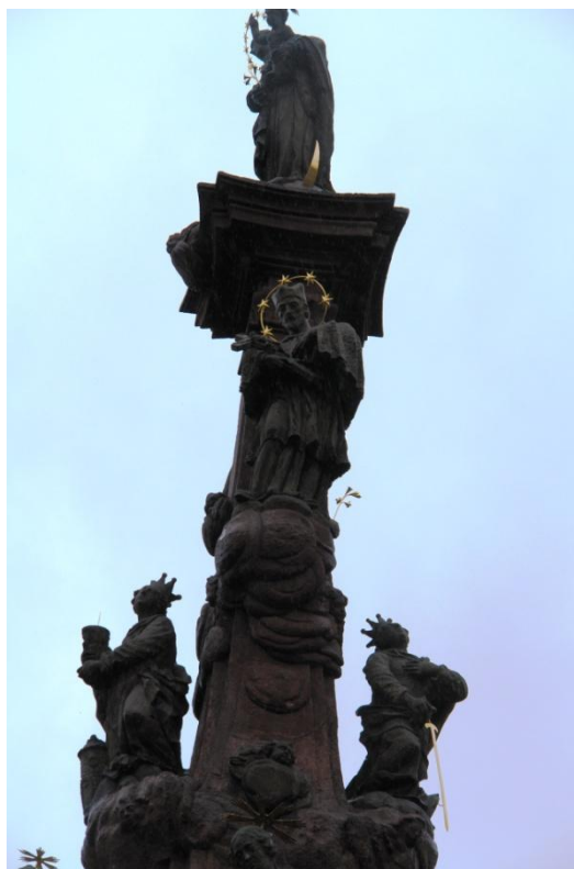
obr. 64 – sloup Čtrnácti pomocníků – sv. Jan Nepomucký