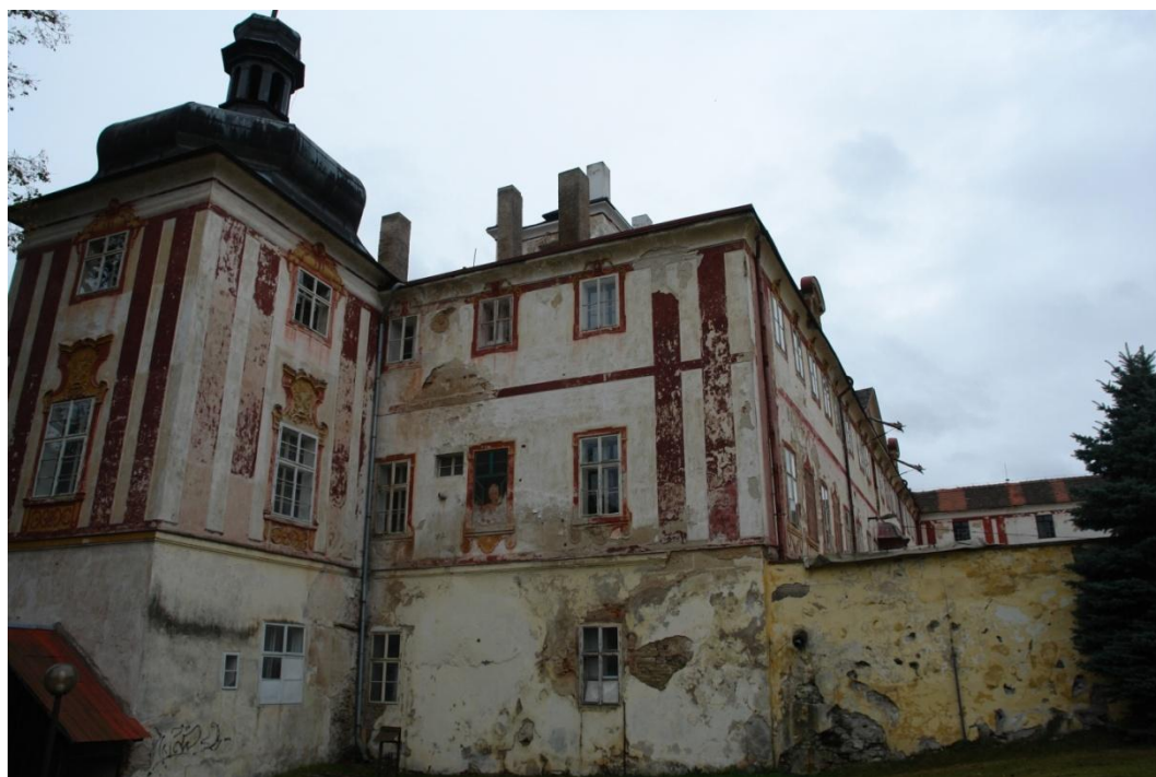
obr. 30 – východní strana zámku