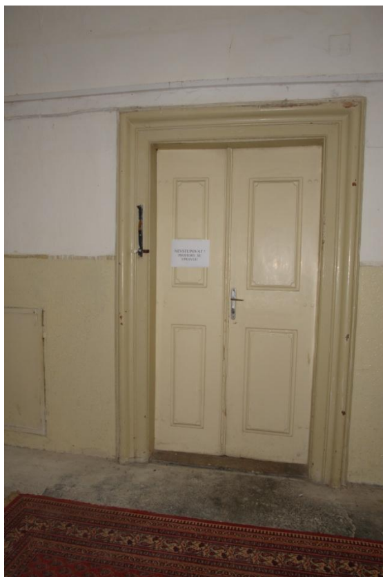
obr. 11 – chodba v přízemí, dveře do knihovny