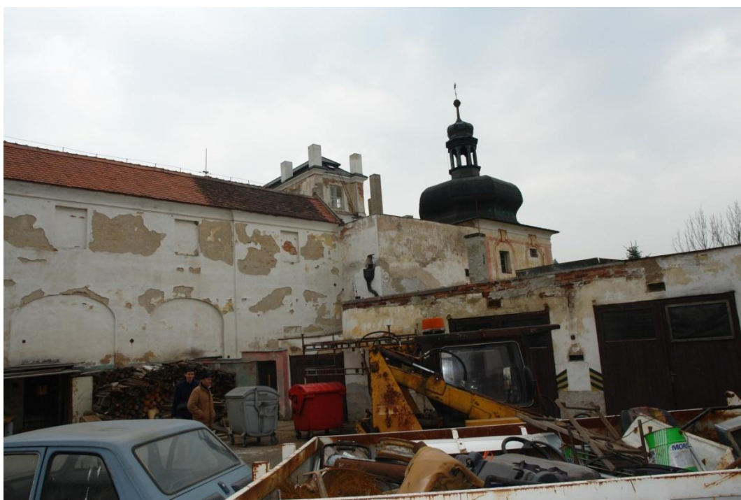
obr. 23 – západní strana zámku, foto z hospodářského dvora objektu