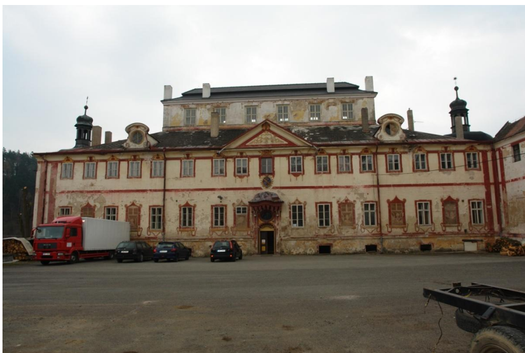
obr. 25 – severní strana zámku