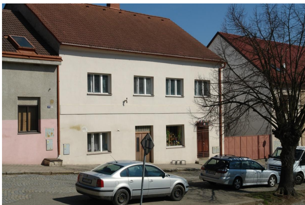
obr. 52 – dům č. p. 31