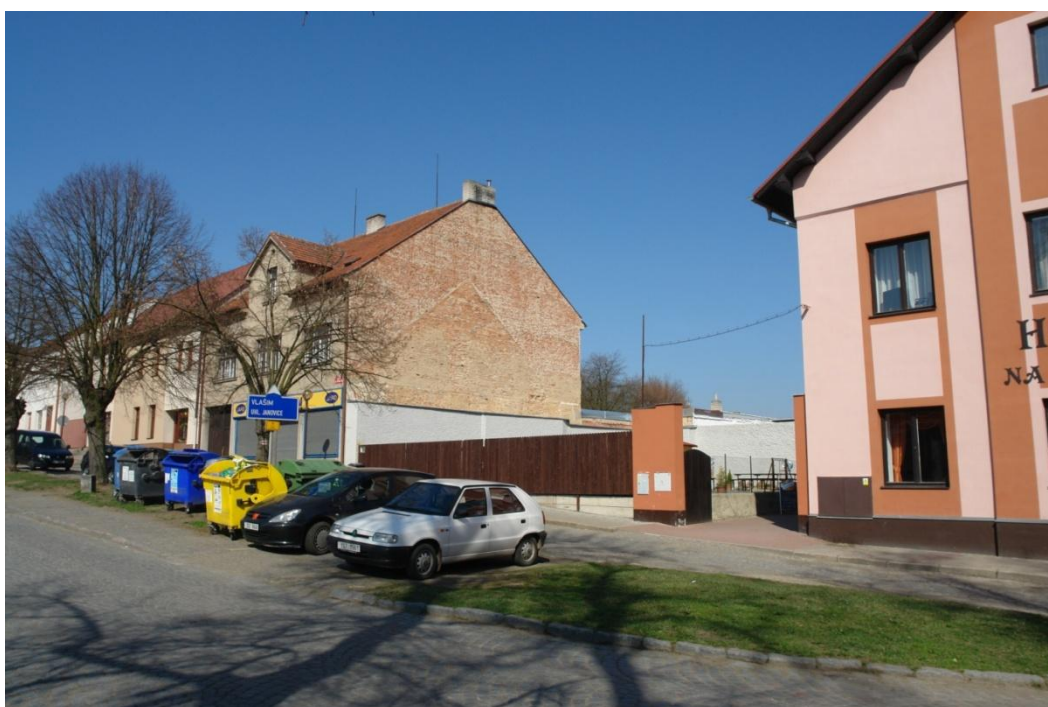
obr. 44 – zbytky menšího domu, dnes na místě domu zahrada