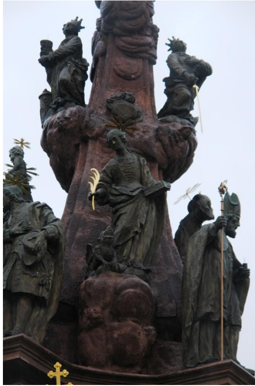
obr. 69 – sloup Čtrnácti pomocníků – sv. Markéta