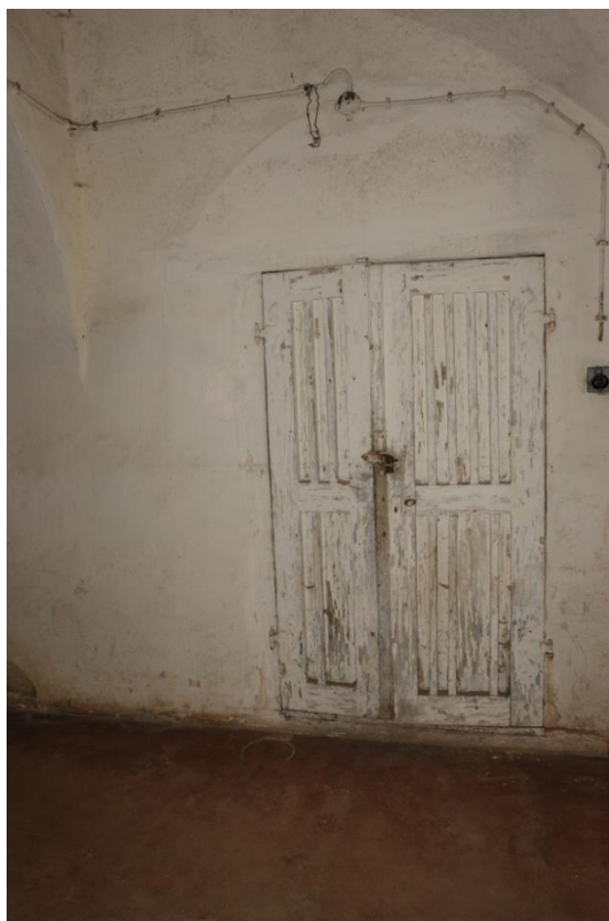
obr. 3 – první suterén (dochované barokní dveře)