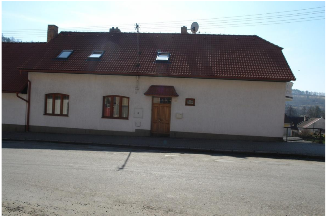
obr. 47 – dům č. p. 11