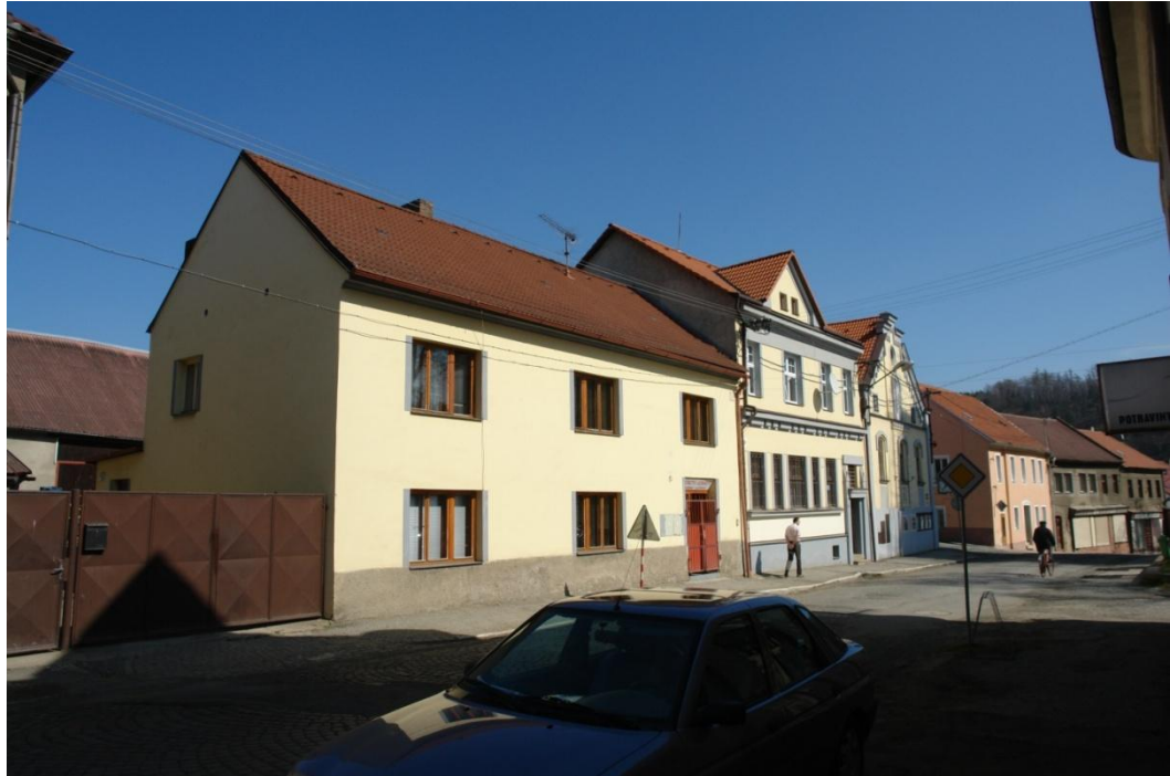
obr. 37 – dům č. p. 33