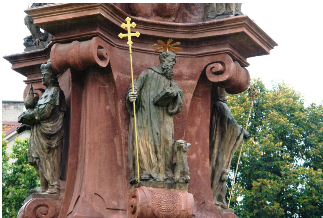
obr. 77 – sloup Čtrnácti pomocníků – sv. Eustach