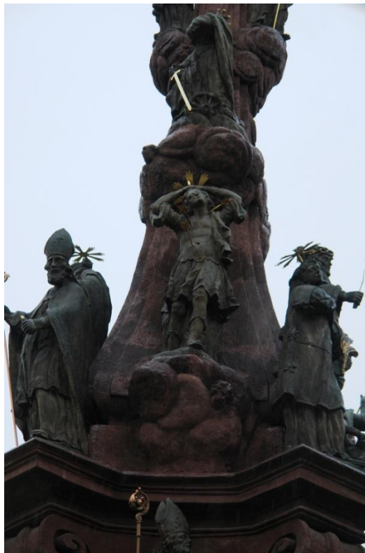
obr. 70 - sloup Čtrnácti pomocníků – sv. Pantaleon