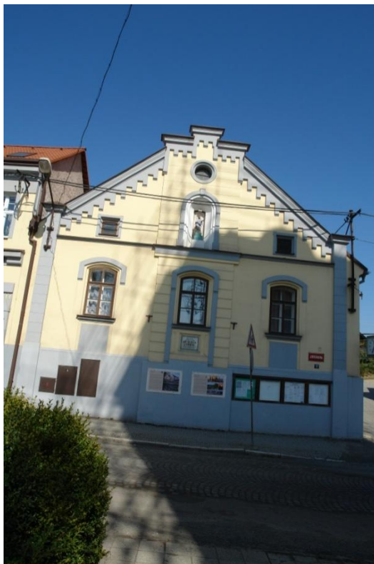
obr. 33 – dům č. p. 40 (radnice)