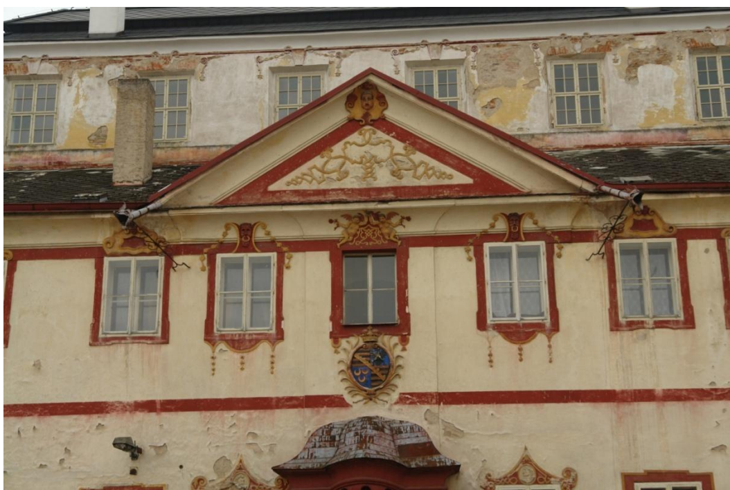
obr. 27 – severní strana, trojúhelníkový štít s maskaronem