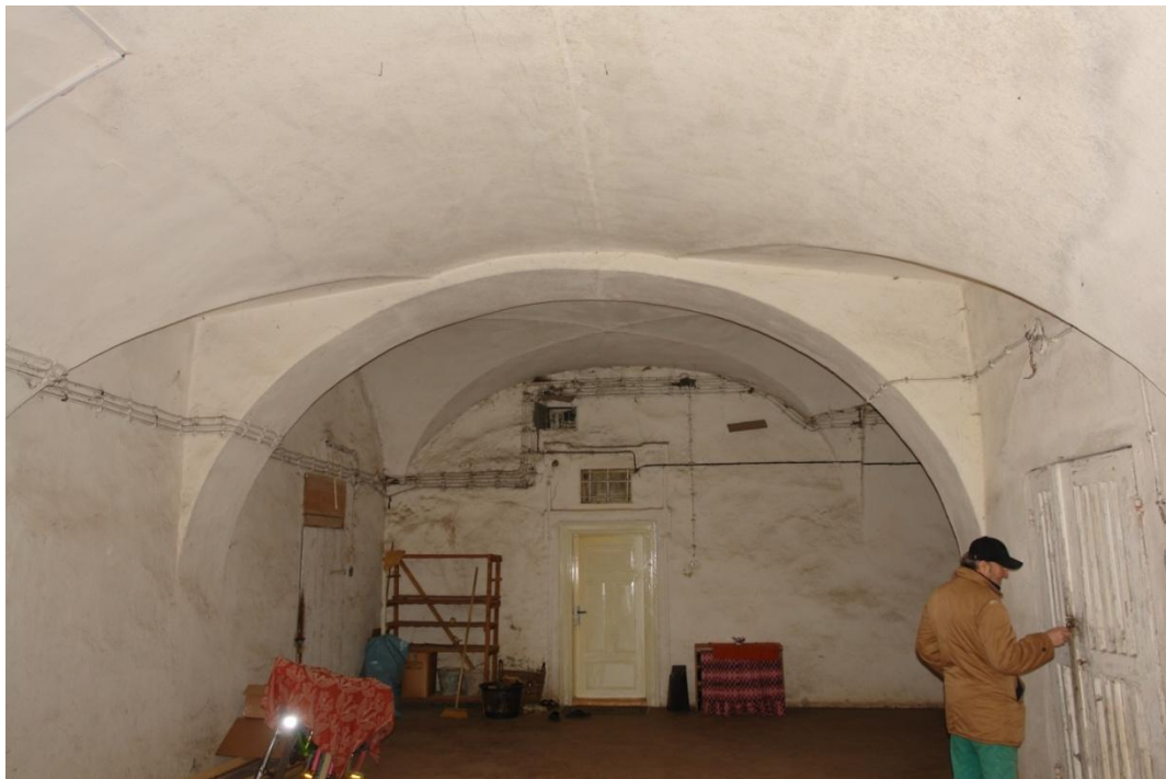
obr. 1 – první suterén