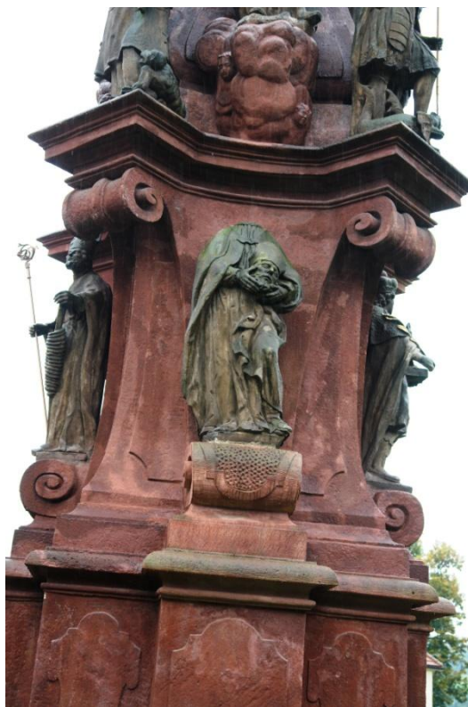
obr. 75 – sloup Čtrnácti pomocníků – sv. Diviš