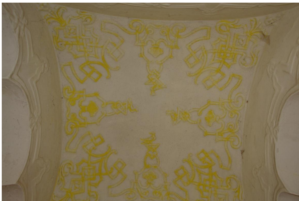
obr. 16 – schodiště do první patra, štuková ornamentika