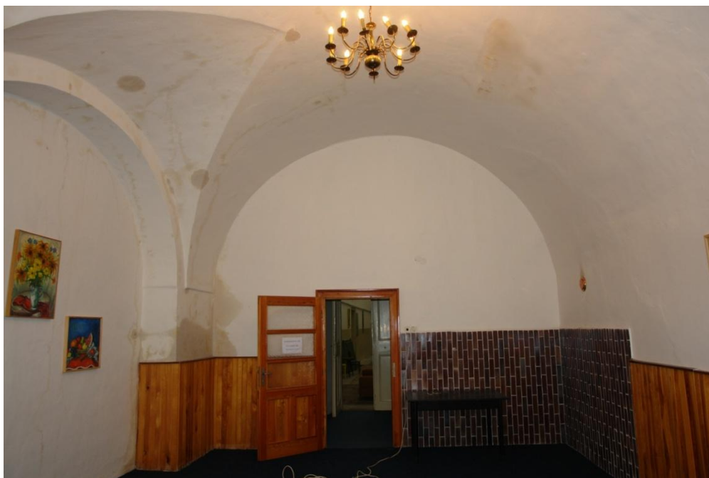
obr. 13 – přízemí, místnost na západní straně zaklenut valenou klenbou a hřebínky na lunetě