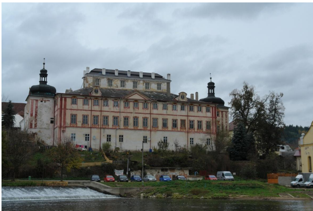
obr. 29 – jižní strana zámku