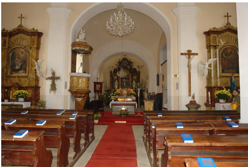
obr. 58 – kostel Panny Marie