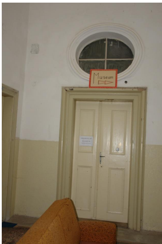
obr. 12 – chodba v přízemí, dveře na východní straně s eliptickým nadsvětlíkem