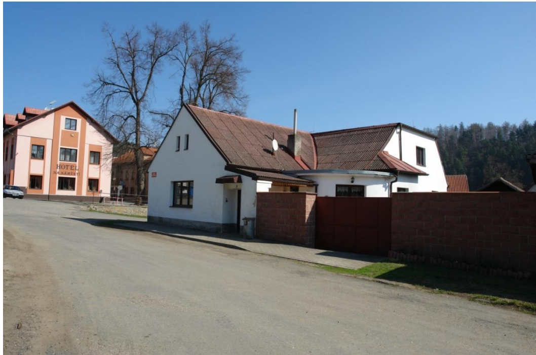
obr. 39 – dům č. p. 3