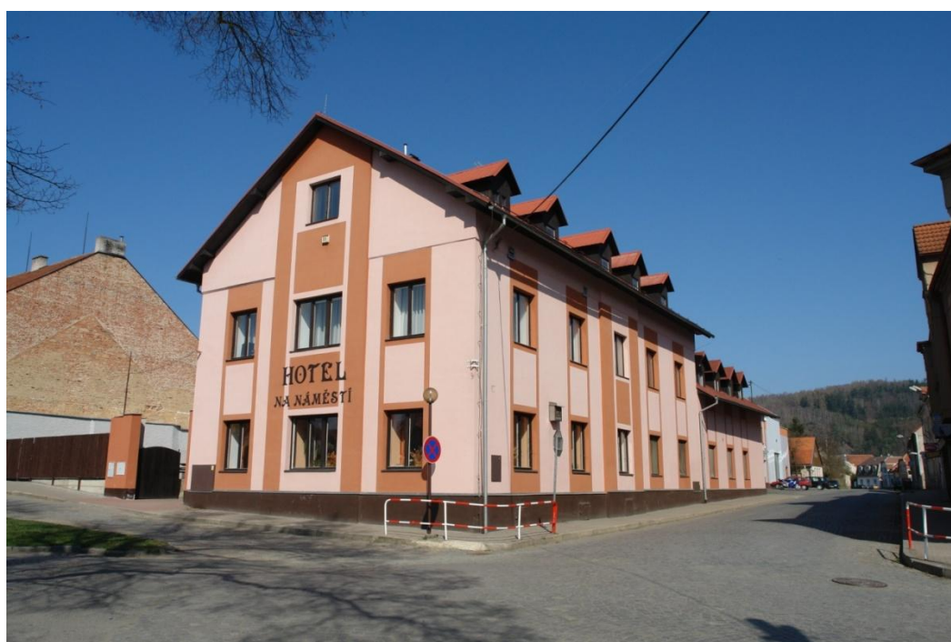
obr. 42 – dům č. p. 24 (hotel)