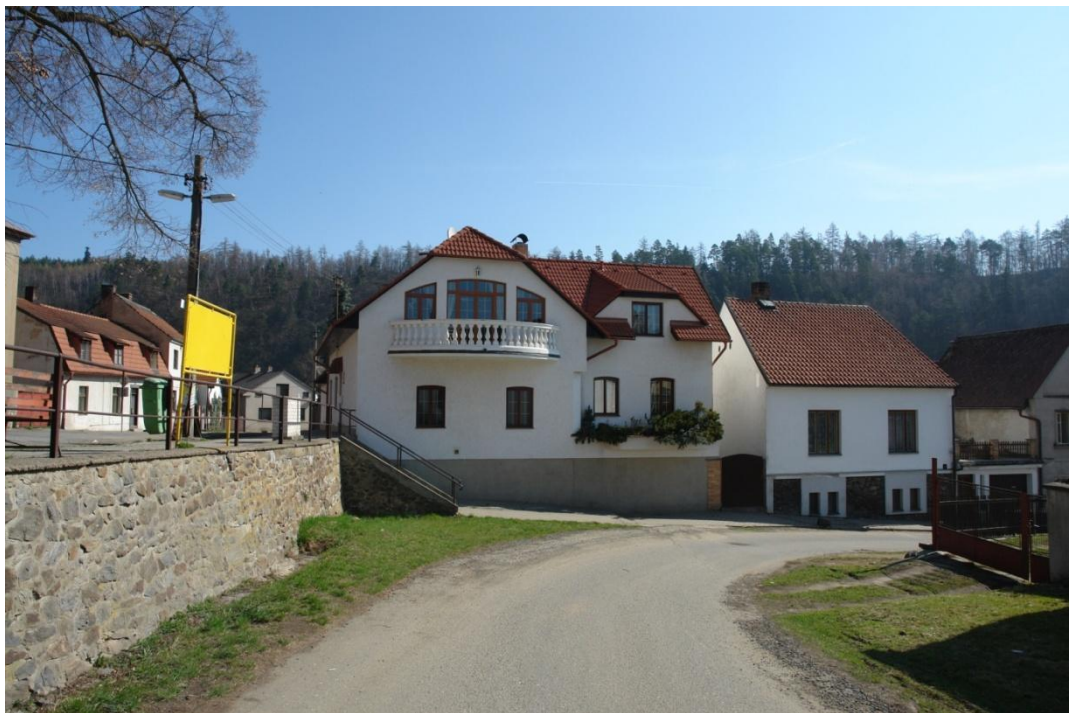
obr. 46 – dům č. p. 11