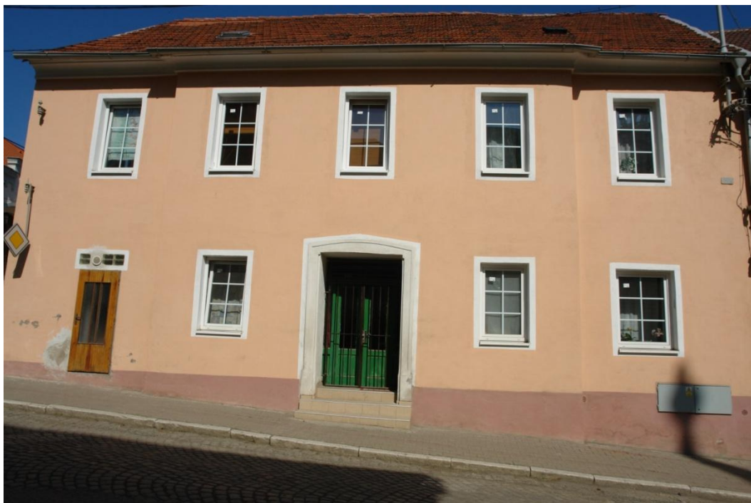
obr. 56 – dům č. p. 32