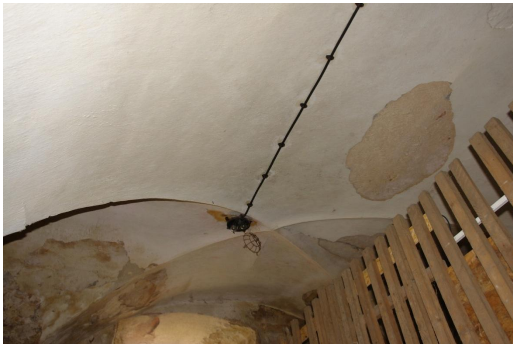
obr. 5 – první suterén (sklep nájemníka s křížovou klenbou)