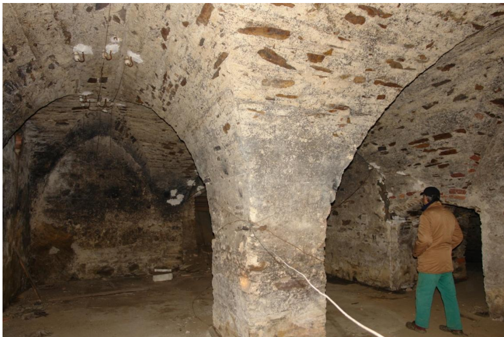
obr. 7 – centrální prostor druhého suterénu