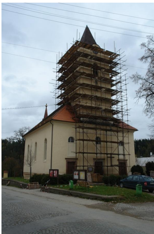
obr. 60 – kostel Panny Marie