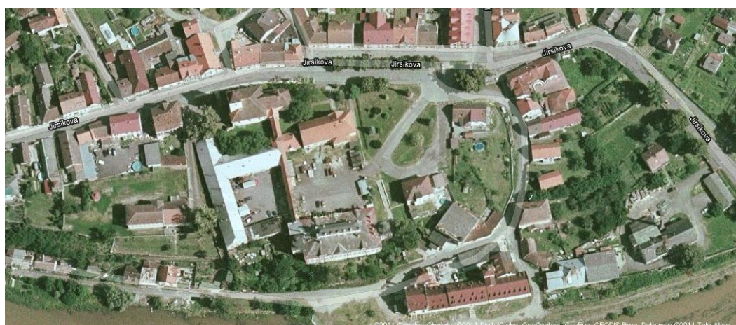
mapa č. 2

( http://www.mapy.cz/#x=15.028084&y=49.777630&z=16&c=2-8-3-15-14-x )