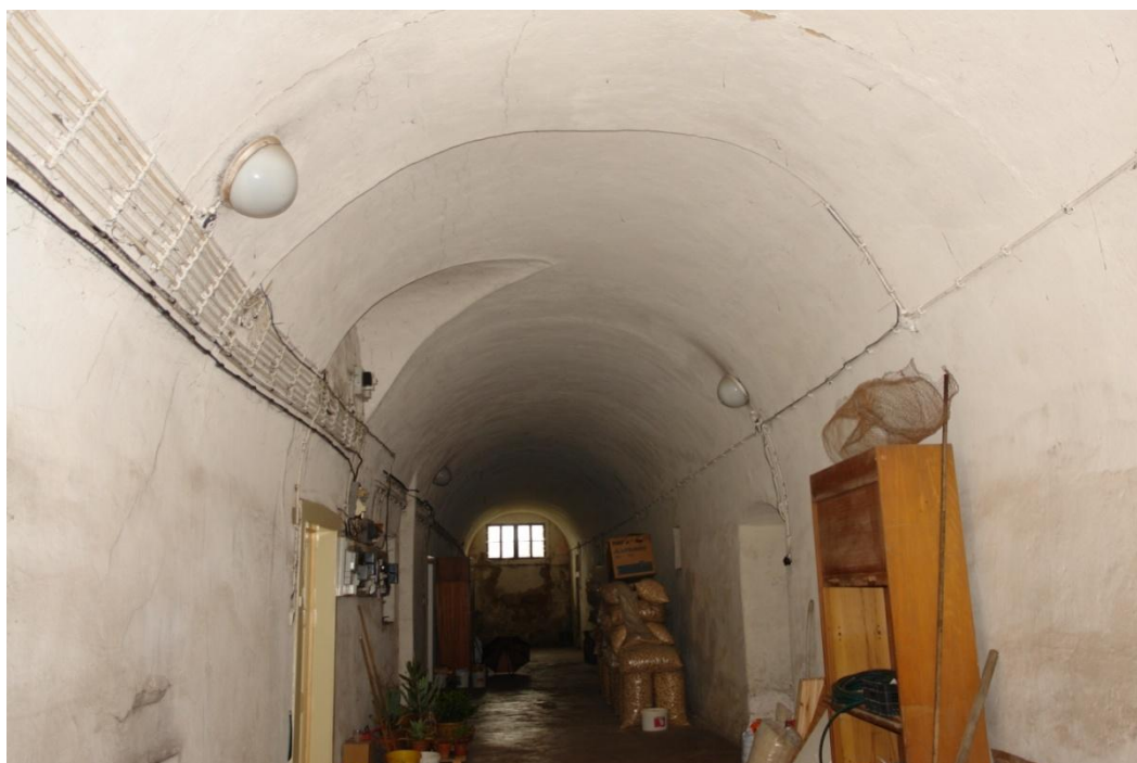
obr. 4 – první suterén (podélná chodba s valenou klenbou)