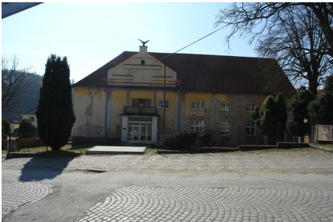
obr. 48 – dům č. p. 185 (sokolovna)