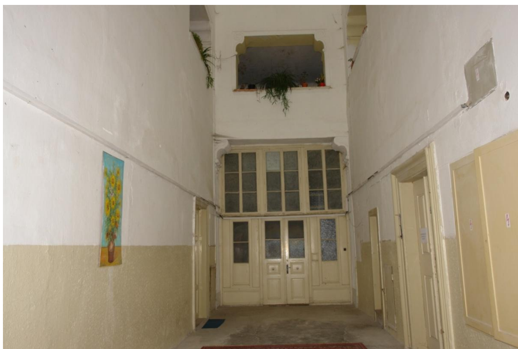
obr. 10 – západní strana chodby v přízemí