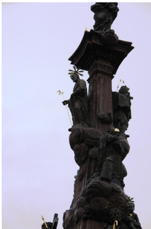
obr. 63 – sloup Čtrnácti pomocníků – sv. Josef