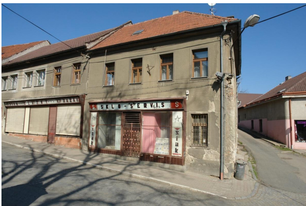
obr. 54 – domy č. p. 29, 30