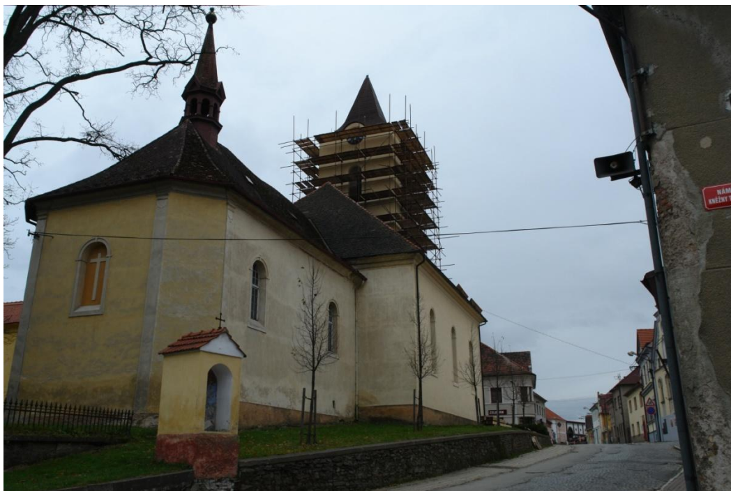
obr. 61 – kostel Panny Marie