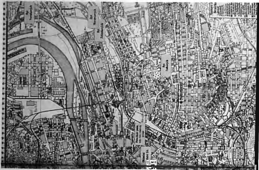
Mapa Prahy v době protektorátu