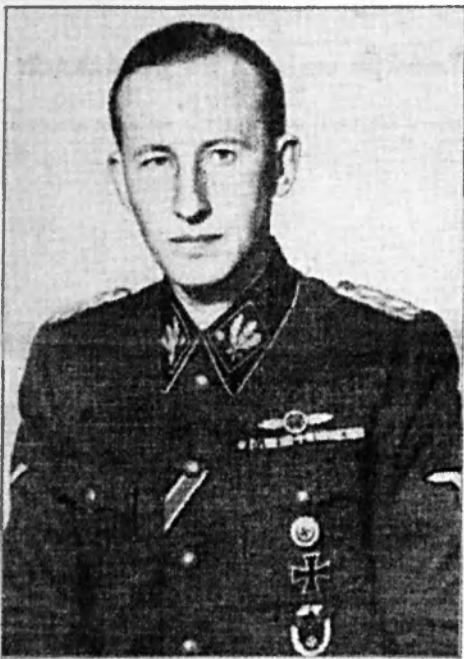
⚡ Obergruppenführer a generál polního maršála Reinhard Heydrich zastupující říšského protektora v Praze (s n. Maršál)