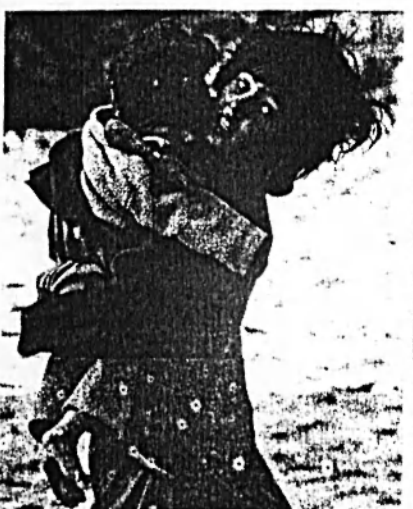
ČEKAL NA POMOC. Katniřské děti jsou do lábora pro obětí zemřelí v hranicích mezi Pákistánem a Indií. Oba státy se dohodly, že zjednoduší formalitky na hranicích, aby se k lidem snáze dostala pomoc. (Str. A16)

Indie a Pákistán kvůli změtěšení otevřou hranici