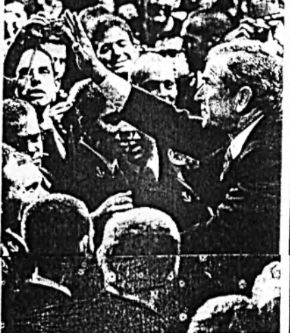
ZÁSADNÍ PROJEV. Americký prezident George Bush se zdrávil se stádaty americké akademie. Krátce poté přednesl zásadní projev, ve kterém popsal svou strategii pro účast amerických vojáků v Iráku. „Odejeme, až zvítězíme,“ řekl Bush. Přesto je rozhodnut část vojáků stáhnout. Více na str. A8

George Bush včera popsal strategii USA v Iráku