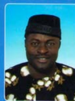
HON. ONYIAH ONYIAH SECRETARY GENERAL