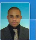
HON. OKECHUKWU IWANKWA