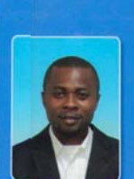
HON. ONYIAH ONYIAH TREASURER IPU