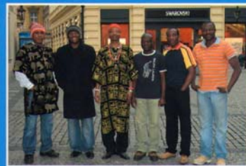
FOUNDING FATHERS OF IPU