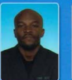
HON. OKECHUKWU IWANKWA