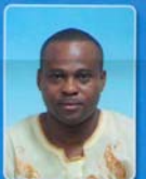
HON. OKECHUKWU IWANKWA