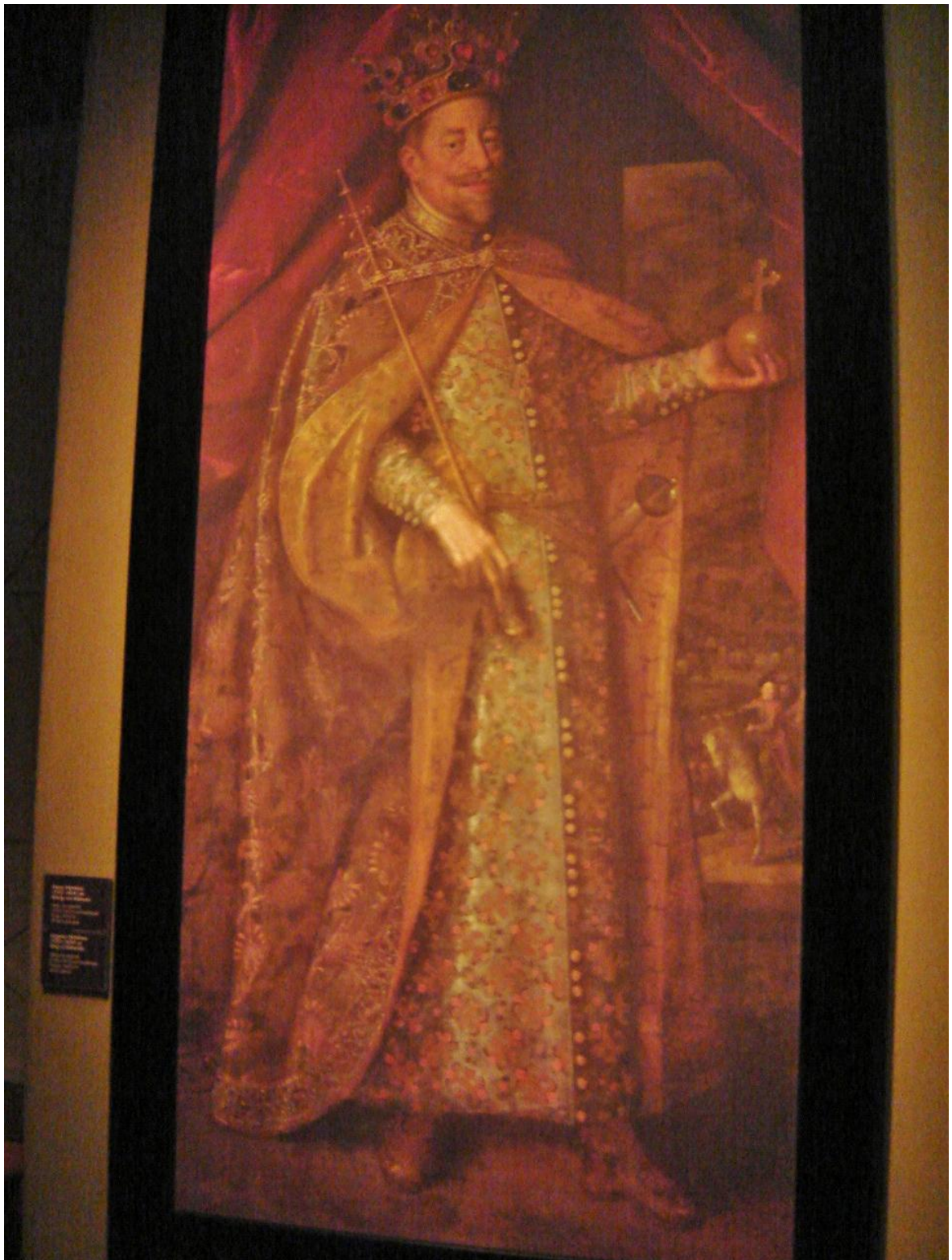
Příloha č. 9: Hans von Aachen, Kaiser Matthias als König von Böhmen , olej na plátně. (Schatzkammer HofburG Wien , inv. č. 3254).