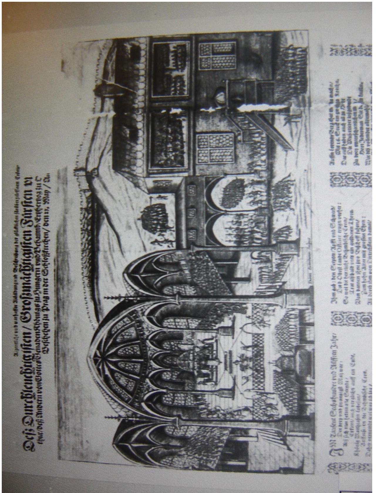
Příloha č. 8: Krönung Kaiser Matthias' zum König von Böhmen (23. 5. 1611) - výřez, (Germanisches Nationalmuseum Nürnberg, sbírka grafiky, inv.č. HB 24873).