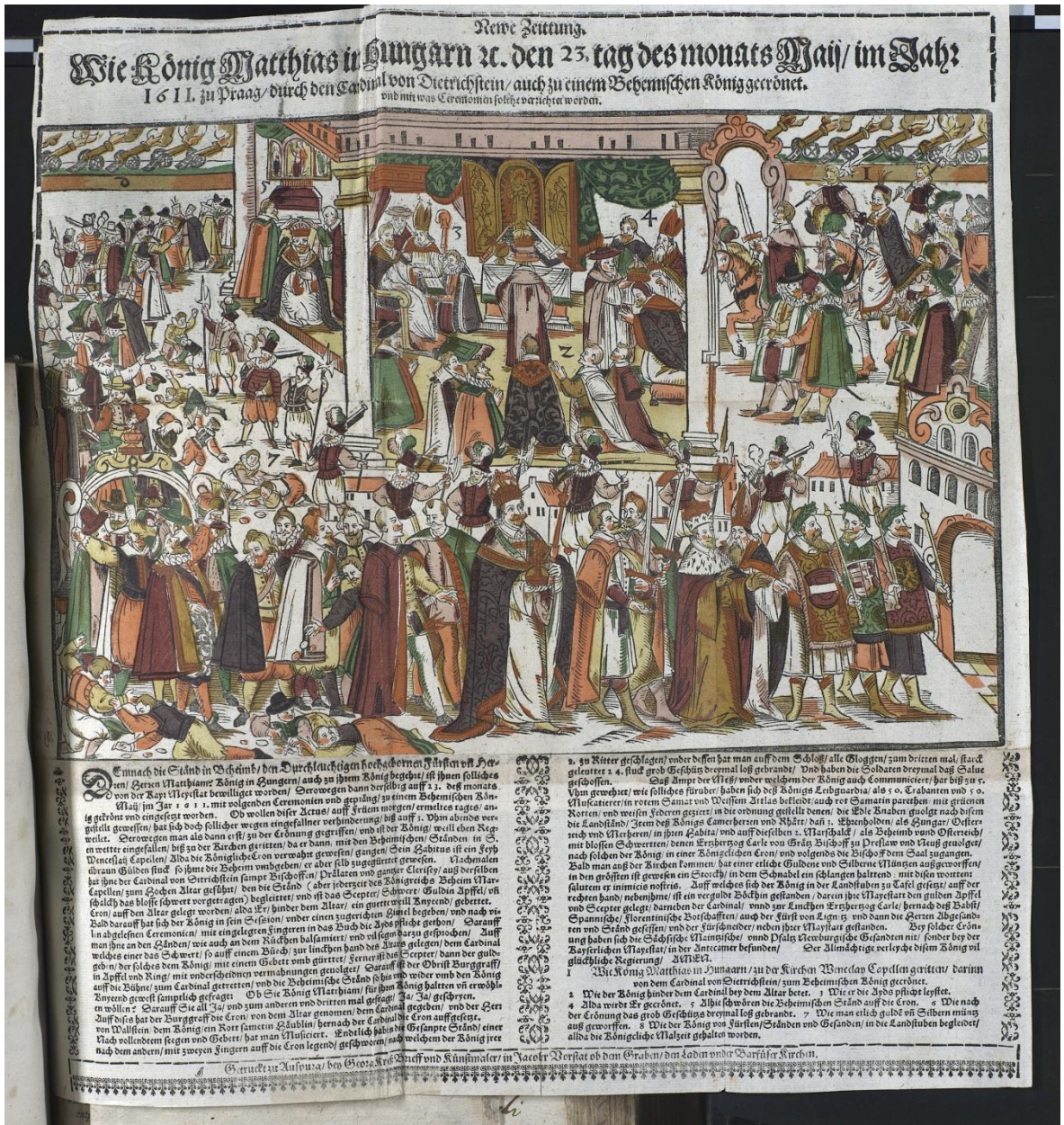
Priloha č. 6: Neue Zeitung (OSTA – HHSTA, vlepeno do HS W 57, Bd. 2, fol. 444).