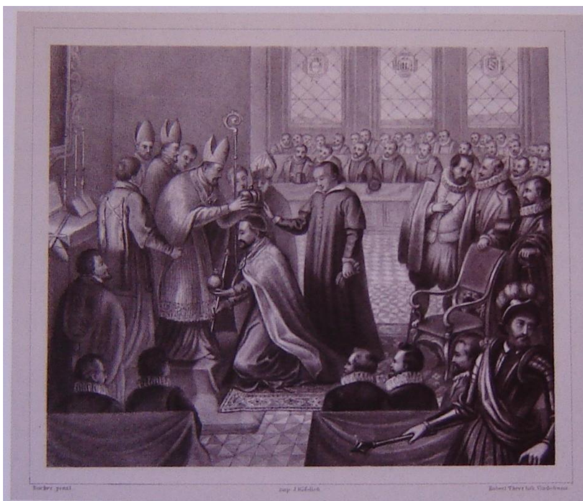
Příloha č. 10: Sceptra Bohemorum Mathiae datque coronam. Litografie Roberta Theera podle kreseb Josefa Buchera (Regionální muzeum v Mikulově, inv.č. 4363).