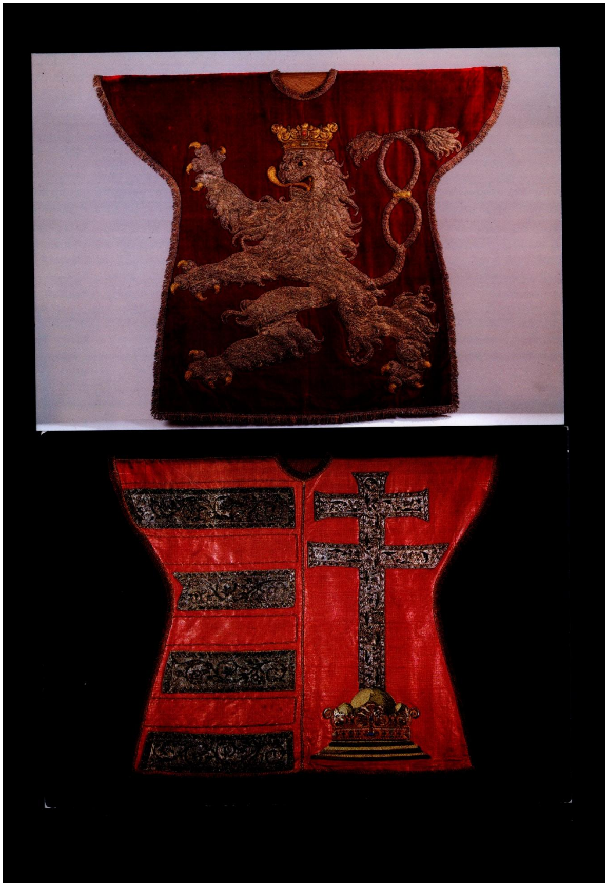
Příloha č. 11: Wappenrock , heroldské pláště pro českého a uherského krále, Vídeň 17. stol. (Kunsthistorisches Museum Wien, v současné době vystaveny v Schatzkammer v Hofburgu).