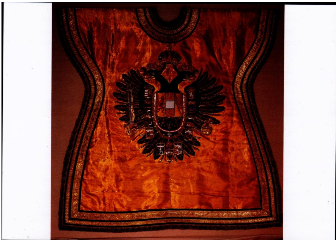
Příloha č. 12: Plášť tzv. Wappenrock pro císařského herolda, Vídeň 1830 (Kunsthistorisches Museum Wien, v současné době vystaven v Schatzkammer v Hofburgu).