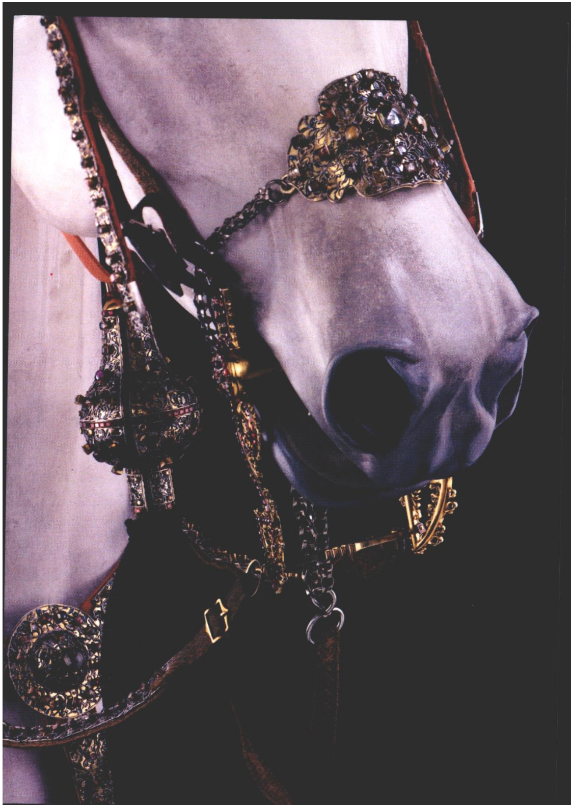
Příloha č. 13: Část ozdobného koňského postroje, vyrobeného v roce 1610 na zakázku saského kurfiřta v Praze (Staatliche Kunstsammlungen Dresden).