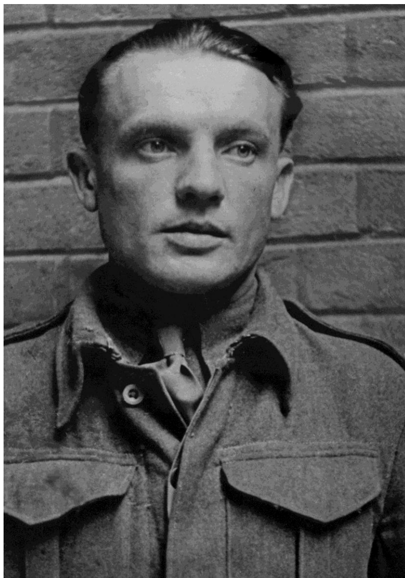
Obrázek 5 - Karel Čurda