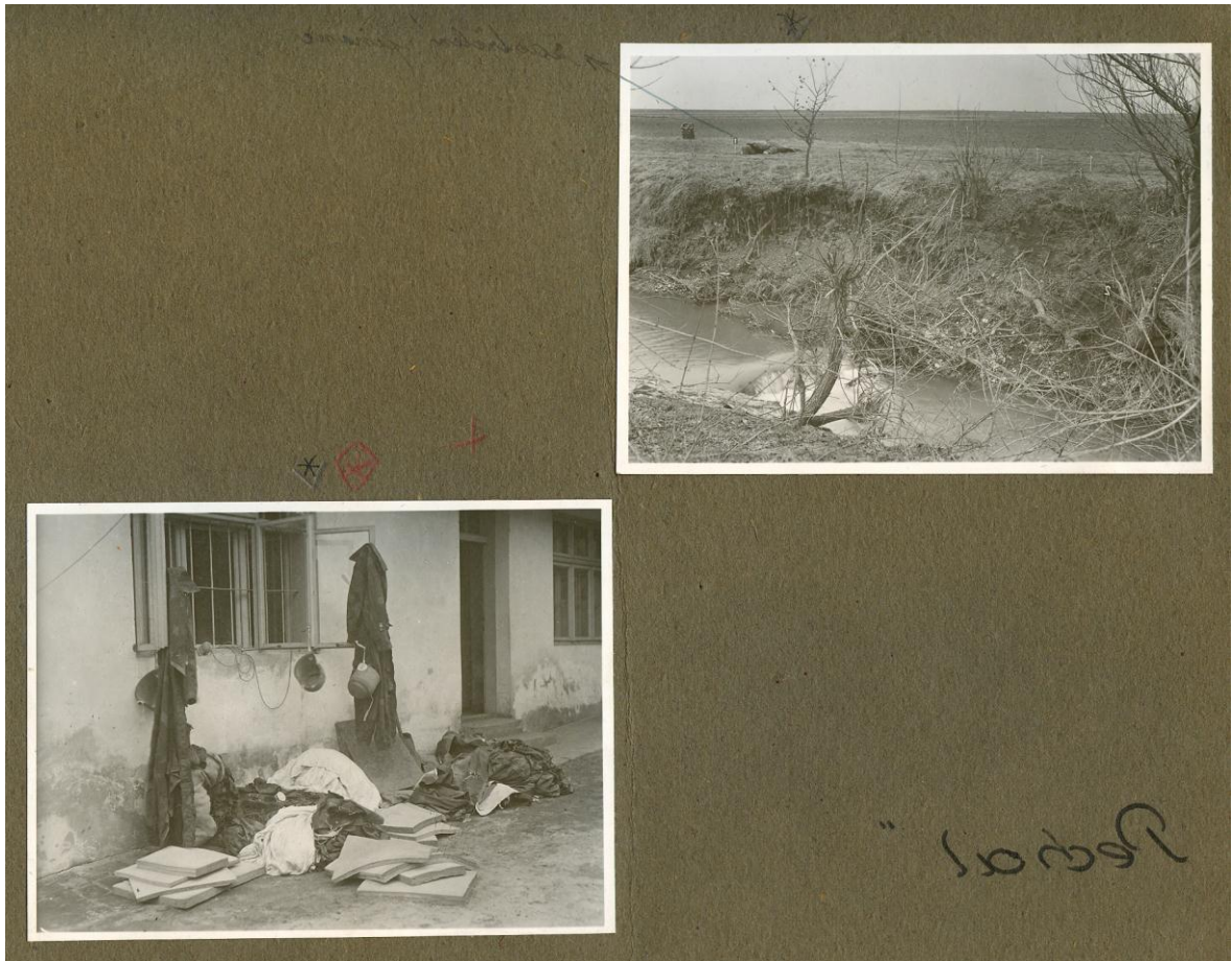
Obrázek 11 - Operační materiál skupiny ZINC